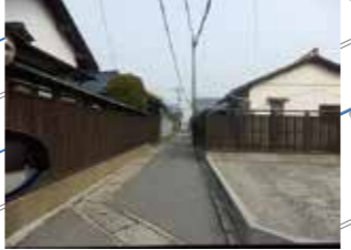
道路が狭く、避難道路としては無理