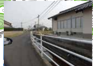
笹荒神社付近逆流の恐れ