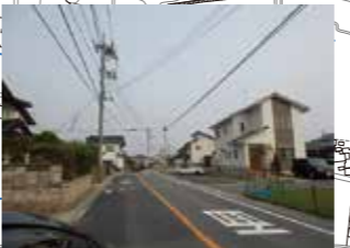
歩道がなく交通量が頻繁 二次災害の恐れ