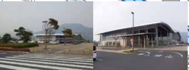
避難場所 カミアリーナ