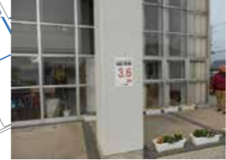
荒木コミセン、海拔 3.6m 建物の高さとしては低い