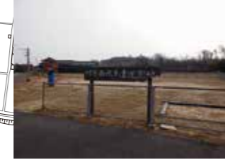
川方児童公園は避難場所に適さない