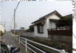
河川の危険箇所(川方～駅通りまで)