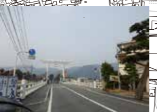
勢溜りに避難する場合、河川の危険箇所を通る