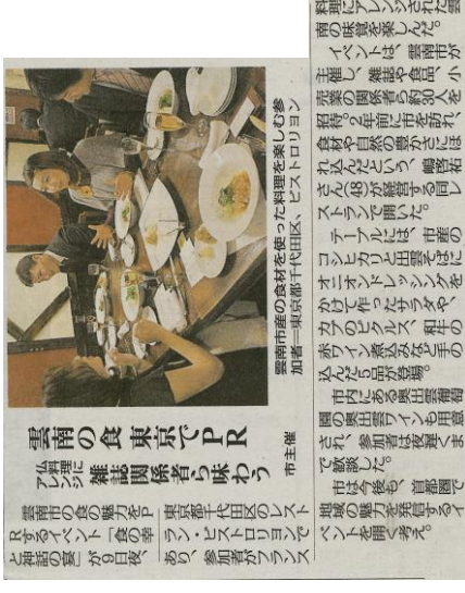
『雲南らしい食 PR 事業』により開催した、都内レストラン（ビストロリヨン）での“食の幸”と神話の宴”