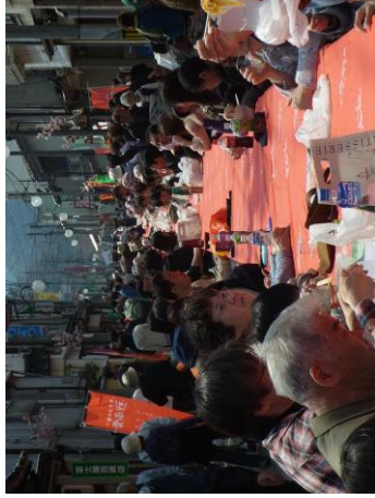
『「食の幸」PR 事業運営委託』により実施した「幸運なんです。雲南です。」体感フェア [イメージ：賑わいをみせる雲南食堂 100mのロングテーブル]