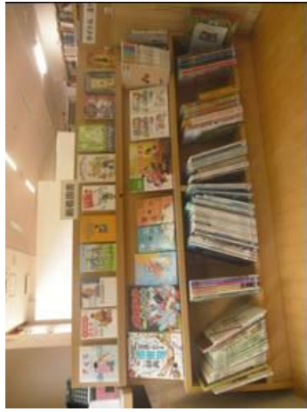
『市立図書館整備事業』により整備した、書架や蔵書 [イメージ：書架と絵本]