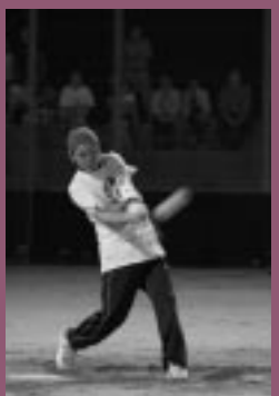
ホームラン競争優勝の早稲選手(野萱)

球場で開幕しました。今年は町内から7チームが参加し、リーグ戦方式で優勝を目指して戦います。