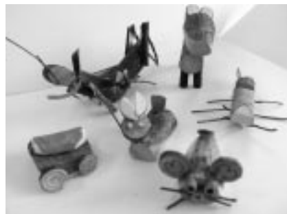
木の枝でつくる虫や動物

お問い合わせ 飯南病院 TEL72-0221 来島診療所 TEL76-2309 保健福祉課 TEL72-1770