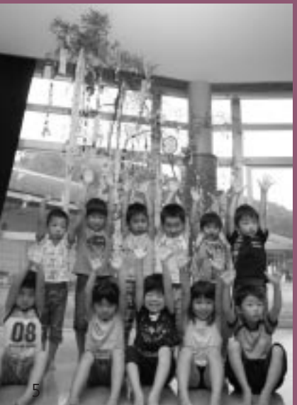
桜ヶ台保育所・さつき保育所合同七夕会

その後、児童それぞれの願いが込められた短冊の飾られた部屋で、七夕の歌を歌ったり紙芝居を見たりして、天の川のおり姫とひこ星に思いを馳せていました。