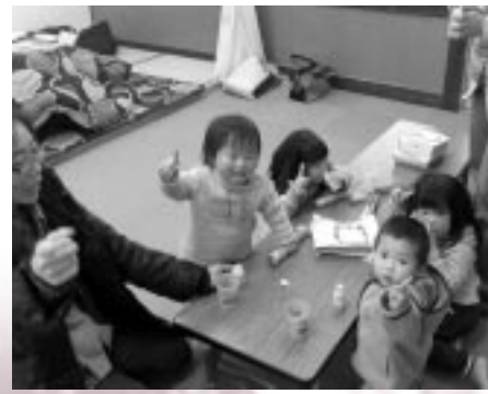
子育てサロンこがもちゃん