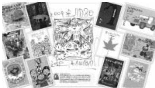
小学生向けの推薦図書

土日には地元ポランティアグループの方々による催しをさせていただきます。【木の枝で虫や動物を作ってみよう!】