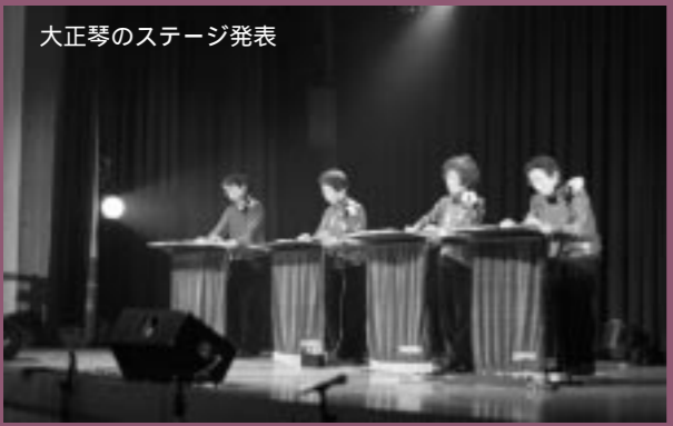
大正琴のステージ発表

来島基幹集落センターを会場に第31回目となる来島文化祭が開催されました。 地域の有志の方々などによるおいしんぼ広場や各種サークルによる作品展、飯南高校JRC部や茶道同好会の皆さんによるコーナーも設置され、訪れた人々を楽しませていました。 また、各種団体による発表が行われたステージでは、赤来中学校一年生による「花田植」が披露されました。 この花田植は、時代とともに失われつつある伝承行事を後世へ伝えていくことと、赤来地区公民館協議会が企画し赤来中学校一年生が総合学習で取り組んでいるものです。 復活を果たした花田植を一目見ようとステージ前には多くの人が詰め掛け、伝統の舞に見入っていました。