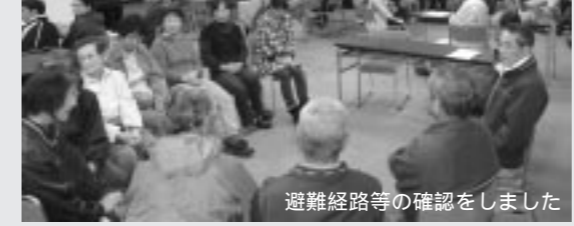
避難経路等の確認をしました