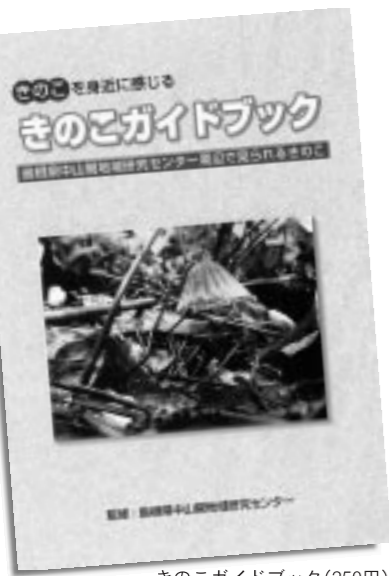
きのこガイドブック(250円)

されました。きのこシーズンは2〜4週間遅れ、本来10月に発生するはずのきのこが出遅れた感じでした。その分、11月以降の発生が期待されます。まず、コウタケ、ホンシメジが遅れて発生してくる可能性が十分にあり、また気温の低下に伴い、例年通りナメコ、エノキタケ、クリタケ、ムキタケなどが期待できます。