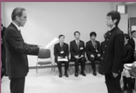
報道部(島根県児童生徒学芸顕彰表彰式)

県大会・全国大会へ羽ばたけ！ 飯南高校 部活動が大活躍 運動部・文化部の各種大会が行われ、飯南高校の各部が優秀な成績を収めました。 12月17日・18日の両日に行われた、島根県高等学校剣道新人戦では、剣道部が男子団体の部でシード校を破るなど快進撃を続け、ベスト8に進出しました。 12月19日に行われた、島根県高等学校総合文化祭・放送部門では、報道部が2部門で最優秀賞を獲得し、来年8月の、全国高等学校総合文化祭に島根県代表として出品されることが決定しました。また、昨年度に続いて「島根県児童生徒学芸顕彰」を受