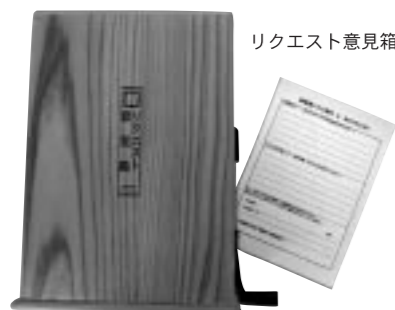
リクエスト意見箱

図書室には皆様のご意見を寄せていただくリクエスト意見箱があります。本の要望や、図書室全般に関するご意見など、お気軽にお寄せください。