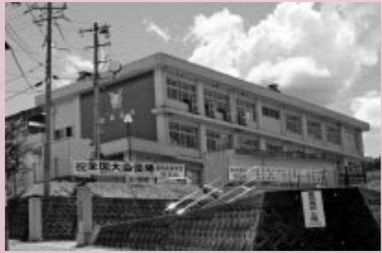
飯南高校の支援に取り組みます。

結びに、皆様のご健勝とご多幸を心からお祈り申し上げます。ごあいさつといたします。