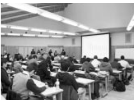
学生視点の研究に多くの人が集まりました

農業生産班やマーケティング班などの6つの班に分かれて行った研究では、現状の問題点を洗い出す中で、町外の学生の視点から見た改善案などの提案が行われました。調査に協力した町内の方も駆けつけ、学生の独自の視点からの提案に熱心に耳を傾けていました。