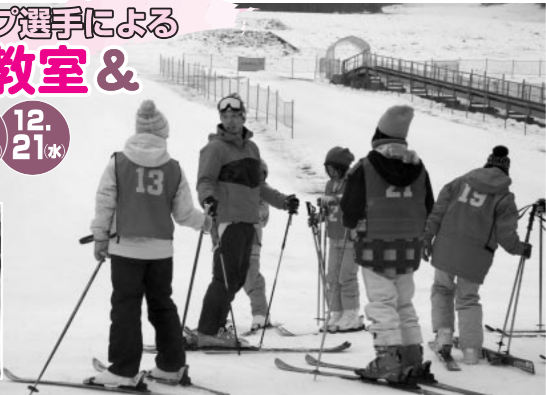
基礎トレーニング