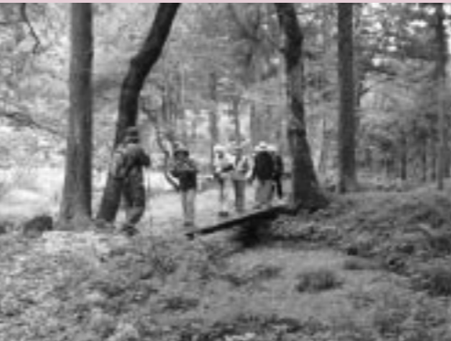
森林セラピーなど飯南町の魅力を発信します。