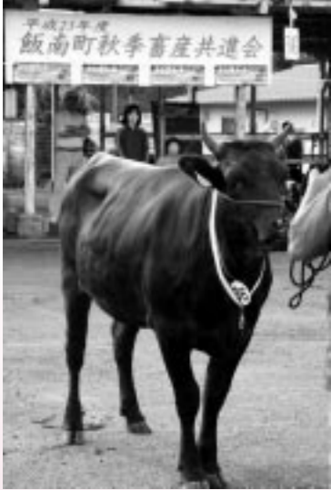
全国和牛能力共進会が開催されます。