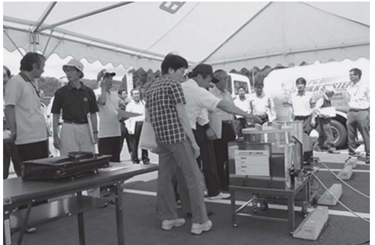
炊き出しステーション等の使用説明を受ける住民のみなさん

この日は田所地区の住民のみなさんや消防団員など80人が参加し、バルクシステムの概要説明を受けたあと、実際にタンクと炊き出しステーションを接続し、カレーライスを作りました。