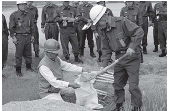
講師の指導により製作手順を確認する団員