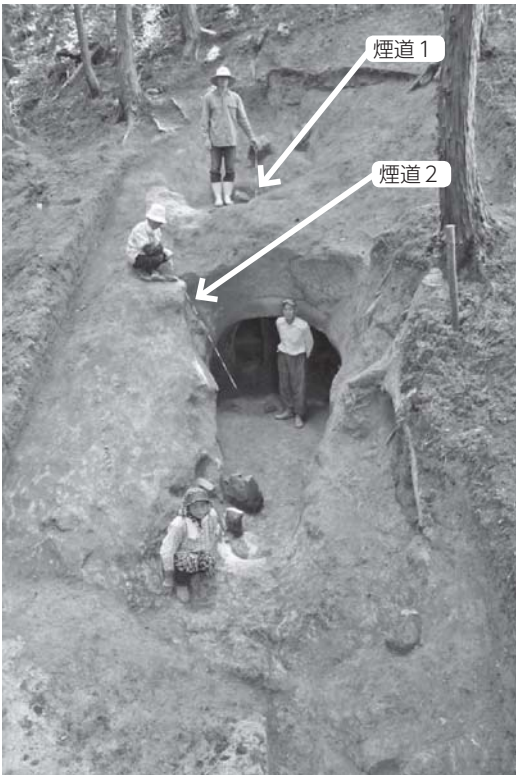
鱒越炭窯跡 全景（東側から撮影）

また、真砂土から砂鉄を採取する「鉄穴流し」を含め、たたら製鉄は、『鉾山遺跡』に含まれるそうです。とすれば、邑南町全体が鉾山の町、