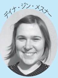
ダイナ・ジョン・メスター