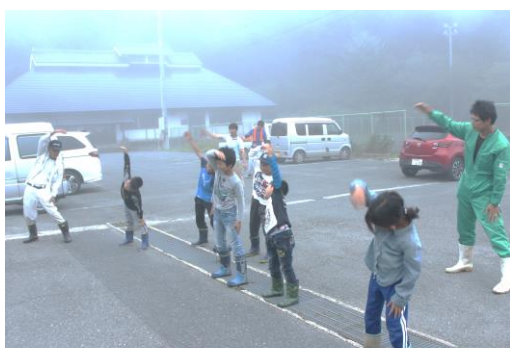
朝もやの中、「ラジオ体操第1～」

トムシやクワガタがいたときには、うれしそうに持ってきた虫かごへ入れていました。街灯を何箇所か回ると見つけることができますが、近ごろは少なくなっているようです。採集が終わった後には、普段より1時間早い（朝5時30分！）ラジオ体操をして終了。どんなに大事に飼ってもカブトムシは9月には死んでしまいます。クワガタムシは環境を整えて世話をすると数年生きるかもしれません。どうか、しっかりお世話をしてくださいね。