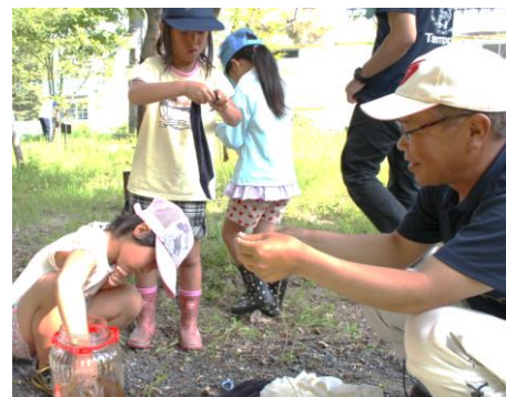
「しっかり液も含ませて。」

翌朝5時に、子供たちは目を輝かせて（大人は目をこすりながら）、はやる気持ちを抑え、ドキドキしながらエサを付けたところへ移動。数は少なかったですが、カブ