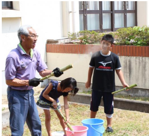
霧状に噴出しています。

水鉄砲は一直線に勢いよく水が出る物や、霧状に吹き出る物などちよつとした加工の仕方です。ずいぶんかわることがわかりました。