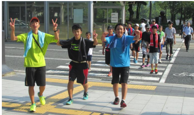
68kmを歩き切った「ピース」

4日正午、中学1年生から69歳まで79名（高原地区から8名）が出羽公民館を出発して、広島市の原爆ドームを目指しました。先頭は5日8時20分頃、原爆ドームへ到着。その後、原爆の子の像へ町内各施設から預かった千羽鶴を捧げました。