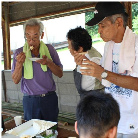
「お味は？」「うん、うまい！」

水鉄砲は一直線に勢いよく水が出る物や、霧状に吹き出る物などちよつとした加工の仕方です。ずいぶんかわることがわかりました。