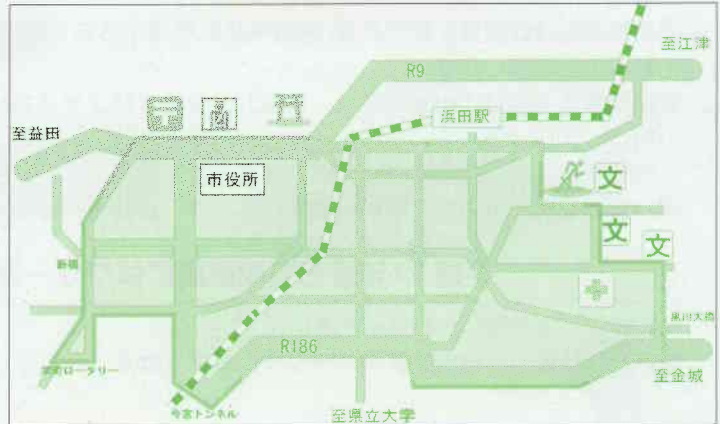
「あんしん歩行エリア」

この地域において、平成15年度より5年間で ○死傷事故件数を約2割抑止 ○歩行者・自転車の死傷事故件数を約3割抑止 を目標に関係各機関と連携して、様々な交通安全対策を行っていきます。