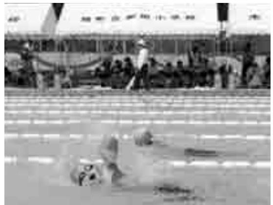
力いっぱい泳ぐ児童たち