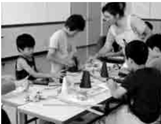
仕上げに花瓶の底を貼り付ける児童たち