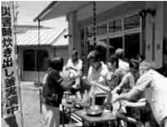
災害時を想定し炊き出し訓練を行う参加者