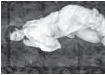
石本正「ノスタルジア」(2006年)