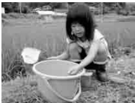
田んぼの宝物発見！