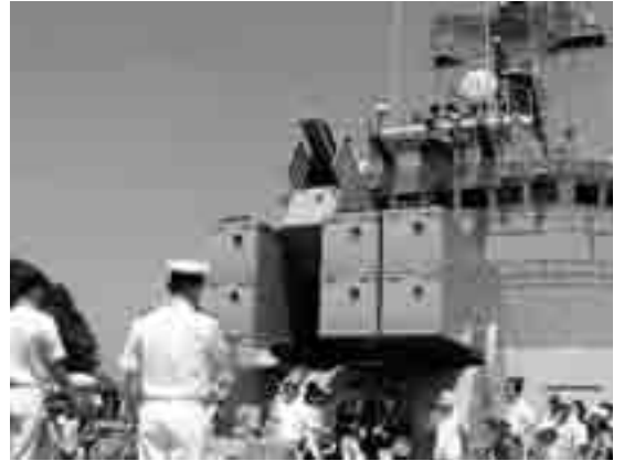
護衛艦「まつゆき」の説明を受ける来場者

来場した人たちは、ふだん乗船できない護衛艦で、乗務員の話の聞いたり、記念写真を撮ったりして楽しんでいました。