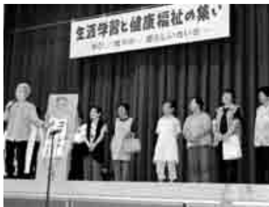
健康管理を呼びかけるいっばつ会の皆さん

また、地元有志「いっばつ会」の皆さんによる「我が家のドクター・・・私」と題した寸劇では、真剣な演技とともに家庭内での声掛けによる健康管理の大切さを呼びかけていました。熱演した「いっばつ会」の皆さんには、会場から大きな拍手が送られました。