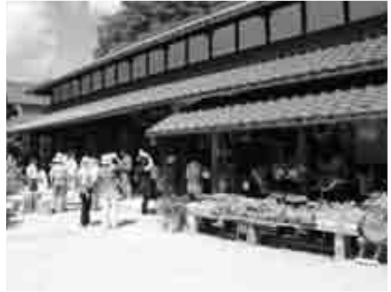
古民家を見学する参加者