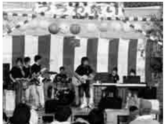
「さくらバンド」による演奏はとても盛り上がりました

また、ステージではバンド演奏や子ども神楽の上演、地元の人によるフラダンスやニワトリの鳴きまねコンテストなどが行われ、会場は熱気にあふれていました。