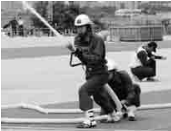
旭消防隊市木分団の放水の様子