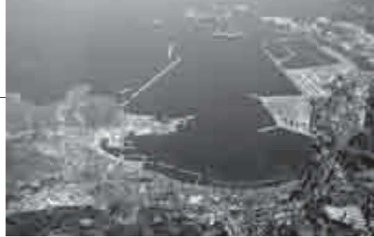
重点港湾に決定した浜田港