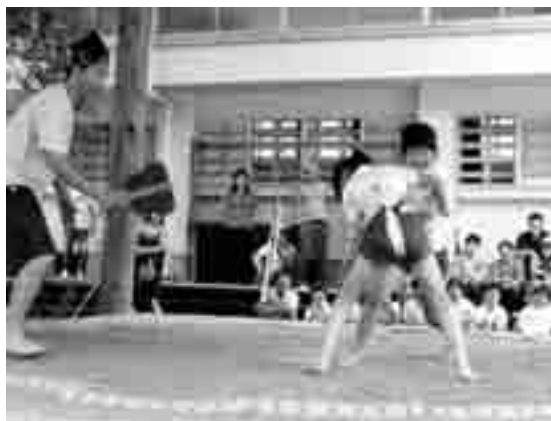
はっけいよいのこった。どっちも負けるな。