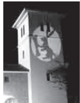
お月見コンサート