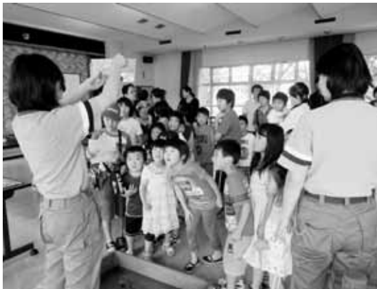
海の生物に興味津々の様子