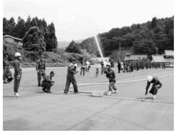
練習の成果を披露しました

7月15日(日)、弥栄町イベント広場で、8月5日(日)に奥出雲町で開催される島根県消防操法大会に出場する杵束分団2班を送り出す壮行式が開催されました。当日は、炎天下の下で式典を行った後、選手によるポンプ操法の披露が行われました。5月から週2～3回の練習を続けてきた選手たちは、暑さにも負けずキビキビとした動きでポンプの操作を行い、観覧していた地元の皆さんから大きな拍手と声援が送られました。その後、選手から決意表明が行われ、今までの練習に協力してもらった地域への感謝の気持ちと本番への意気込みが伝えられました。