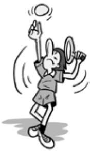
短期スポーツ教室一覧表

http://hamada.sitimane-sports.or.jp/index.html