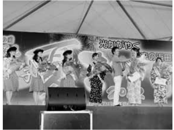
新観光大使としての抱負を述べました

会場は、浜田の夏の風物詩である大輪の花火を一目見ようと、多くの人でにぎわいました。