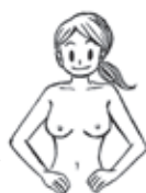
両腕を腰にあてた状態で