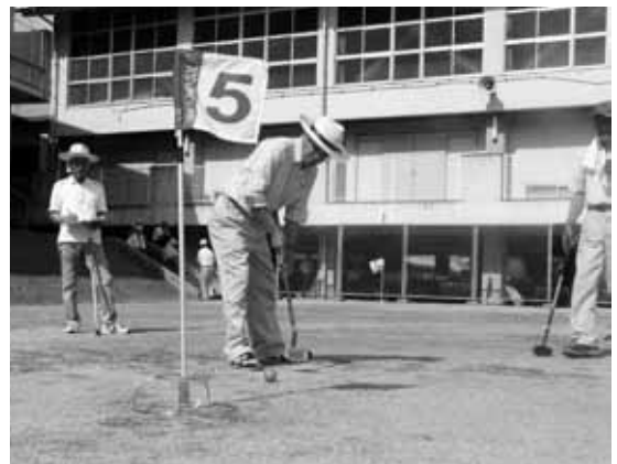
暑さに負けず、グラウンドゴルフを楽しみました

参加者は「とても暑かったけど、みんなの顔を見れてうれしかった」と汗をぬぐいながら話していました。