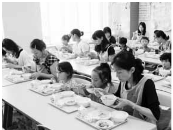
給食はおいしいね！

来年度、小学校に入学する幼児と保護者を対象に、食習慣の基礎づくりや、給食の楽しさ、おいしさを学んでもらおうと、(財)浜田市学校給食会が初めて企画したもので、当日は、18組42人の親子が参加。「食習慣の基礎づくり」や「食べ物を知ろう」をテーマに講演を聞いた後、実際に学校に出ている給食を食べました。参加者は、給食のおいしさや楽しさを味わい「おいしいね」と話しながら食べていました。