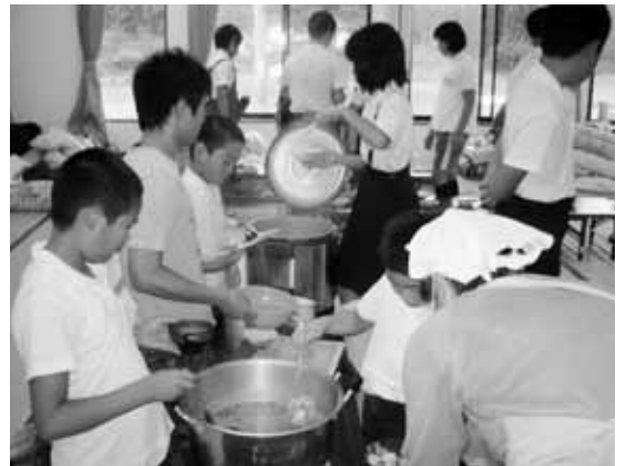
食事の準備も全部お手伝いしました

この合宿の目的の一つである礼儀やマナーの習得について、地域の皆さんや主催者である杵束公民館のスタッフが、支援することによって身に付いたと思います。