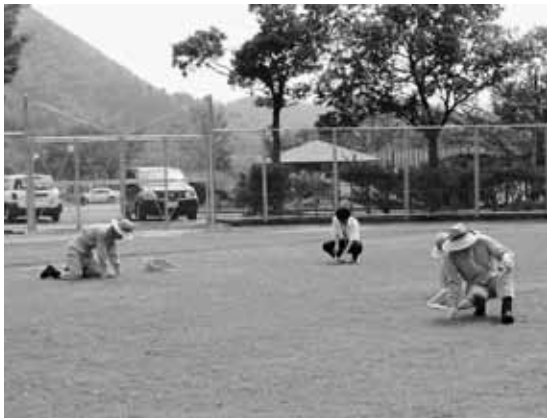
炎天下の中、除草作業を行う訓練生