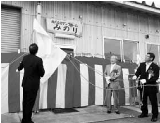
開所を祝い看板を除幕する関係者