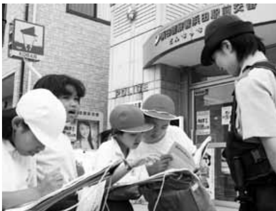
交番の婦人警官に道や施設を訪ねる児童