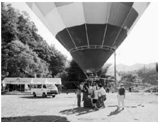
熱気球に乗って学校周辺を見渡しました