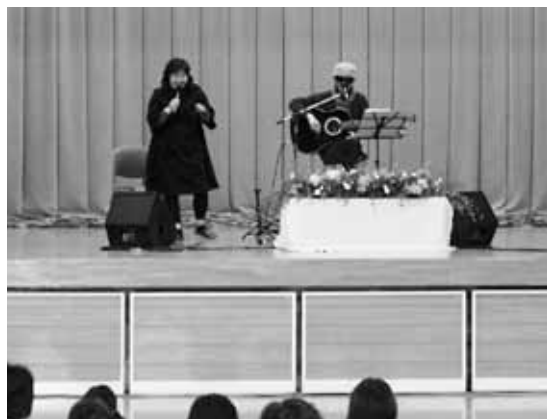
会場を魅了する「安来のおじ・おがっち」の歌声

会場は、終始和やかな雰囲気にもまれ、参加者はコミュニケーションについて考えさせられるひと時となりました。