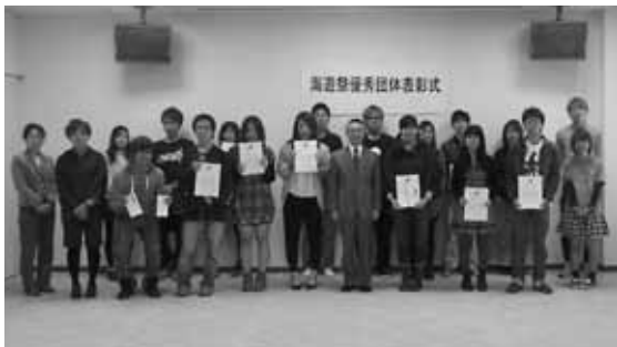
表彰を受けた優秀団体の皆さん