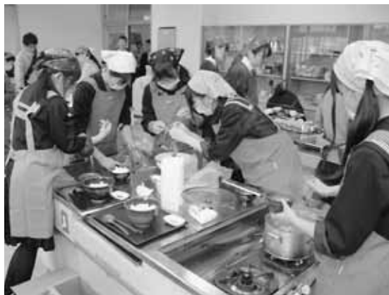
「シシ肉入りうずめ飯」を調理する浜田高校の生徒