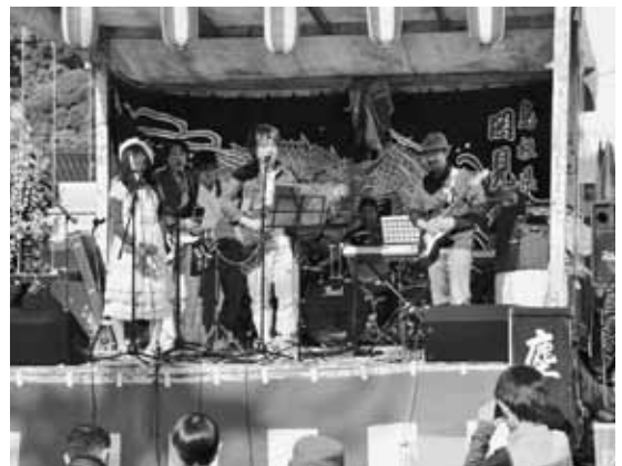
「さくらバンド」によるライブ演奏

当日は、晴天に恵まれ、特設ステージでは、岡見神遊座による石見神楽の上演や島根県立大学生の「よさこい橙蘭」・演舞・地元のアマチュアバンド「さくらバンド」の演奏があり、会場を盛り上げました。また、景品付きの餅まきやガラポン抽選会・ビンゴゲームが行われ、約500人の来場者でにぎわいました。