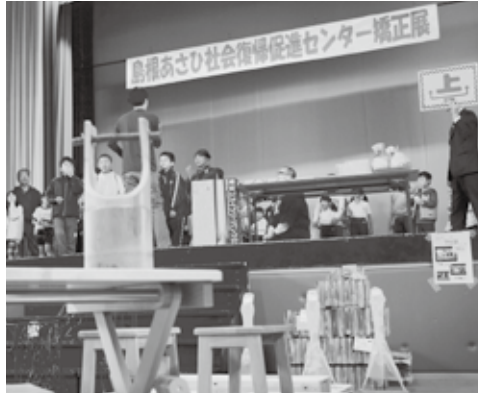
矯正展では、クイズ大会が行われ、豪華商品を目指し盛り上がりました