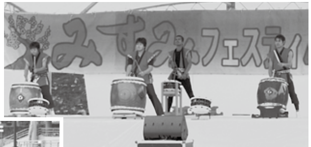
オープニングは、みすみ太鼓で景気付け!