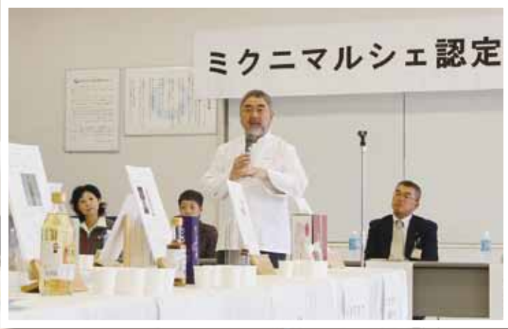
(写真③) はまだ食の大使・三國清三シェフが推奨する19品の特産品を「ミクニマルシェ」に認定