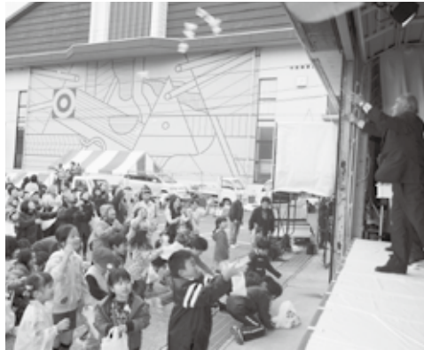
祭りのフィナーレを飾る餅まき