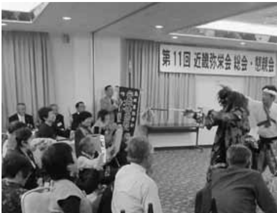
間近で見る神楽に大興奮でした