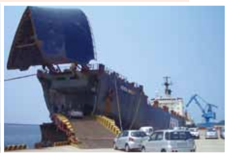
(写真⑨) 定期航路化が決定した貨物運搬船（ローロー船）