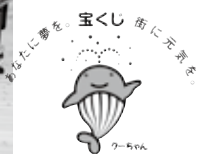
(三隅支所自治振興課)