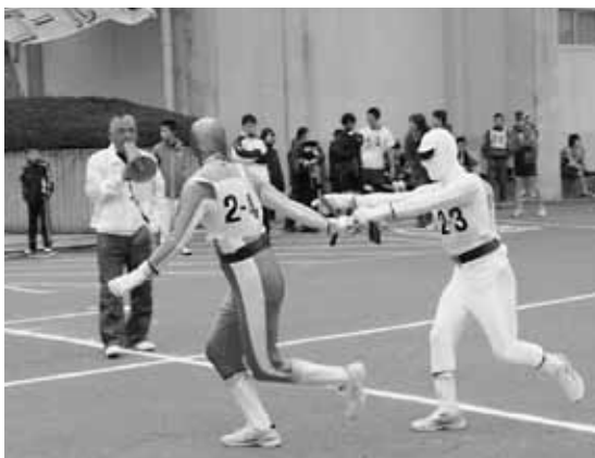
戦隊ヒーローも大活躍。大会を盛り上げました!