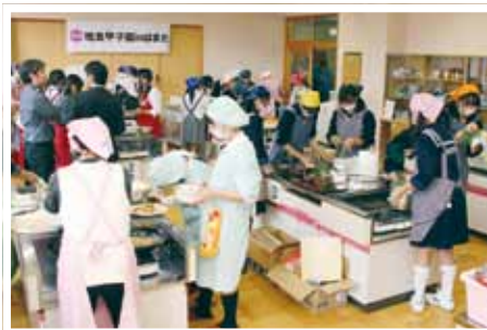
(写真⑧) 地食甲子園in浜田に県外2校・県内6校が参加