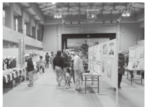
屋内では、公民館活動の展示などがありました