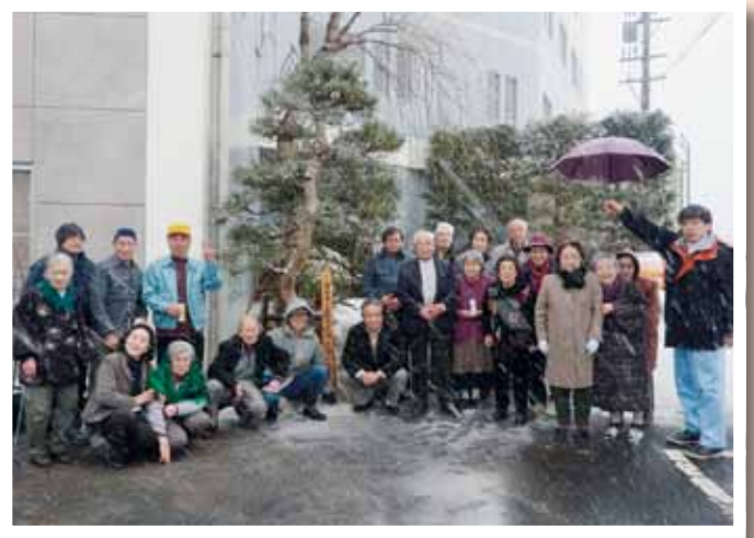
(写真④) 気仙沼市へ復興祈念樹(クロマツ)を贈呈