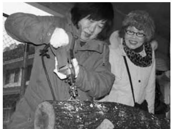
手際良く穴を開けていく参加者

参加者は「初めての体験でしたが、上手にできました」と話し、金城の秋を満喫していました。