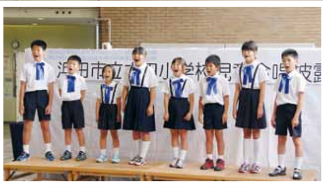
(写真⑥) 市役所ロビーで美しい合唱を披露する木田小学校児童