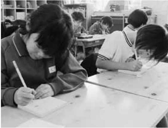
感謝の気持ちを込めて書き込みました