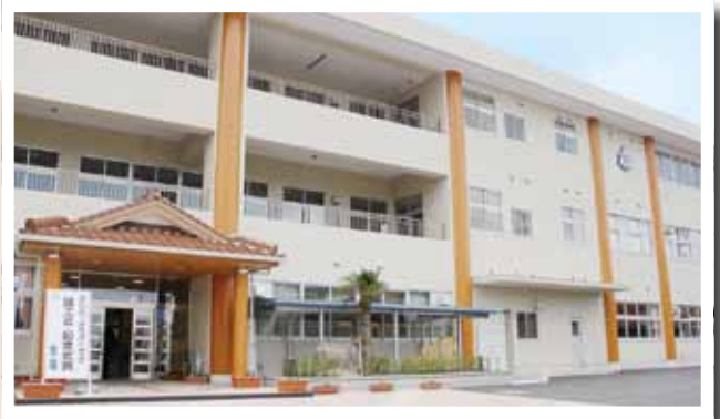
(写真②) 竣工式及び記念式典が行われた長浜小学校