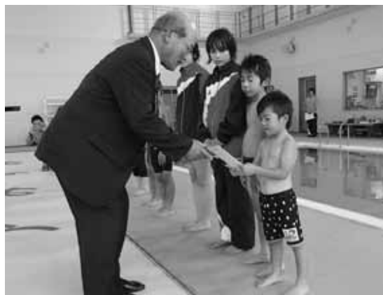
賞を授与される参加者

また、記録会の特別賞である「応援・泳ぎ・笑顔が輝く、きらめき賞」が、参加者10人に贈られました。