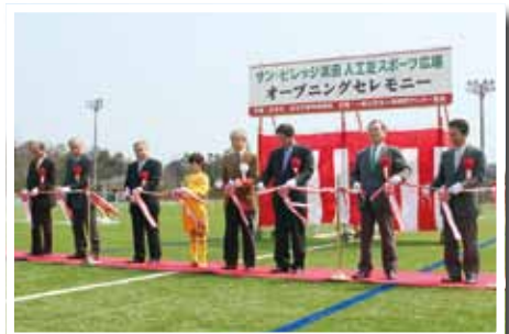
(写真⑦) サン・ビレッジ浜田人工芝スポーツ広場がオープン