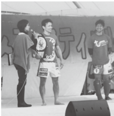
三隅出身のキックボクシング世界チャンピオン寺戸伸近選手(写真中央)が会場に来てくれました