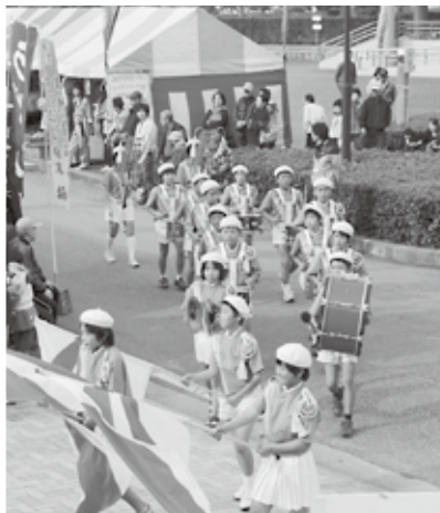
三隅小学校児童による鼓笛隊パレード