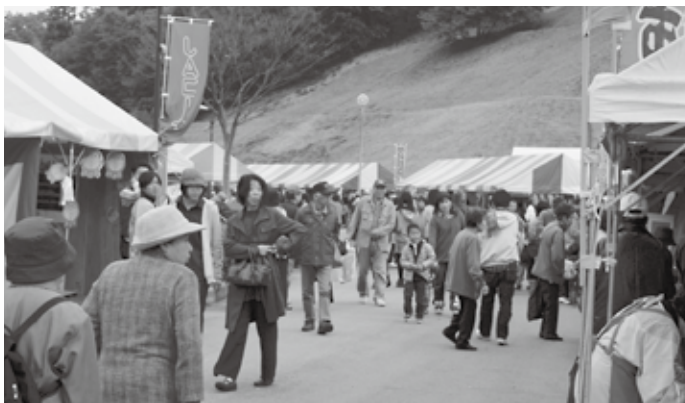
会場は多くの人でにぎわいました

みすみフェスティバルでは、ダンスや石見神楽の上演・公民館活動の展示など様々な催しが行われ、2日間で約9,000人が来場し、祭りを楽しみました。