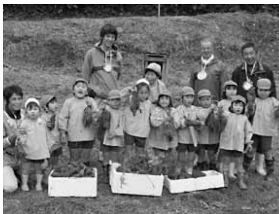
お礼に感謝のメダルを贈りました