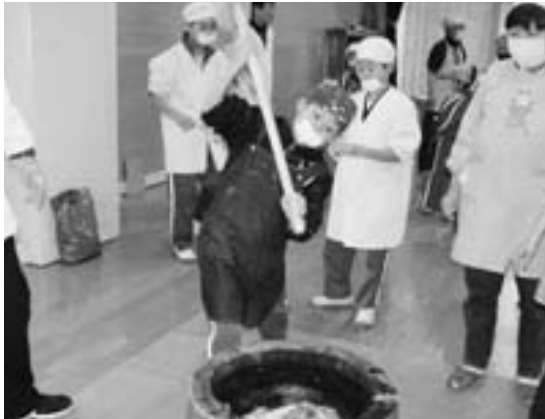
カいっぱい餅をつく児童