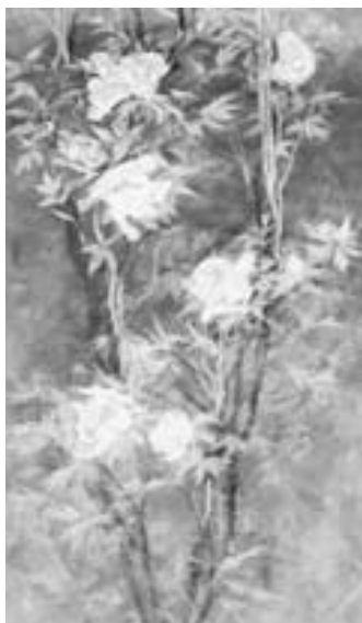
石本正「天王牡丹」(2007年)

日本画家・石本正(92歳・三隅町出身)にとって花は、ただ美しく咲き、目を楽ませてくれるだけの存在ではありません。目の前の花が、女性の姿や燃え盛る火炎のように見えたり、音楽を奏でているように感じたり、様々なイメージと重なって