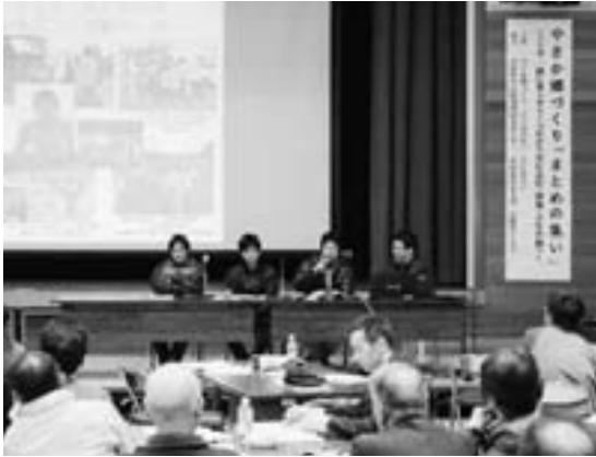
築いてきた関係の良さがうかがえました