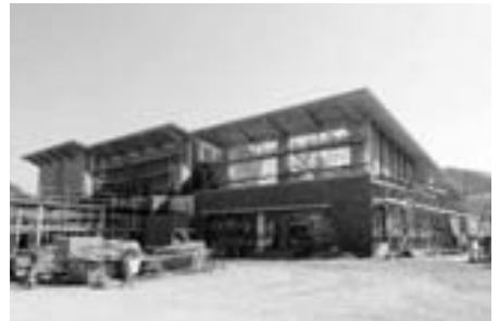
「中央図書館」建築状況 (2月下旬撮影)

中央図書館については、ボランティア組織の立ち上げや学校図書館との関係構築など、市民との対話や関係機関との連携を図りながら、本年8月の開館に向け準備を進めます。