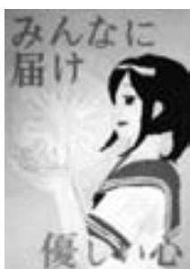
浜田市人権作品コンクール 最優秀賞作品

人権尊重の精神を全ての教育の基底に据えた取組を推進し、人権感覚を育み、一人ひとりを大切にするとともに、それぞれの人格や個性の違いを認め、お互いを尊重するまちづくりを目指します。そのため、同和教育をはじめとした様々な人権課題の解決に向けて、学校・家庭・地域・関係機関や団体などと連携し、人権・同和教育の推進・充実を図ります。