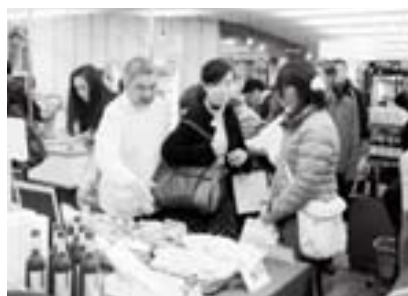
にほんばし島根館で開催された「ミクニマルシエフェア」