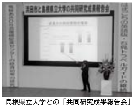
島根県立大学との「共同研究成果報告会」

題です。次世代を担う若者が住みやすいまちとなるよう、様々な定住施策の充実に向けて全庁を挙げて横断的に取り組めます。 ◆ 大学を核としたまちづくり 平成25年度から、島根県立大学に新たに職員1人を派遣し、大学職員と一体となって、地域課題解決に向けた調査研究に取り組みます。