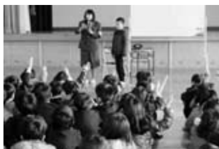
浜田子ども安全センターによる「防犯教室」

どの地域ボランティアと連携して安全指導、見守り活動を継続します。また、「浜田子ども安全センター」による防犯教室や不審者対応訓練の指導はもとより、防災教育や避難訓練も充実します。