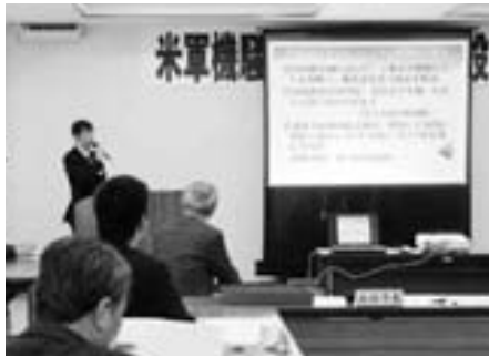
「米軍機騒音等対策協議会」設立総会

関係市町の首長による対策協議会を中心に、島根県と一緒に、引き続き訓練中止を訴えます。