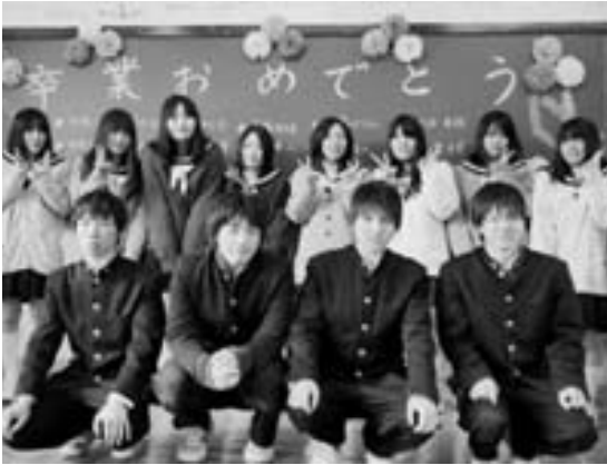
閉校式を終え最後の記念撮影を行う卒業生