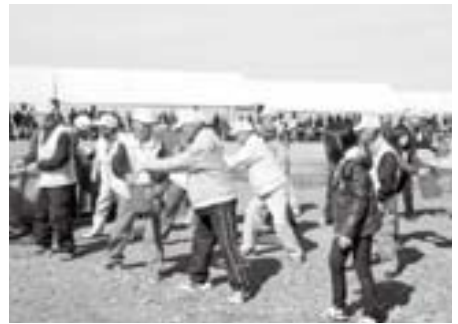
住民などによる「防災訓練」