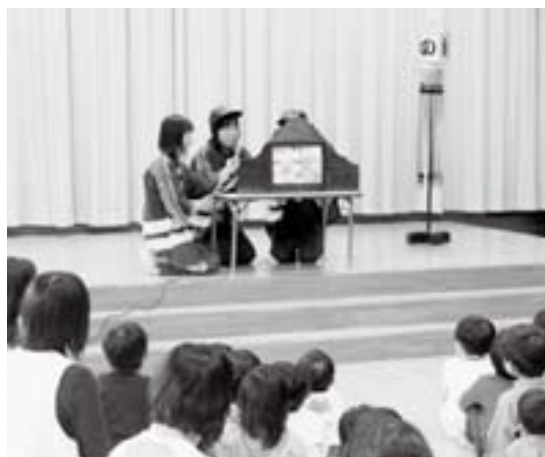
火災予防についての紙芝居