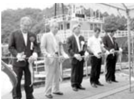
沖合底曳網漁船「リシップ事業」竣工式

にした木材生産を推進するとともに、特産果樹や有機野菜の振興、新開団地への新たな企業参入などを進め、農業算出額は、平成20年から平成23年で、約2億2千万円の増加となりました。