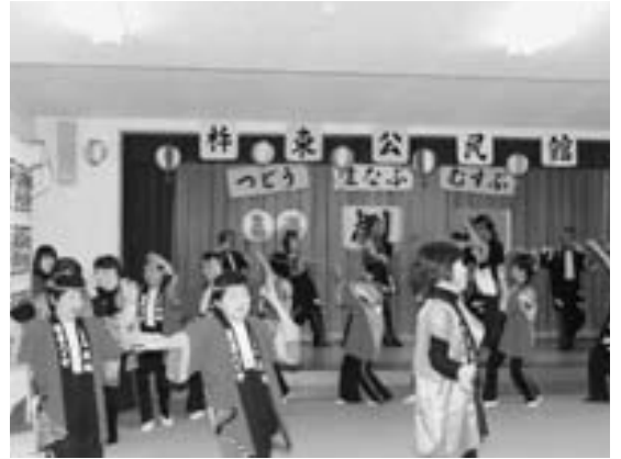
サークルの枠を超えた交流もありました

この催しは、「つどう・まなぶ・むすぶ」をテーマに公民館運営推進員と公民館サークル・各種団体が、それぞれ協力して行いました。当日は、公民館サークルによる踊りや芝居・伝統芸能など16演目が行われ、出演者の皆さんは練習の成果を十分に発揮していました。飛び入り参加の一発芸などもあり、満席の会場は、大いに沸き立ちました。また、地元の集落などからの出店もあり、手作り感あふれるイベントとなりました。