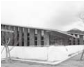
中央図書館 (2月24日撮影)