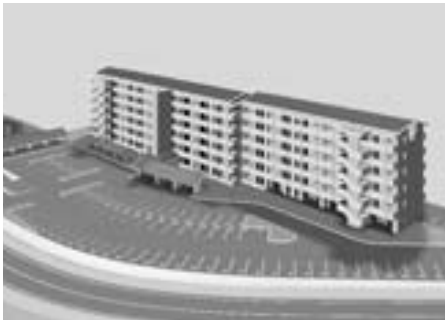
「長浜西住宅」完成予想図

また、定住対策推進へ向けた専門部署を置き、横断的な定住対策事業を進めるとともに、地域コミュニティの再生・強化に向け「地区まちづくり推進委員会」の設立と「まちづくり総合交付金」による活動の支援を行いました。本年は、合併8年目の節目の年を迎えることから、自治区制度の再検証を行います。