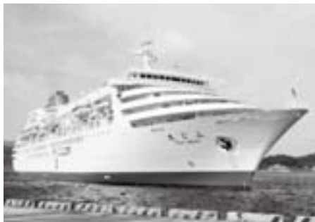
ふじ丸 (全長167m・総トン数23,235t)

※ 福井ふ頭岸壁からの見学には、事前の申込みが必要です(今回は、船内見学はありません)。