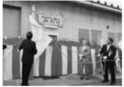
旭町に設立された農作業支援会社 「(株)サンファームみのり」