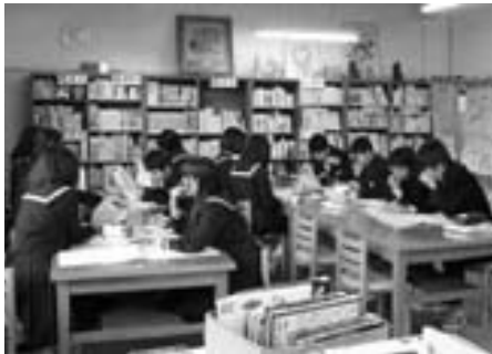
「学校図書館」での調べ学習

引き続き、小中一貫教育や新しい学びプロジェクトを推進するとともに、平成25年度は、本市で中国地区学校図書館研究大会や島根県教育研究大会が開催されますので、その研究成果を授業に活かします。また、特に家庭と連携した「家勉」の充実を図ります。