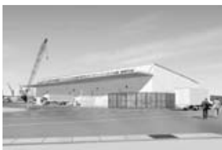
福井地区「上屋倉庫」完成予想図

の浜田の特産品を広島、関東、関西圏へ積極的に売り込み、更なる外貨の獲得を図ります。また、中小企業の新商品開発や販路拡大などの支援を行い、小規模事業者への金融支援により経営基盤の強化を図るとともに、商工会議所や商工会と連携し、商店街の振興に努めます。