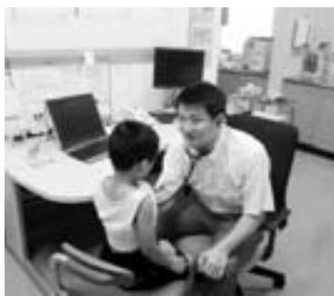
「国民健康保険診療所」での診察

平成25年度から医師1人を採用し、5人体制となります。引き続き、地域の医療機関の協力をいただきながら、へき地医療体制の充実と医療従事者の人材育成に努めます。