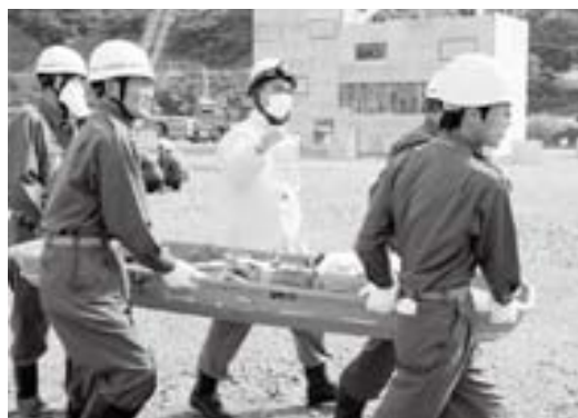
島根県防災訓練での搬送活動