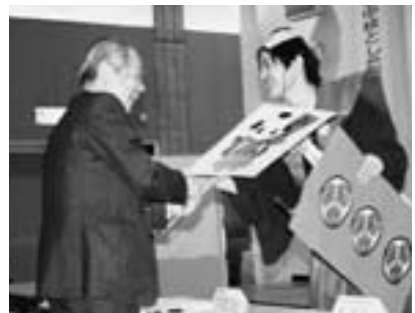
報告者に質問をする宇津市長