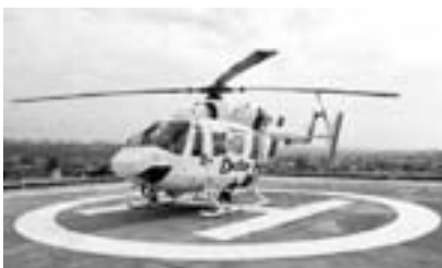
「ドクターヘリ」 浜田医療センターにヘリポートを整備

「保健医療福祉総合計画」が平成25年度から新たな5年間の計画期間に入ります。「健康でいきいきと暮らせるまち」を目指し、保健・医療・福祉における各分野の一層の連携を推進します。