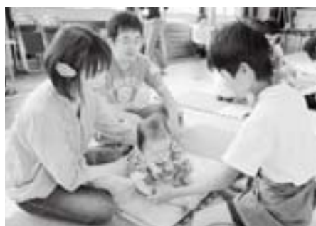
美川小学校での様子（平成24年度）