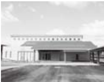
三隅図書館 (2月24日撮影)