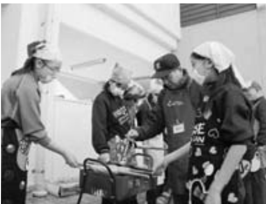
ちくわの香ばしい匂いが漂ってきます