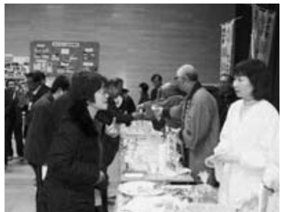
各まちづくり委員会の「ごちそう」が並びました