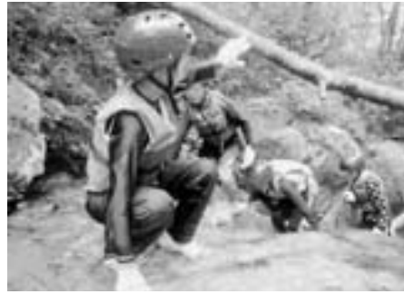
宿泊体験活動「沢登り体験」

教育委員会では、学校、家庭、地域が一体となって、浜田市教育振興計画はまた子供プランに掲げた基本理念である「人とつながる喜びや、学ぶことの楽しさを通じ、社会の中で自立して生きることのできる子どもの育成」の下、諸施策の実現に向けて積極的に取り組みます。