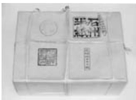
ユネスコ無形文化遺産「石州半紙」

貴重な文化遺産の保護・継承と情報発信に努めるとともに、御使殿や歴史民俗資料館などの有効活用や関係団体と連携して郷土意識の醸成に取り組みます。