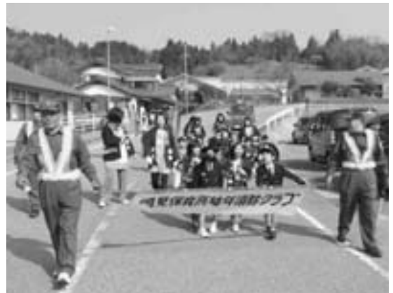
岡見保育所幼年消防クラブの防火パレード

園児たちは、ハッピー姿に拍子木を持ち、それぞれの地区をパレード。沿道の住民に「火には気を付けてください」と呼び掛けました。また、火災予防の紙芝居を見たり、消防署員の話を見たりして、最後は大きな声で「防火の誓い」を述べました。