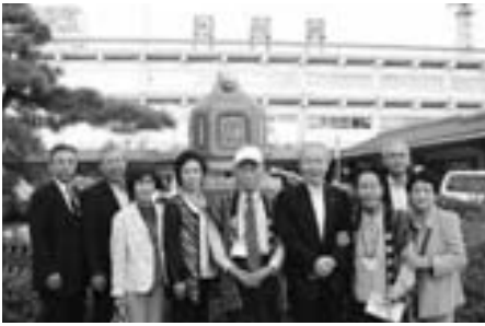
「松阪市」との交流 JR松阪駅前「駅鈴」モニュメント

合宿等誘致事業や食の取組により「おもてなし」の質を高めるとともに、石見神楽公演や地域の特性を活かしたツーリズムを推進します。また、知名度アップ戦略として観光物産展の広島市開催などの情報発信に努め、観光消費額の向上や滞在泊数の増加、リピーターの確保を図ります。