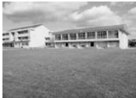
長浜小学校「校庭芝生化」

校庭の芝生化については、周布小学校、長浜小学校に続き、学校やPTA、地域の理解を得て、地域ぐるみで推進できる体制を整備し、子どもたちが健やかに体力を育む環境づくりに取り組みます。