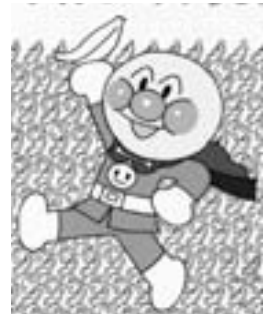
アンパンマンとバナナダンス

まり、自身の体が動く限り、作品を作り続けようと決意したそうです。今回展示するタブロー作品「アンパンマンとバナナ姫」(映画『よみがえれバナナ島』)のテーマは、「復興」です。子どもたちだけでなく、大人たちにも、生きる勇気と愛を与え続けてくれます。