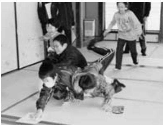
大判のカルタをダイビングで「取った！」