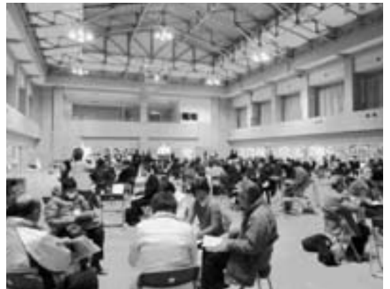
午後からのグループワークの様子

「南小太鼓」の迫力あるオープニングで始まり、第1部は「公民館を知ろう！」と題し、三隅自治区の公民館による事例発表と、講師を招いたパネルディスカッションが行われました。第2部では、グループに分かれ、公民館の役割について意見交換をし、有意義な1日となりました。