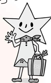
レジ袋削減キャラクター