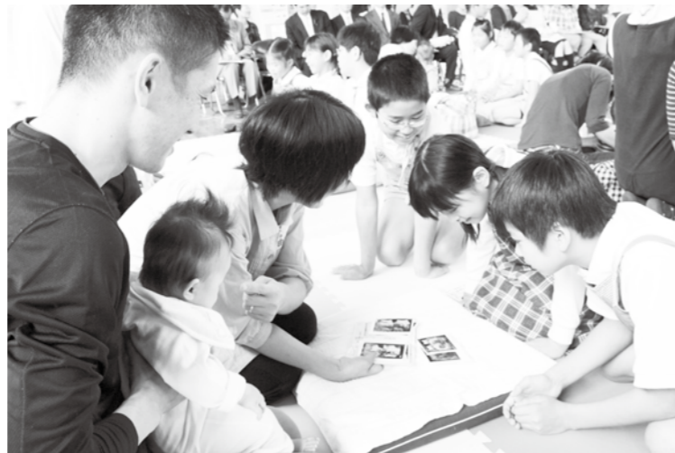
赤ちゃんがお腹にいたときのことも聞きました

同小学校での赤ちゃん登校日は、11月28日に3回目の赤ちゃんとの関わりが予定されています。(22ページに関連記事)