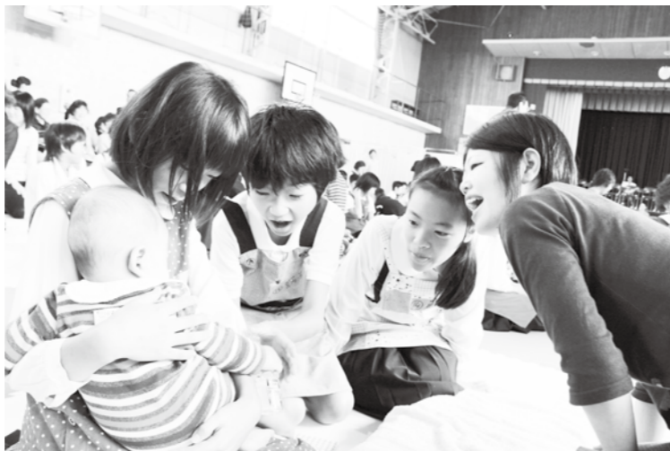
抱っこ上手です。赤ちゃんもリラックス。