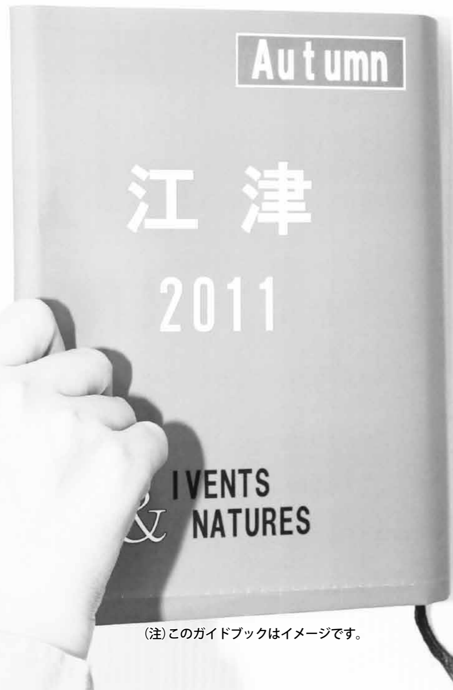
(注)このガイドブックはイメージです。

四季の中でも、もっとも過ごしやすい季節、秋です。江津の秋は神楽にイベントに、自然美にと魅力がたつぷり。かわらばん11月号では、江津の秋の魅力をガイドブックにまとめました。これを読めば、江津の魅力に出会うこと間違いなし?どうぞご覧ください。