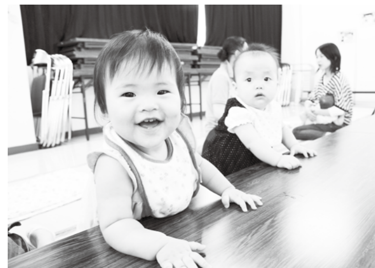
登校日終了から2カ月たち、すっかり大きくなりました