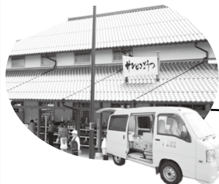
地元野菜はサンピコ発 給食センター行き