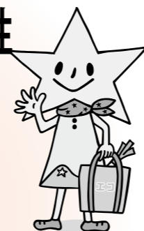
レジ袋削減キャラクター