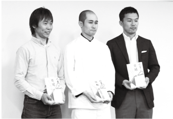
◎新規創業・経営革新部門大賞（賞金 50 万円）

高齢化や人口減少に悩む本市の課題を「なんとかしたい」と思う熱い人に活動を支援し、地域に刺激を与えようと、コンテストは昨年初めて開催され、今回で2回目。全国から23件の応募があり、一次審査（書類審査）を通過した7人がプランを発表し、左の3人が受賞しました。今後の活躍に期待です。