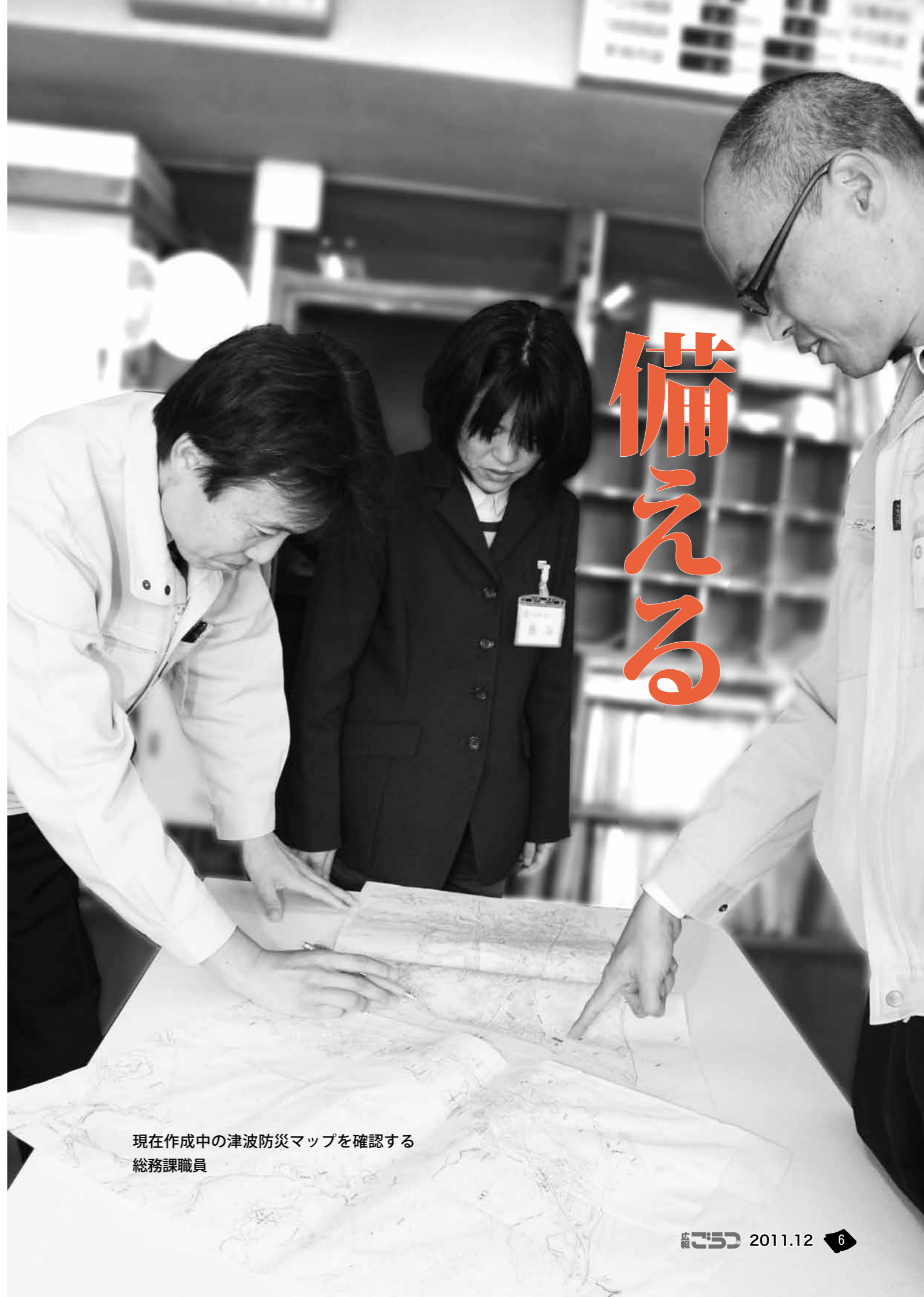
現在作成中の津波防災マップを確認する 総務課職員