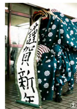
①新年の縁起物を選ぶ初詣客 ◆②元日のJR津和野駅で新年を祝う獅子舞の披露 ◆③すっかり雪道となった参道にある初詣客。奥に見える町内の景色も積雪で真っ白になっていました。