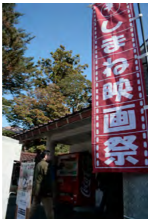
昨年開催したしまね映画塾 in つわの。津和野の魅力を再発見できたイベントとなった。

本年は、まず最初に何と云ってもわが町の財政再建を更に進めていく必要があります。実質公債費比率をはじめ、わが町の財政の状況を表す指標はこの1年においても改善をしてきております。