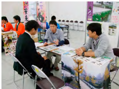
各地で開催される定住フェアにも積極的に参加。島根県や関係団体と連携しながら定住対策にも取り組んでいく。

しかし、人口減少や合併特例の期限到来による国からの交付税の動向が不透明であり、歳入の減少を厳しく予測しながら、良好な財政状況となるように更なる改善に向け取り組んでまいりたいと思えます。次に、町民の皆様と行政とが役割分担のもと協力し合いながらまちづくりを行う「住民参画による官民協働のまちづくり」の仕組みづくりについても本年も更に推し進め、早急に構築をしてまいります。昨年は地域課題の概要調査を各自治会を単位として行うなどしたところではありますが、本年よりはそうした調査研究に基づき、自治会や住民活動団体、町内企業などの方々に構成する住民と行政の協働プロジェクト推進会議を設置し、推進に向けた指針の策定や住民自治に関する基本条例の制定を行うとともに、地域提案型助成事業や協働のまちづくりを推進するための組織づくり事業など、集落の支援策を各種講じてまいります。その過程においては、町民の皆様にも様々なご協力を頂く場面も生じてくるかと存じますが、その節にはどうぞご理解を頂きますようよろしくお願い申し上げます。