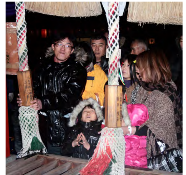
新年の願いごとをする初詣客

かどうか心配だったけど、事故も無く到着できてよかった。今年も病気や怪我もなく、家族全員が健康ですごせるようお願いしました。」と話していました。 また、元日のJR津和野駅では地元団体「須川郷の会」による獅子舞の披露がありました。3日までの特別運行をしたSL稲荷号の到着にあわせて行われた縁起の良い舞の披露に到着した初詣客からは喜びの歓声と感謝の拍手が送られました。