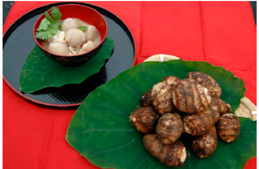
徐々に市場での価値が高まってきた津和野産の農産物。都市部で取扱数の増加を図り農業振興の取り組みを拡大していく。