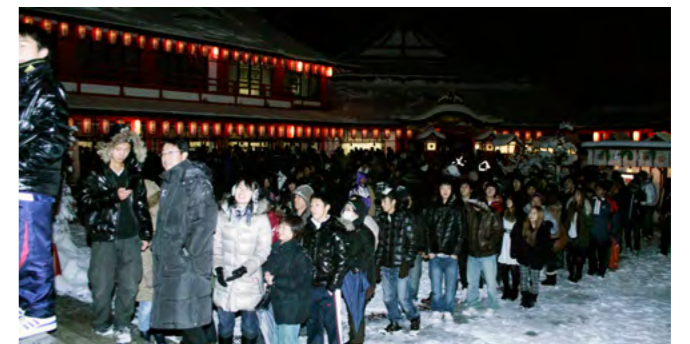
年越し直後には行列ができていました。

かどうか心配だったけど、事故も無く到着できてよかった。今年も病気や怪我もなく、家族全員が健康ですごせるようお願いしました。」と話していました。 また、元日のJR津和野駅では地元団体「須川郷の会」による獅子舞の披露がありました。3日までの特別運行をしたSL稲荷号の到着にあわせて行われた縁起の良い舞の披露に到着した初詣客からは喜びの歓声と感謝の拍手が送られました。