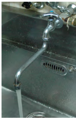
ご家庭での使用状況を確認してどのくらい料金が変わるのか確かめてみましょう。