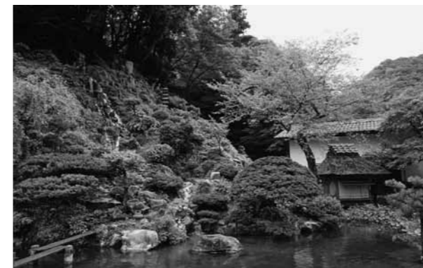
▲出雲地方の庭園として初の国指定名勝となる櫻井氏庭園

6月16日に開かれた国の文化審議会の答申により、上阿井の櫻井氏庭園が国の名勝に指定されることが決まりました。