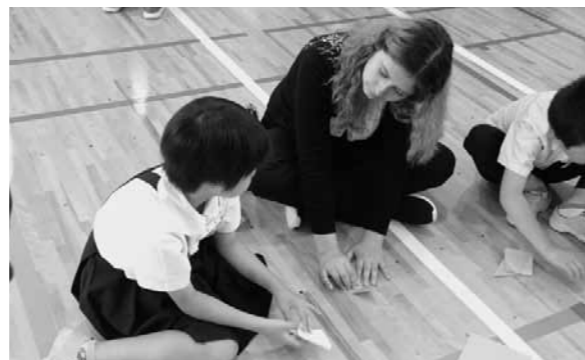
▲折り鶴を作成(八川小学校)

6月10日、アメリカ合衆国イリノイ州にあるストリームウッド高校から日本語を学ぶ生徒16名が来町しました。