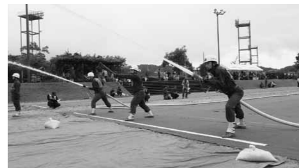
▲雨の中行われた操法披露

横田公園多目的広場で、6月25日、夏期総合訓練と操法大会が行われ、各地区の消防団員が参加しました。