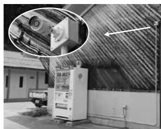
▲三成公園ホッケー場に設置された防犯カメラ