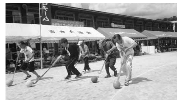
▲今年は八川小学校の校庭で開催