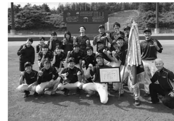
▲優勝してガッツポーズ

6月3日から17日にかけて行われた広島県専門学校軟式野球春季大会において、島根リハビリテーション学院の軟式野球サークルが見事優勝を飾りました。