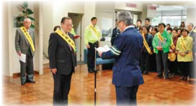
▲交通安全メッセージ伝達式

この交通安全運動期間だけでなく、常に一人ひとりが交通安全について考え、人も車も自転車も交通ルールを守り、悲惨な交通事故をなくしていきましよう。