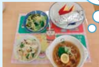
4つのお皿のランチマットを敷いて試食

「ほかほかスープがとても美味しかった」 「家庭の味付けより、少し薄味」等の感想がありました。