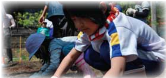
▲たくさん収穫できますように♪