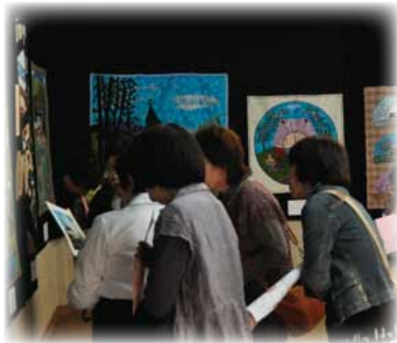
▲真剣に説明を聞いておられます