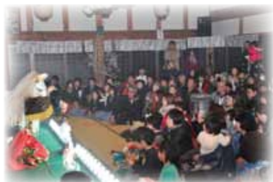
▲じっくり神楽を楽しみました

昨年までプレハブで開かれていた夜桜茶屋は、今年、ふるさとのおち伝承館に場所を移しました。そこでは昨年までとまったく変わらない、暖かい笑顔やぜんざいなどのおもてなし。桜の花や菜の花など、春を彩る植物が飾られ、茶屋の人も客もゆったりとした楽しい時間を過ごしておられました。