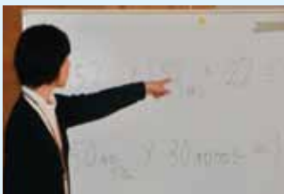
ミニ講座：バランスの良い食事