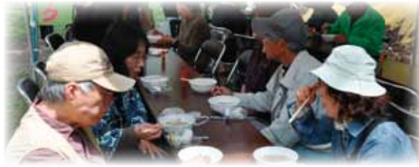
▲この山賊汁おいしいねえ！

沢谷地区九日市の花の谷シャクナゲパークで4月27日(日)花の谷しゃくなげ祭りが開催されました。春とは思えないほどの日差しのもと、満開のしゃくなげに囲まれて千原神楽団による神楽が上演されました。山くじらまんや山くじらコロッケ、具だくさんの山賊汁など、美郷町の花と同時に特産品が味わえるおいしいお祭りでした。みさ坊もかけつけ、自己紹介や記念撮影など行いました。エドヒガンザクラまでのウォーキングは植物のことや様々な歴史などおもしろい話が聞けて、まさに森の学校でした。