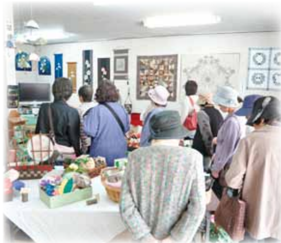
▲わいわいサロンでは多くの人がわいわい♪