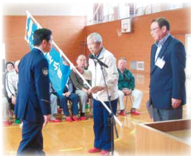
▲幟旗をしっかり受け取ります

高齢者を交通事故から守るモデル活動地区(はつらつモデル地区)として、都賀行地区が指定されました。4月15日(火)には指定式が行われ、川本警察署から指定書と幟旗の贈呈がありました。公民館や交通ボランティアをはじめ、家族・隣人・その他の地域住民など地域全体が連携して、高齢者支援のための集中的・継続的施策を実施することにより、高齢者被害事故の抑止を図ります。