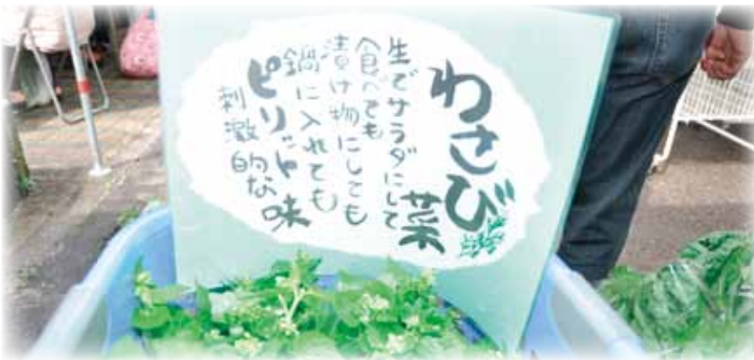
▲思わず食べたくなりますね♪