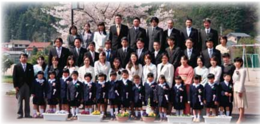
▲青空の下でみんなニコリ