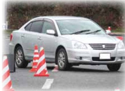
▲華麗なドライビングテクニック