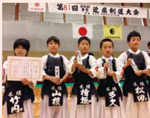
▲出場した選手たち