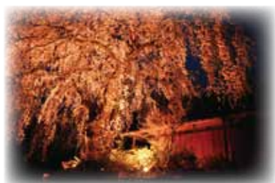
▲ライトアップされた伝承館の前川桜