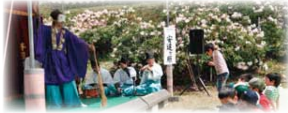
▲しゃくなげに見守られながら和尚さんが歌声を披露