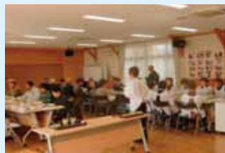
献立についての説明