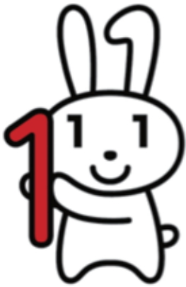
マイナちゃん(マイナンバーキャラクター)

10月以降、全ての住民の皆さまに、住民票の住所地にマイナンバー(個人番号)が通知されます。