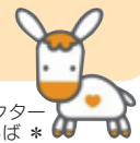
マスコットキャラクター *まごころば*

10月は 臓器移植普及推進月間 骨髄バンク推進月間 10月10日は 目の愛護デー