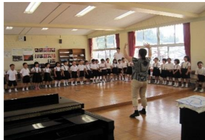
1年生の元気な合唱(邑智小)