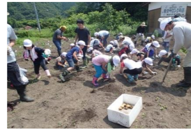
邑智小学校は、滝原すずめ会の皆さんと野菜を栽培します。獣害の勉強もしています。