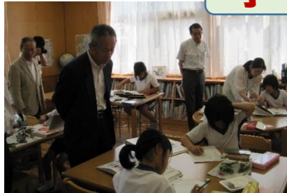
集中して調べ学習に取り組んでいます(大和小)