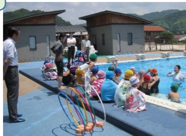
1, 2年生のプール学習(大和小)