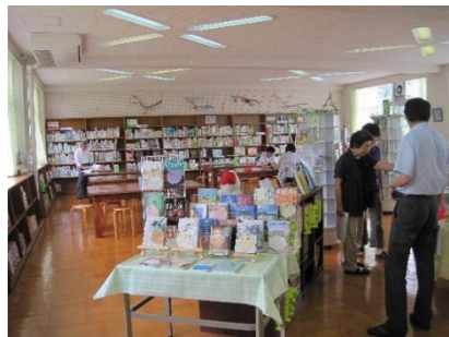
居心地よく整備された図書室(邑智中)

委員恒例の学校訪問は、教育に し全員の行事でも楽しみ すべりて行事を回り、授 業の様子を観望し、子供 きたまじと一緒給食も きたまじと一緒給食も 落ち着いた心算で、校 組んではいよいよまじと 組んではいよいよまじと