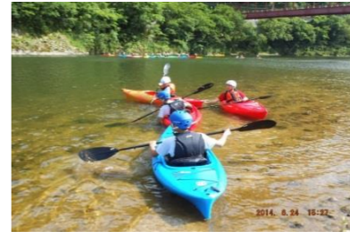
邑智中学校はカヌー体験をします。ふるさと江の川の自然や雄大さを、カヌーを通して学びます。