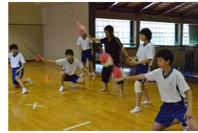
大和中学校では、都神楽団の皆さんからみっちり神楽の指導を受けます。文化祭で披露しています。