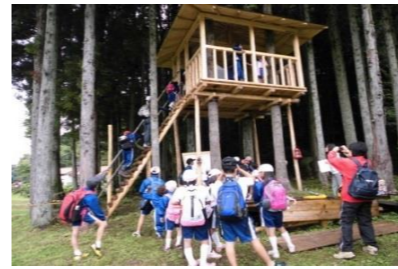
大和小学校の今年度の遠足は比之宮地域です。できたばかりのツリーハウスに子どもは大喜びです。