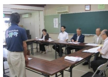
公民館事業の説明(比之宮公民館)

6/25(水) 比之宮公民館⇒大和小学校⇒都賀公民館⇒学習支援館(長藤) ⇒給食センター⇒都賀行公民館 6/26(木) 君谷公民館⇒邑智小学校⇒邑智中学校⇒沢谷公民館