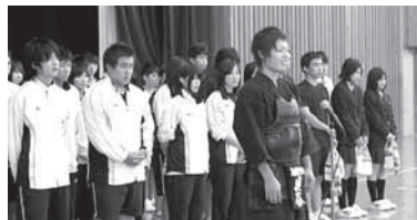
総体壮行式で挨拶をする剣道部主将(中央)