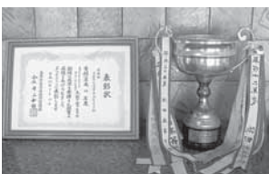
賞状・トロフィー

5月28日(金)～30日(日)に大田球場で行われた『平成22年度島根県石見地区高等学校野球大会』に本校野球部が出場し、準優勝しました。夏の全国高等学校野球選手権大会島根県大会でも良い成績をのこせるように日々の練習に力が入っています。応援ありがとうございました。今後とも御支援の程よろしくお願ひします。