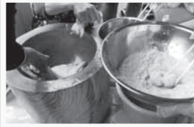
MENU きなこ餅・あべかわ餅 砂糖醤油餅