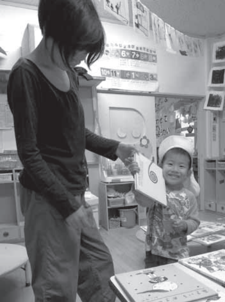
因原保育所での移動図書館

たくさんありますが、長女は『めっきらもっきらどおんどん』（長谷川摂子作／降矢なな画／福音館書店）、次女は『14ひきのシリーズ』（いわむらかずお作／童心社）で絵を2人で楽しみました。3番目は男の子で『のせてのせて』（松谷みよ子文／東光寺啓絵／童心社）です。絵本の場面に「まっくらまっくら…でたー」というトンネルから抜けるところがあります。内容を覚えてしまっただけ、実生活で車に乗ってトンネルを通ると、いつも「まっくらまっくら…で