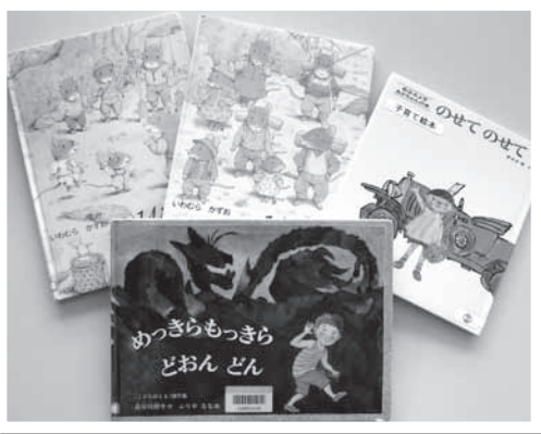
福田家のお子様達がお気に入りだった1冊

たくさんありますが、長女は『めっきらもっきらどおんどん』（長谷川摂子作／降矢なな画／福音館書店）、次女は『14ひきのシリーズ』（いわむらかずお作／童心社）で絵を2人で楽しみました。3番目は男の子で『のせてのせて』（松谷みよ子文／東光寺啓絵／童心社）です。絵本の場面に「まっくらまっくら…でたー」というトンネルから抜けるところがあります。内容を覚えてしまっただけ、実生活で車に乗ってトンネルを通ると、いつも「まっくらまっくら…で