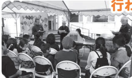
(写真)：読書ボランティアグループつくしんぼの皆さんによる紙芝居の様子