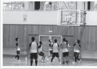
男子バスケットボール

当日は、雨天のため外での競技は出来ませんでしたが、体育館では男女ともバスケットボール、今回初めて行われたフットサルで熱戦が繰り広げられました。また、食物実習室ではPTAによる「餅つき大会」も行われ、昼休みには生徒と保護者が一緒に餅つきをするなど交流を深めました。