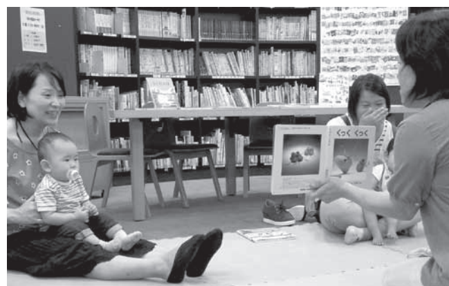
かわもと図書館での読み聞かせ

では、学校図書館を取り巻く様子は、どのように変化してきたのでしょうか。次回、川本町の実態を踏まえお伝えします。