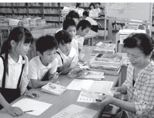
川本小学校図書館での貸出の様子

決して、量は多くなくても良いと思います。心に残る1冊に出会わせてあげるのが、大人の役割だと思えます。長く読み継がれてきた本は、確かに力があります。読書をしてこなかった子どもには、時代背景が違ったりして難しい場合もありま