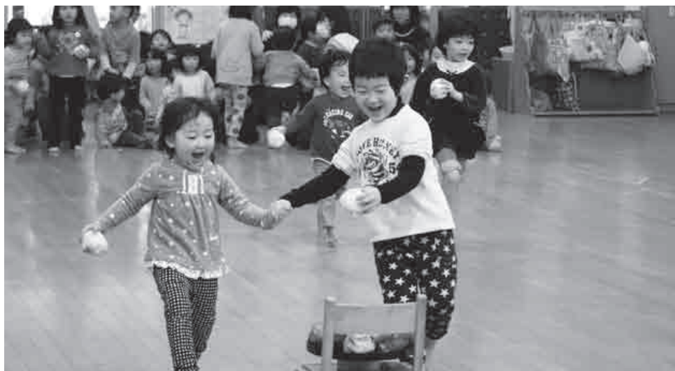
2チームに分かれて「ひなあられゲーム」を楽しむ園児

園児一人一人が作ったひな人形が飾られた川本保育所（園児64人）のホールで、ひな祭り会が行われました。