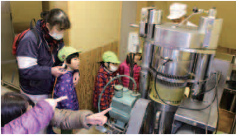
機械からしたたり落ちる油に見入る園児ら