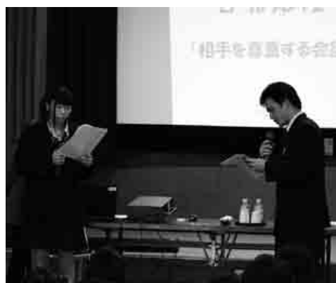
相手を尊重する会話を実演する生徒