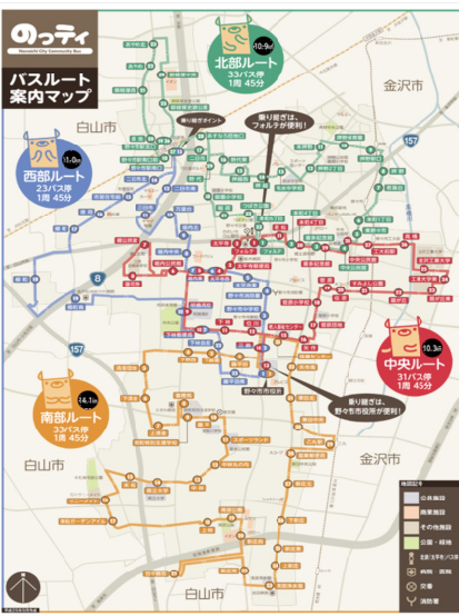
「のっぺい」路線図

運行時間は、通勤・通学・買い物に対応しています。バス車両は、高齢者、障害者の利用を考慮し、小型の低床フルフラットタイプのノンステップバスが採用されています。運賃も安く、どこまで行っても100円です。更に、バス停留所の屋根、ベンチは住民の協力・負担で設置されています。