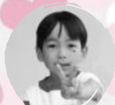
くまがい さとし おおきなこえでほれをよみたい