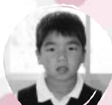
さわだ としき やきゅうをがねほしい