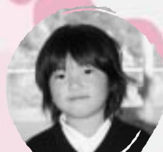
しおだ ちなつ はしるこをがねほしい