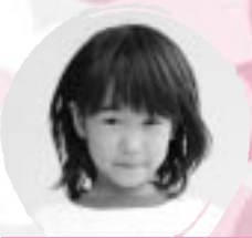
くろすみ あやか おそうしがじょうおにないたい