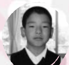
たむら りょうま やきゅうがじょうぎにないたい