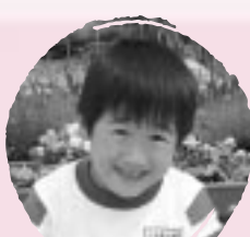
もりしま ゆうき べんきょうをいっぱいがねはる