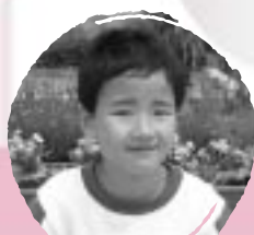
かど かいしゅう みんなとながよくあそびたい