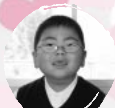
おくの たいすけ やきゅうがじょうぎにないたい