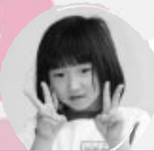
ごとう まき のほいほうもうえまごのほいたい