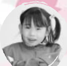
おくの りな きゅうしよくものこさおたべたい