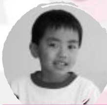
たかはし ひなた こつほうもがねほいたい