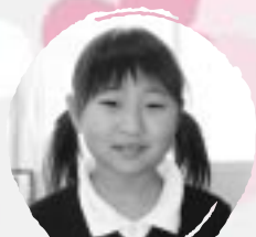
たかた ももこ べんきょうをがねほしい