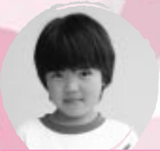
ふじはら まいの じをきれいにかきたい