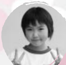
かげやま ともが かけこがはやくないたい