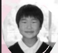
ほんだ このみ てつぼうをがねほしい