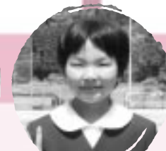
ふじはら りか おんがくどうたうのがたのしい