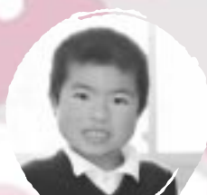
たかはし とおる やきゅうがじょうぎにないたい