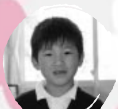
ふくま りゅうのすけ べんきょうをがねほしい