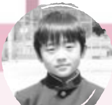
いしだ そうた たいくまやとびほがしたい