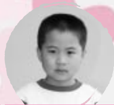
たなか こうじろう けいせんがとくいにないたい