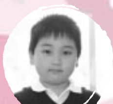
ふじはら ますみ やきゅうをがねほしい