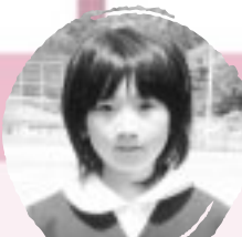
ごちょう なほ ながなわとびがしたい