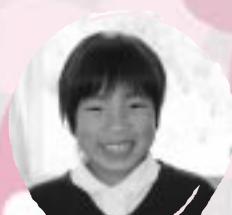
たなべ じょう やきゅうがじょうぎにないたい