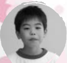
いしばし たくみ さかだちができるようになりたい