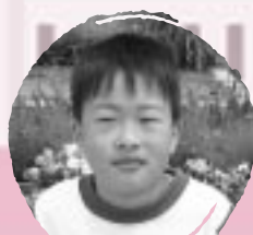
おの よしひろ ともだちがぶてうれしい