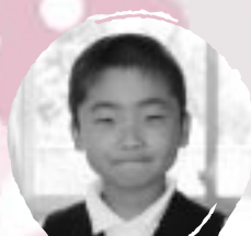
さわだ たくじ やきゅうをがねほしい