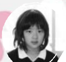
おくの きらら バレーボールがじょうぎにないたい