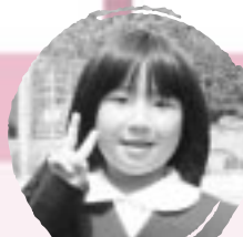
さかもと すずな おんがくやいろぬいがたのしい