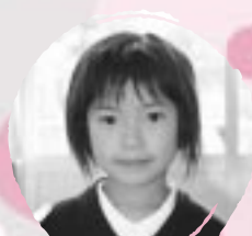
ながおか あかね べんきょうをがねほしい