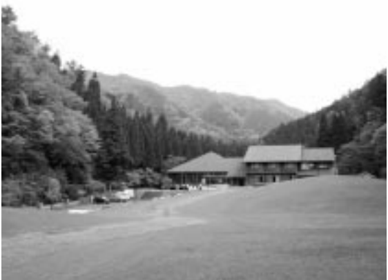
4月29日にオープンするふるさとの森「もりのす」

職員の地区担当制の充実と出張出前講座の内容の充実などにより、直接住民の皆さんとの対話や住民意見を吸い上げる機会を拡大し、住民と行政の情報共有化を図ります。