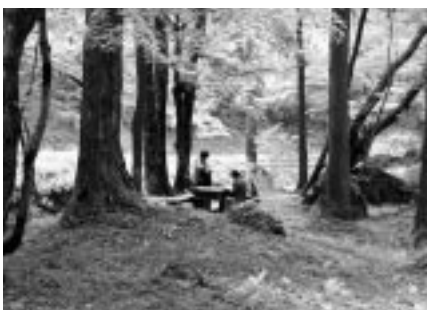
「エコ米」の刈り入れ