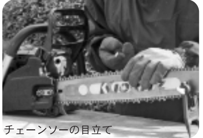
チェーンソーの目立て

また間伐材の活用を図るため、間伐材を使ったパタパタ扉のごみ箱づくり、ヒノキを使った秋の寄せ植えなどの講習会を開催します。