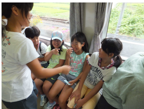
宇都井駅から三江線に乗って!