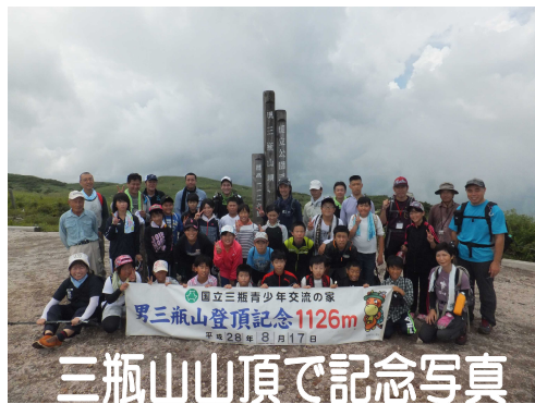
三瓶山山頂で記念写真