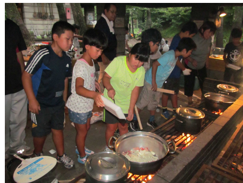
みんなで協力してカレー作り