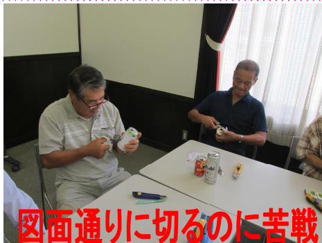
図面通りに切るのに苦戦

空き缶風車は、元々鳥よけ用として考えられましたが、少しの風でもよく回り、きれいなため庭先に飾ってあるのを最近よく見かけます。8月22日(月)に講師をお招きし阿須那公民館でも「空き缶風車を作ってみよう」を開催し、21名の参加がありました。空き缶に図面を貼り付け切っていくのですが、きれいに切るのは難しくガタガタになったり、完全に切れてしまったりと参加された方は苦戦していました。しかし、できあがるととてもよく回ってきれいでした。今回は、350mの一段の風車しか作りませんでした。二段や三段にも挑戦したいと参加された皆さんは図面を持って帰っておられました。