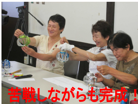
苦戦しながらも完成!

ケーブルテレビでも放送され、たくさんの方が図面を取りに来られています。ご自身で作ってみたい方は阿須那公民館までご連絡ください。