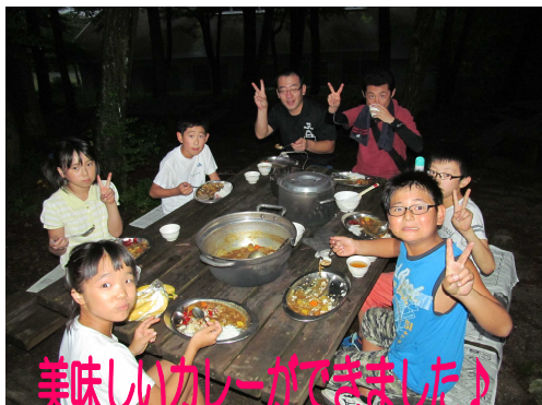
美味しいカレーができました!