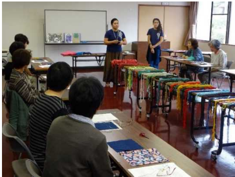
アイヌ伝統文化の工芸品