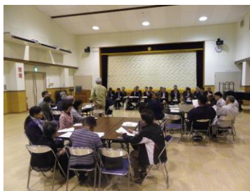
第一部は執行部への質問です。避難所としての備蓄品やゴミの不法投棄監視について活発な意見が出されました

邑南町では、人員不足の傾向が強く社員を募集している企業もたくさんあるが、労働条件などから応募しない若者や、それに伴う外国人労働者への依存状況があることが分かりました。市木をより良くしていくために、ご意見などがございましたら公民館へお知らせください。