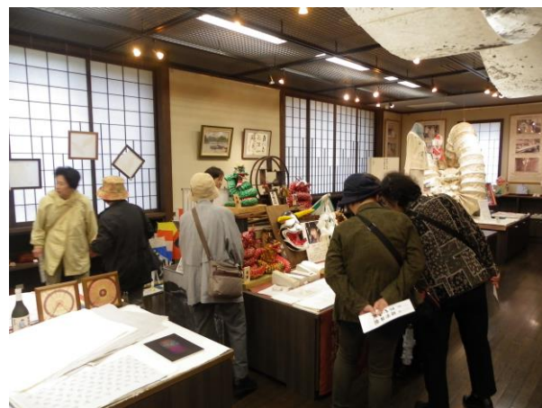
石見神楽で使われる面や蛇胴も石州和紙で作られています！

これらの和紙は、良質な原料が採れる地域だからこそ発展した、重要な伝統工芸であり、後継者育成にも取り組んでいるそうです。