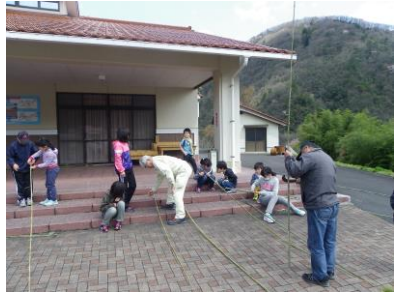
高学年が手伝いながら、みんな上手に竿が作れました！