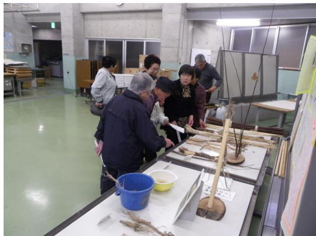
作業工程も見学させていただきました