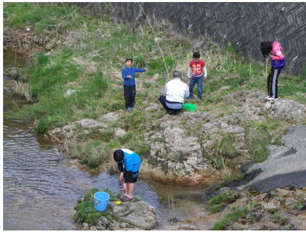
たくさん釣れて子ども達も大はしゃぎでした