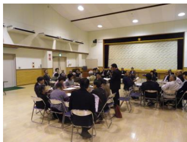
第二部はワークショップです。市木地区に人を呼び込むため、たくさんの意見がでました