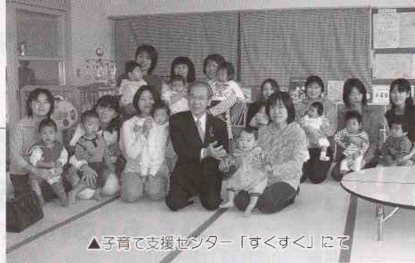
▲子育て支援センター「すくすく」にて