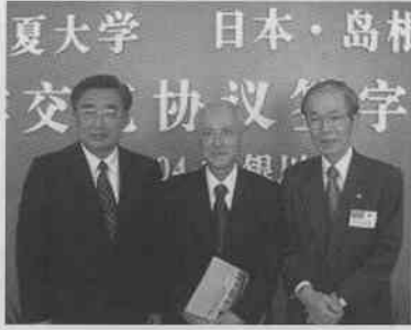
▲右から宇津市長、宇野学長、陳校長

平成16年10月11日(月)に、私を含め県立大学から4人と、浜田市石嘴山市友好都市協定締結10周年記念訪問団が中国・寧夏大学を訪問し、両大学間で5年間の交流協定を締結しました。