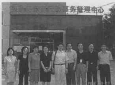
▲右から4人目が筆者

しかし、2003年10月に6万人の住民を持つ北京市石景山区魯谷街道弁事処では、自主選挙によって200人のコミュニティ代表が当選され、コミュニティ代表会議で37人からなるコミュニティ委員を選出された。また、その役場も管理センターに変身して魯谷コミュニティに改称した。よって、その行政的役割も変わって、社会福祉などを重視するものになっている。さらに、2004年1月には石景山区のすべての街道弁事処はコミュニティに改造・改称された。この地方行政改革テストは世界で注目を浴びている。