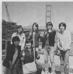
▲サンフランシスコにて

るだけの受け身の授業は一切ありません。先生の質問には進んで意見を言うことが求められます。先生は誰かを指名して答えさせるのではなく、誰かが発言をするまで待つという具合です。 モントレイ国際大学での授業は私にとっても新鮮なものでした。非常に有意義な時間を過ごすことができました。