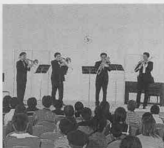
▲昨年のコンサートの様子