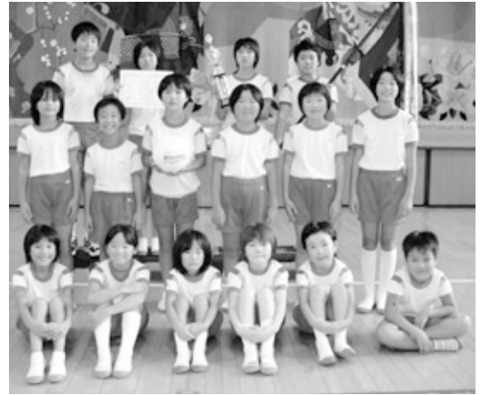
優勝した井野キッズクラブAチーム