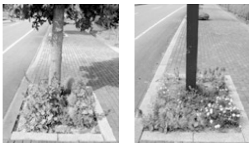
年間を通してこのように素晴らしい植栽で大学通りを彩ってもらっています。

仲間、企業で...ごなたでも結構ですので、大学通りにマイガーデンをつくりたい人は、申し込んでください。