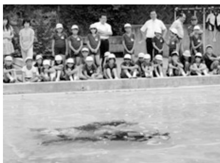
潜水士を目で追う児童たち