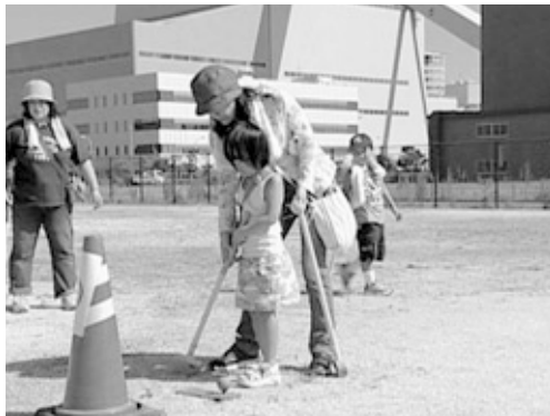
発電所をバックにグランドゴルフを楽しみました。