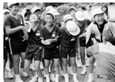
潜水服ってこんなふうに着るんだ？