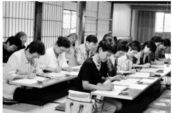
写経に挑戦! 心を落ち着かせ、集中しています。