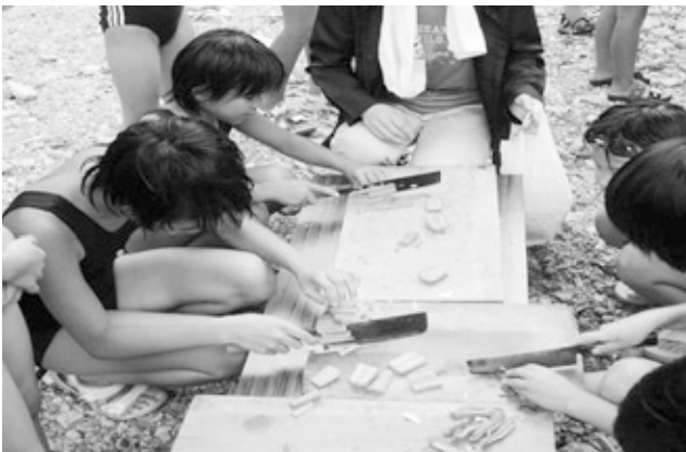
昼ご飯の用意もしたよ