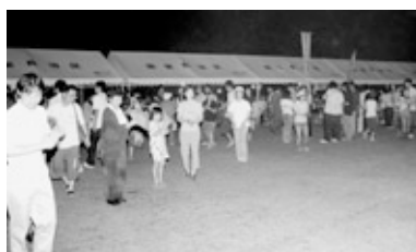
(地域政策課・弥栄支所総務課)

今後も、各集落が実施する行事や自治区内でのイベントにこのパイプ TENT を活用することにより、地域コミュニティ活動の活性化に大きく寄与できるものと期待されます。