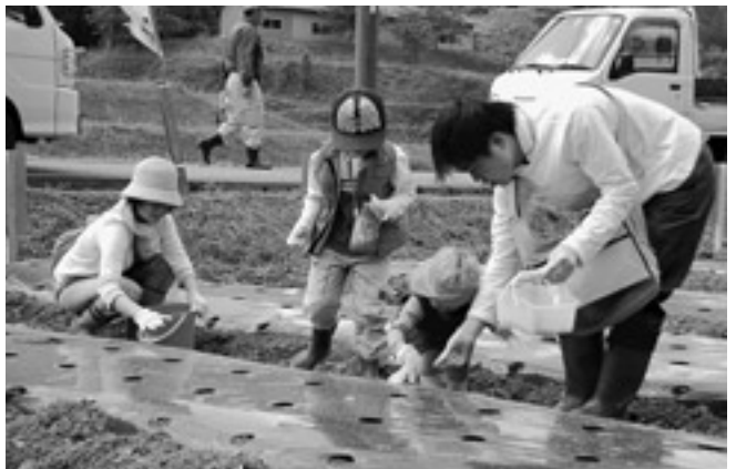
仲良く種まきをする親子