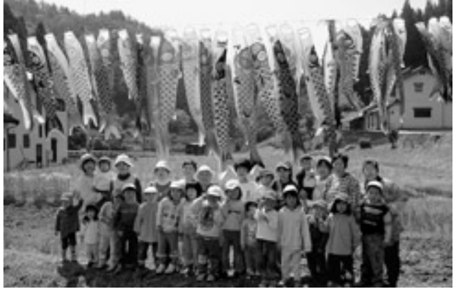
こいのぼりの様に元気よく

当日、園児たちは、春風にこいのぼりが元気よく泳ぐ様子を見たり、触ったりして楽しんでいました。