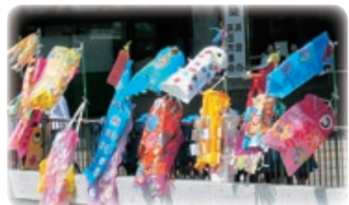
市内保育園児作 こいのぼり