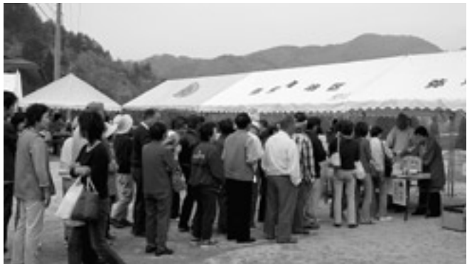
行列ができたどぶろく販売

会場は、自治会主催の各種テントコーナーが設けられ、弥栄和牛を利用した「弥栄バーガー」や「弥栄和牛丼」などの弥栄の食材を利用した産品が多く出店され、体験コーナーでは「ヤマメのつかみ取り」や「釣堀」などが子どもたちに好評でした。