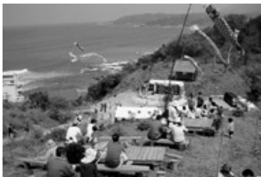
爽やかな風を受け自然を満喫

4月15日(日)、三隅町古市場のはりも山公園で、「はりも山で自然を食う」が開催されました。