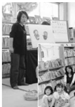
パネルシアターを 楽しそうに見入る 皆さん