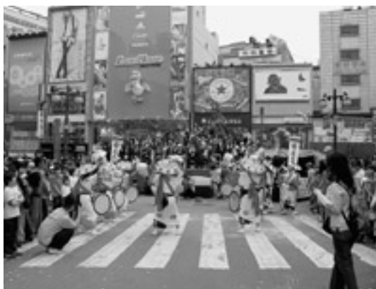
メインストリートで田ばやしの上演 「交流事業に花笠が満開」