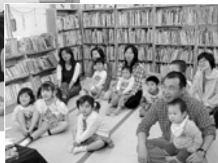
◀ 折り紙に熱中する親子