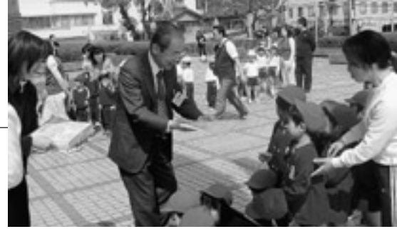
4/26日「このぼり掲揚式」に参加した、みなと・こくふ・おくに各保育園児の皆さんの健やかな成長を願い、このぼりを掲揚しました。