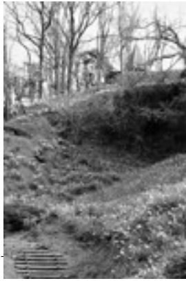
冬の景観大賞「早春」

景観大賞 (1点) 賞状、賞品 (2万円相当) 景観賞 (14点) 賞状、賞品 (5千円相当)