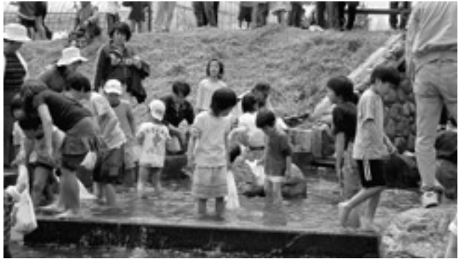
ヤマメを追いかける子どもたち