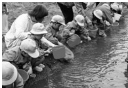
「早く、大きくなってね！」