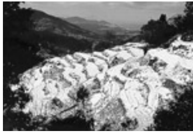
冬の最優秀賞「冬の室谷」