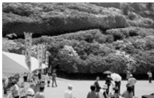
今年も見事に咲いたね。

祭りの期間中は、石見神楽の上演や特産品の販売などで、訪れた観光客を楽しませていました。