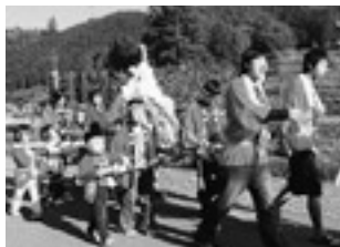
秋祭りでの子ども御輿