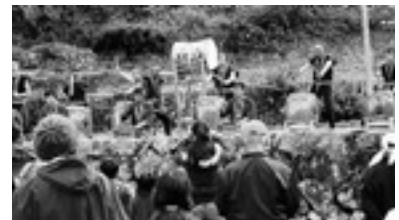
寒さ吹き飛ばす「棚田ウォーク」での来州太鼓