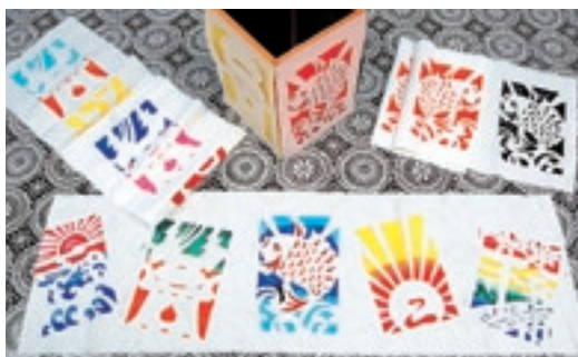
▲切り紙ステンシル