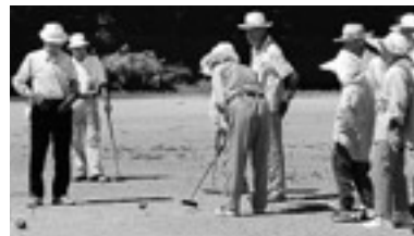
「ライジングサンスポーツ王国」ゲートボールの部

全国的な猛暑で熱中症が心配されましたが、まぶしい太陽のもと、いきいきと活動される子どもやお年寄りの姿が見られました。