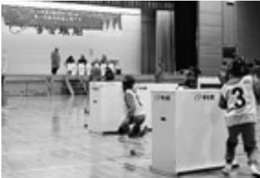
暖冬の影響で屋内開催となった「島根県雪合戦大会」

新春を彩る成人式、消防出初め式の挙行。そして旭の冬といえば雪合戦。ジュニアの全国大会では「あさひスポーツクラブ」が初出場にして準優勝の快挙をなしとげました。