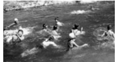
「わんぱくキャンプ」での川遊び 気持ちいい～！