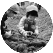
大きなおイモ！大地の恵みです

運動会や秋祭り…秋は各地区でイベントが満載！収穫の喜びを感じる新米をはじめ、秋の味覚もふんだんに味わいました。