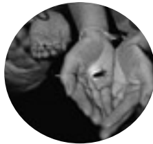
夏の風物詩 ほたるもたくさん舞いました