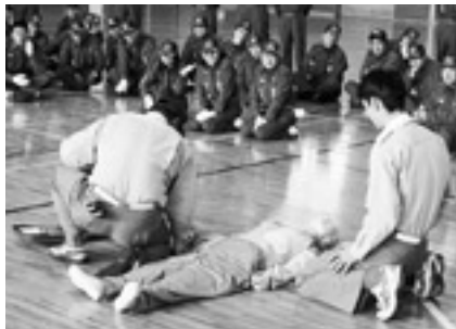
AED を使用し応急救護の実演

12月2日(日)、ふれあいジム・かなぎ（金城町七条）において市消防団金城消防隊が冬季訓練を行いました。