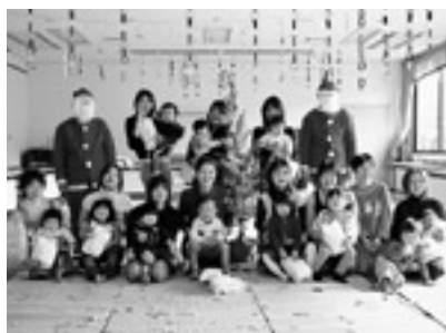
みんなで仲良く集合写真

各公民館で、月1回開催しており、子育て支援隊や、地域支援者、社協、市で協働開催しています。 12月に開催された子育て広場の様子を一部紹介します。 子育て広場は、毎月楽しみにして、参加する親子が増えています。