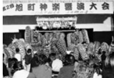
旭の舞が集結！「旭町神楽響演大会」

春の訪れとともに都川小学校、木田・和田保育所が閉所となりました。隔年開催の神楽響演大会が華々しく開催されました。