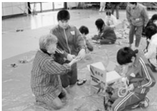
中学校を卒業するときは、しめ縄作りの名人？

事前講習会で勉強し技を磨いた地域の皆さんが、子どもたちに指導する姿、毎年作っている中学生が幼稚園児の手助けをする姿・・・と、参加した皆さんは、世代を超えたあたたかい地域交流に楽しそうでした。この日作られた個性あふれるしめ縄は、お正月にそれぞれの家の玄関に飾られました。