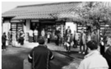
ふるさと再発見！「旭めぐりツアー」