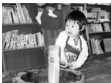
おいしいもちができるかな～

各公民館で、月1回開催しており、子育て支援隊や、地域支援者、社協、市で協働開催しています。 12月に開催された子育て広場の様子を一部紹介します。 子育て広場は、毎月楽しみにして、参加する親子が増えています。