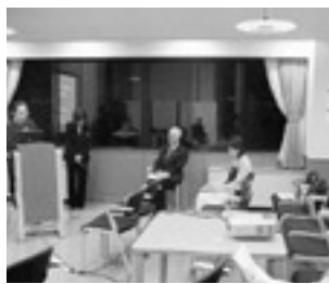
前回も多くの市民の皆さんが参加しました