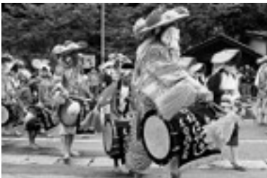
「旭温泉まつり」での田囃子