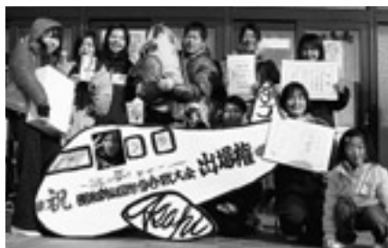
レディースの部 優勝 「デンジャラスガール」