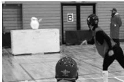
引き分けの時に言う VT 戦 雪だるまが落ちれば得点！