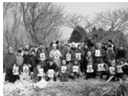
嘸山頂上で記念撮影

当日、午前9時に出発し嘸山の遊歩道を歩き、頂上へついた一同は、絶景をバックに新年の決意を1人ずつ発表、もちを焼いて食べたり用意したおしるこを飲みながら元気で楽しい新春を山頂で迎えました。