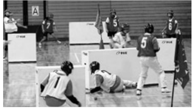
センターシェルター（防護壁）奪取をかけた熱い攻防

2月に北海道の昭和山山麓で開催される国際大会へは、今大会の優勝チームを含む代表が参加し、全国のチームを相手に今度は雪上での熱い戦いに挑みます。