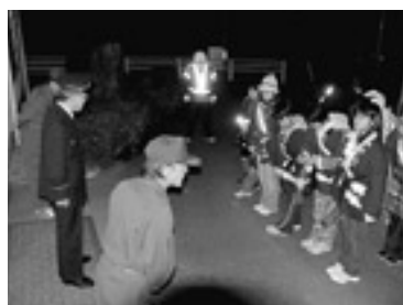
市役所金城支所前で暖かくお出迎え