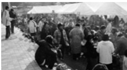
大賑わいの市木自治会によるバザー 交流会にもご協力いただきました

今回は第10回を記念し、競技のほかにも大会を盛り上げる企画が満載。初日の試合終了後には、交流レセプションが催され、楽しいゲームや地元の味を囲みながら雪合戦を通じた交流の和が広がっていました。