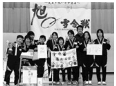
ジュニアの部 優勝「今市暴れん坊9」