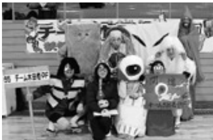
フレンドリーの部は コスチュームもユニーク！