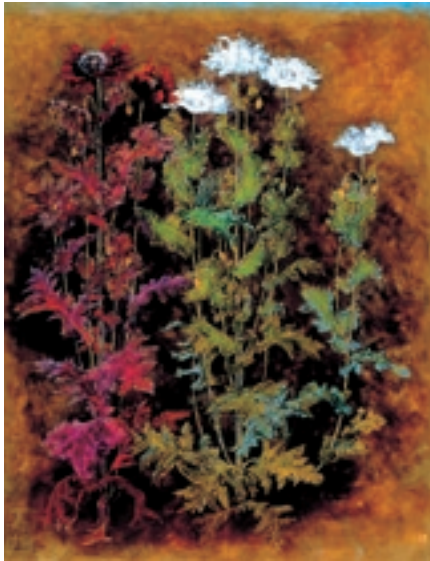
嬰粟 (けし) 1998年

石正美術館では、『石本正と楽しむ裸婦デッサン』(新潮社)が刊行されたのを記念して企画展「石本正 聖母を描く」を開催します。 日本画家・石本正にとって、