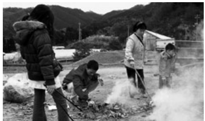
「焼き芋おいしく焼けたかなー」