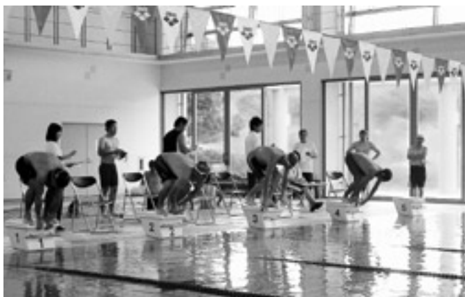
見事なスタート 好記録を期待!!

また、お楽しみタイムではアクアみすみのスタッフと参加者による100m個人メドレーのレースを行い、笑いあり感動ありの楽しい1日となりました。