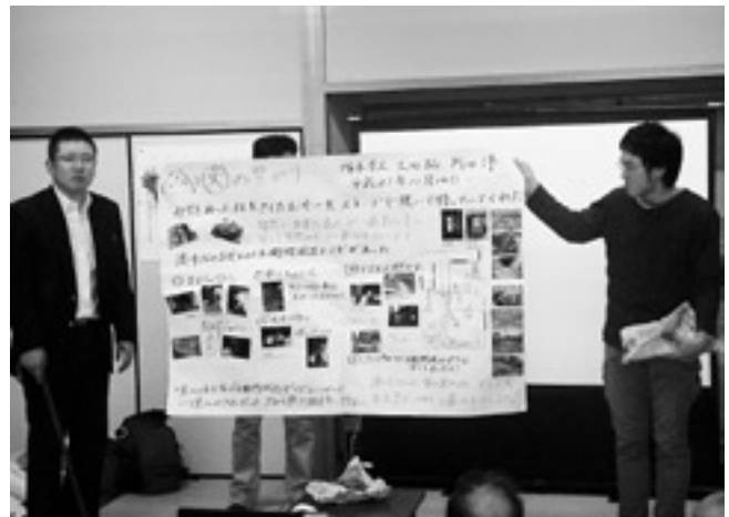
写真を多く使ったの絵地図で説明

地元の特産品のグループ「大坪ゆずがらし会」を中心に、その歴史や食べ方などを学習しました。身近な地元のことを具体的な絵地図に表すことで、地域の良さや、見失いがちな貴重な資源を再発見する良い機会となりました。