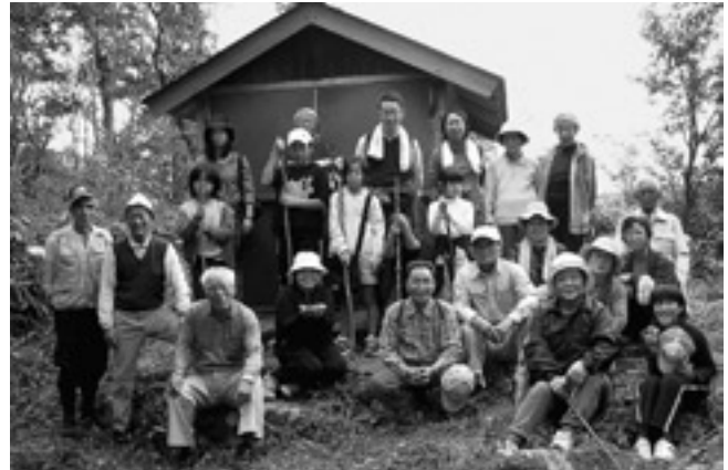
頂上のお宮の前で、笑顔の参加者の皆さん

日頃、見慣れている近くの山も、登ってみるとまた感慨深いものがあります。初めて登る人が多く、紅葉で色づいた景色を眺めながら、途中でゆっくりと休憩をしての山登りとなりました。下山後は「和八料理教室」の人が作られたおむすびや豚汁をみんなで食べながら、楽しい交流を深めることができました。