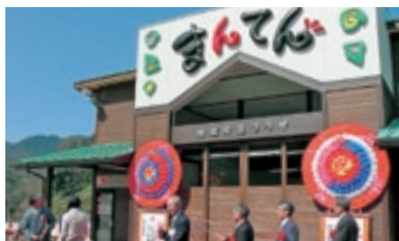
地域交流プラザ「まんてん」オープン