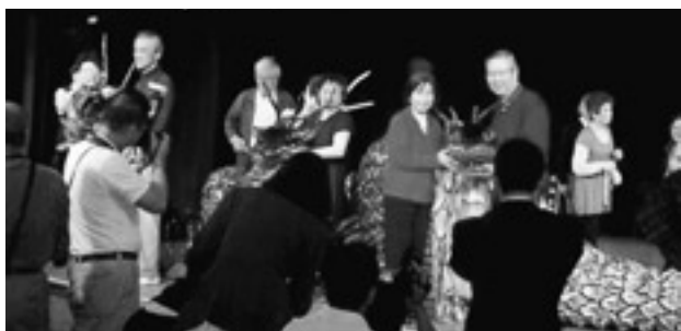
船内で石見神楽の上演を行い、終了後には記念撮影も行われました

11月27日(金)、日本最大級のクルーズ客船「飛鳥Ⅱ」(50,142トン)が浜田港福井ふ頭に初入港しました。