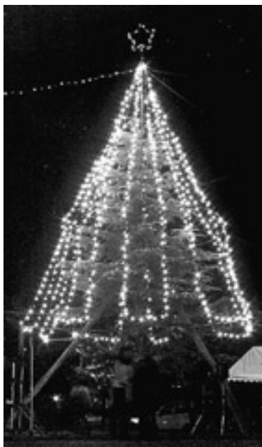
市民に届け！「希望の灯」