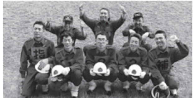
男性団員 防災の要、頼もしい防災リーダー