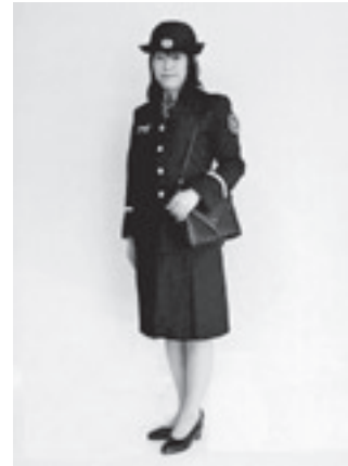
女性団員 制服を一新し、イメージアップしました。