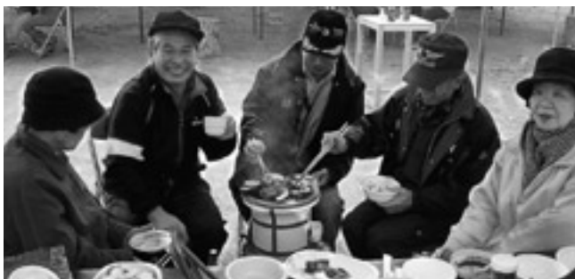
あったかい七輪の温もりに満足