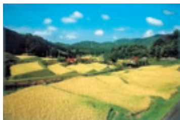
「昨年の最優秀作品」

裸婦は究極のテーマ。89歳の現在も、自分だけの裸婦像を求めて日々制作に没頭しています。 本展では、『石本正と楽しむ裸婦デッサン』に掲載された女性像と花・風景などの作品をデッサンとともに紹介します。石本作品が誕生していく様子をご覧ください。石本正の絵を描くよろこびや創作姿勢をお伝えできれば幸いです。 期間 1月2日(土)～3月28日(日) 料金 一般 500円(団体400円) 高生300円(団体240円) 小中生200円(団体160円) ※ 1月18日(月)～22日(金)は、新館工事のため臨時休館します。 《展示室》 1月2日(土)～3月28日(日) 石本正 聖母を描く