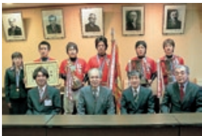
全国専門学校軟式野球選手権大会 優勝 リハビリテーションカレッジ 島根野球部