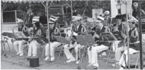
音楽隊団員 消防音楽隊として演奏活動を行っています。

消防団は、法律に基づいて設置される市町村の消防機関で、消火活動はもちろん、地震や風水害などの災害が発生した際の災害防止活動を行うほか、平時は訓練・火災予防広報活動などを行っています。また消防団活動は、地域における若者のコミュニティの場としても役立っています。