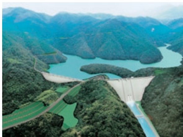
第二浜田ダム完成予想図