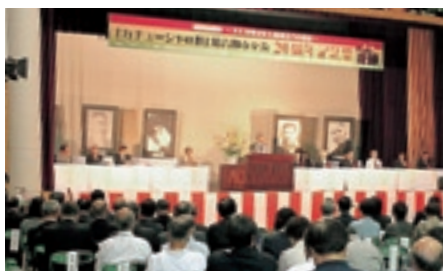
「カチューシャの唄」知音都市交流 20周年記念祭