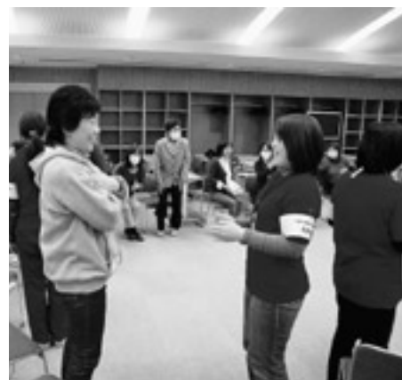
放課後児童クラブ研究集会の様子

当日は144人の島根県内の児童クラブ指導員などが集まり、今回の研究集会で感じたことを明日からの児童クラブで活かそうと熱心に耳を傾けていました。