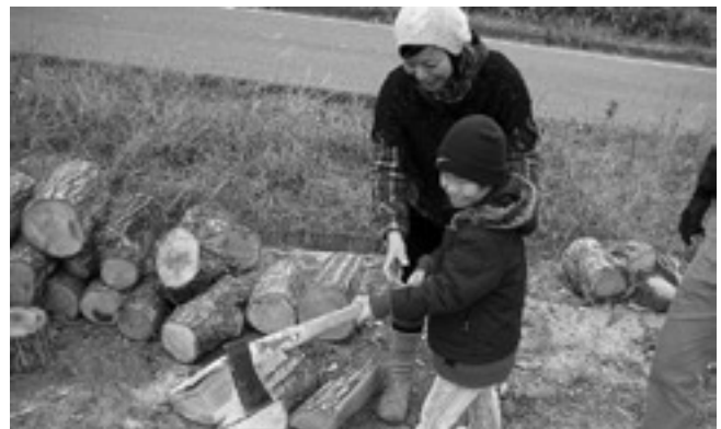
「よいしょ」薪割り初体験

昔ながらの薪割り体験や、落ち葉での焼き芋、七輪を使っての弥栄牛の焼肉、地元集落特製のしし汁などの体験をしながら、脱温暖化について考える場となりました。当日は市外からも多くの人を訪れ、「炎」と「煙」と「湯気」の中で普段の生活と比較しながら、自然の大切さを感じることができました。室内の一角では薪ストーブが焚かれ、その周りには笑顔でぜんざいを食べる参加者の姿がありました。