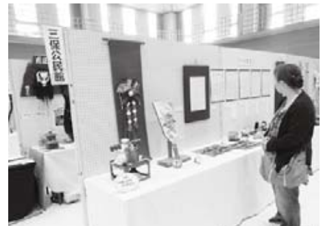
屋内ブースでの展示