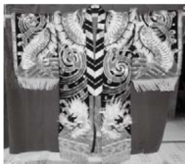
石見神楽「人倫」鬼着