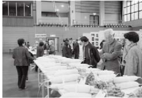
農産物の品評会・即売会には、今年も立派な野菜が出展されました

17団体の展示・14団体のバザーなどの出店があり、会場はにぎわいを見せていました。