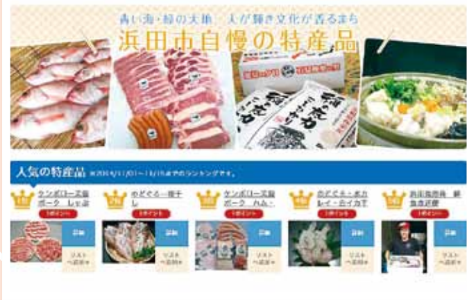
(写真③) 浜田市へのふるさと寄附が5億円を突破