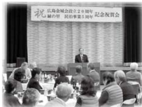
広島金城会設立20周年記念祝賀会に出席しました(11月16日)