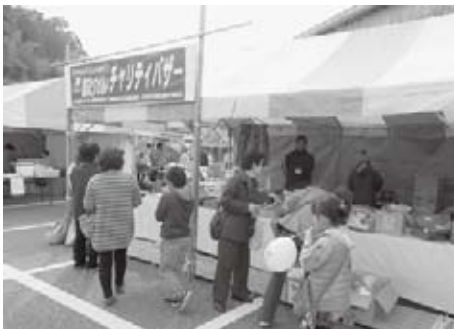
屋外出店ブースの様子