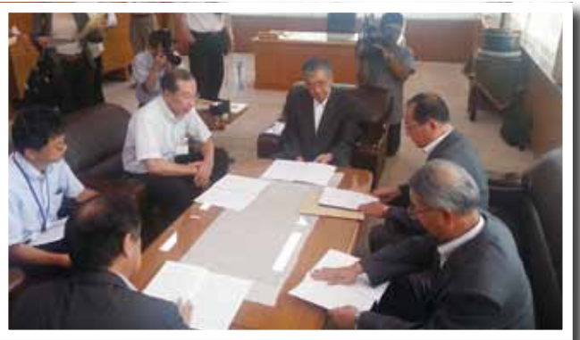
(写真②) 島根県知事に島根県立大学学部増設の要望書を提出