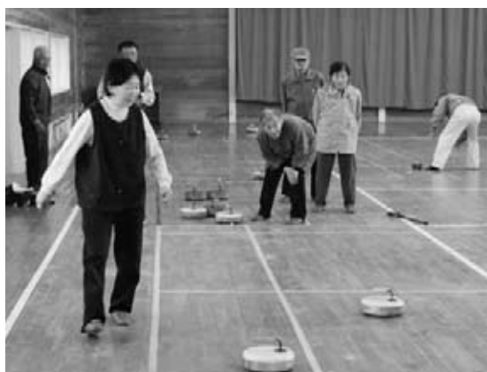
カローリングを楽しむ参加者