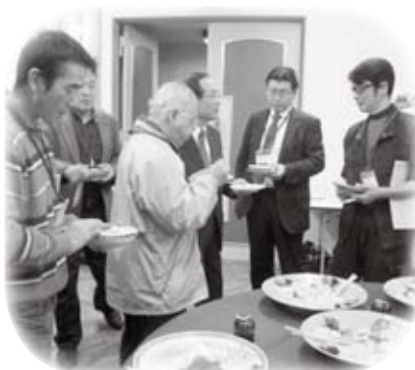
高鮮度ミズグレイ試食会を開催しました(11月20日)