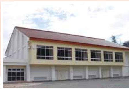
(写真⑪) 弥栄中学校体育館が竣工