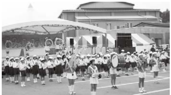
三隅小学校児童による鼓笛隊