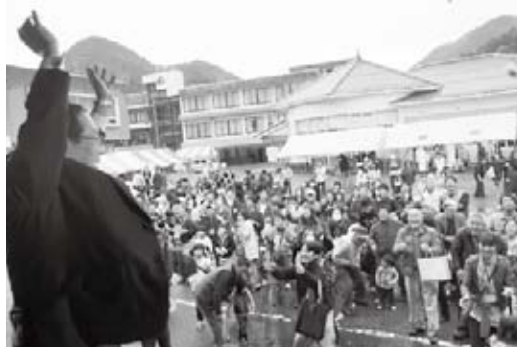
「祭」のフィナーレを飾る餅まき