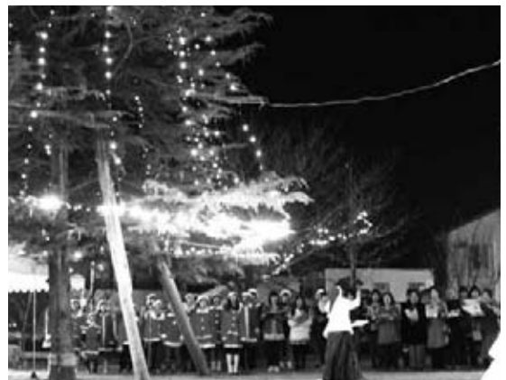
公園に美しい歌声が響きました