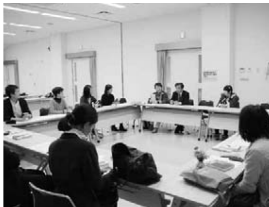
自分のオススメの本を紹介しました

当日は、10代から70代までの幅広い年代の人が、小説やエッセイ・絵本など自分のお気に入りの1冊を持ち寄り、本の概要やお気に入りの理由などを紹介しました。参加者は、ほかの皆さんから薦められた本について、「さっそく読んでみたい」と話していました。