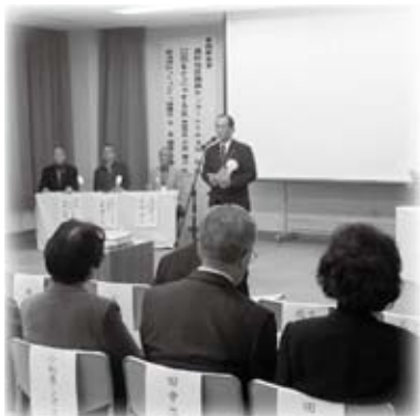
浜田市市民憲章推進大会及びまちづくりフォーラムを開催しました(11月15日)