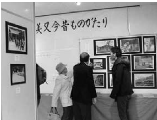
思い出話に花が咲きます