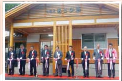
(写真⑩) 旭温泉あさひ荘をリニューアルオープン