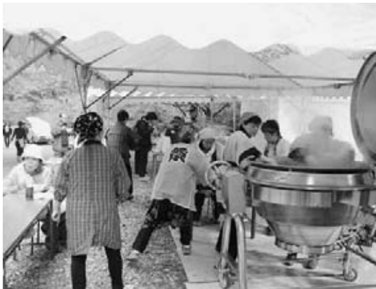
大きな鍋で芋煮を作りました