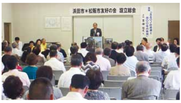
(写真⑤) 浜田市*松阪市友好の会が設立