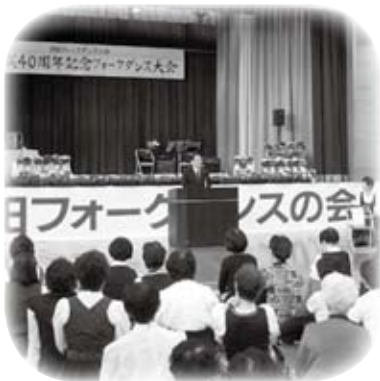
浜田フォークダンスの会結成40周年記念大会に出席しました(11月2日)