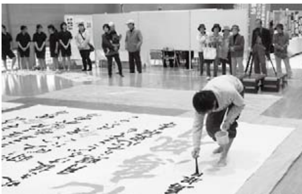
島根県立大学書道部と浜田高校書道部による書道パフォーマンス