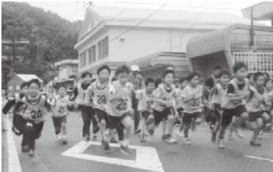
恒例の旭ロードレース大会では、120人が健脚を競いました