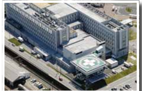
(写真⑦) 浜田医療センター救急搬送用ヘリポートの運用開始