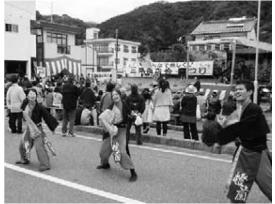
島根県立大学生によるよさこい橙蘭

当日は、商店街の中心を通る道路を歩行者天国として、綱引き大会やピンゴゲーム、餅まきなど多彩なイベントが行われました。会場に設置した特設ステージでは、石見神楽や島根県立大学生によるよさこい橙蘭、三隅中学校吹奏楽部による演奏なども披露され、会場を大いに盛り上げました。