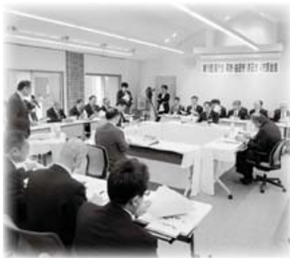
長門市・萩市・益田市・浜田市4市長会議を浜田市で開催しました(11月4日)