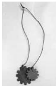
歯車のネックレス