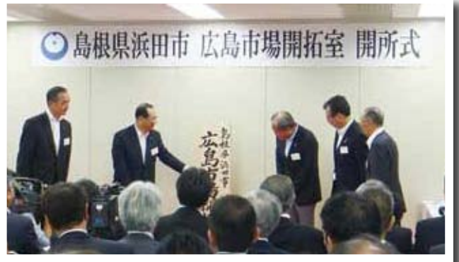
(写真①) 広島市中区に広島市場開拓室を開所