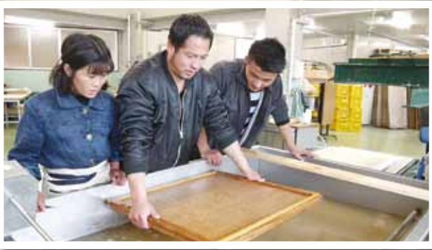
(写真⑥) 「和紙」がユネスコ無形文化遺産に登録決定、ブータン王国から紙すき技術研修生を受入れ