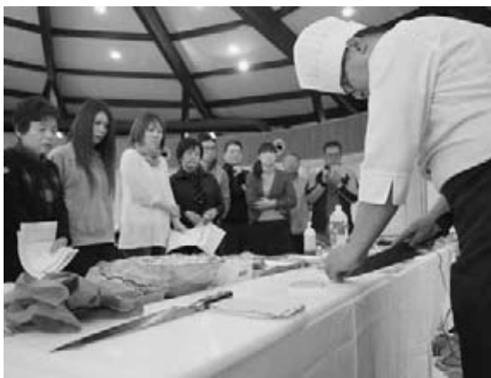
講師の包丁さばきを見つめる参加者