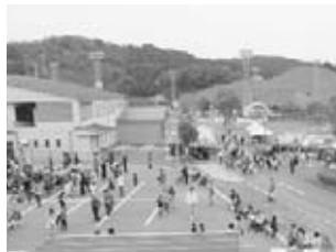
会場内はたくさんの人でにぎわいました