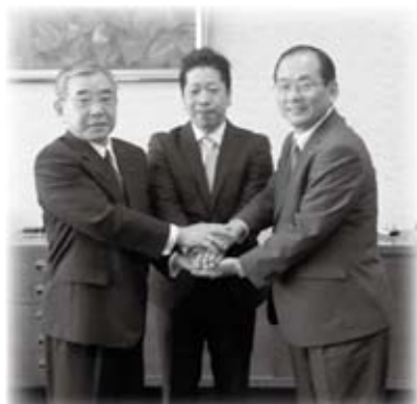
平和金属工業(株)(金城町)が島根県企業立地促進条例に基づく立地計画の認定を受け覚書に調印しました(11月21日)