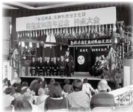
「有福神楽」島根県無形民俗文化財指定50周年記念神楽大会に出席しました(11月2日)