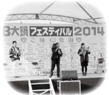
B B 大鍋フェスティバル2014ほか、各自治区で開催された秋のイベントに参加しました(11月3日)