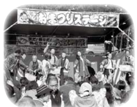
いわみ福祉会の大収穫祭に参加しました(11月23日)