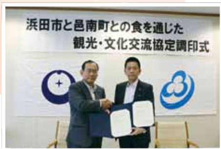
(写真⑨) 邑南町と食を通じた観光・文化交流協定を締結