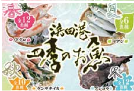
(写真⑧) 浜田港四季のお魚に26魚種を選定