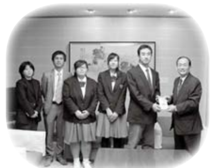
浜田水産高校の生徒から、土砂災害で甚大な被害を受けた広島市への義援金を預かりました(11月18日)