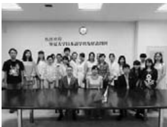
学長表敬後の記念写真

寧夏回族自治区は、中国の内陸部に位置するため海をみる機会が少ないそうです。今回は、あいにくの雨により波子海岸で過ごす時間は短くなりましたが、県大生との交流や、世界ごども美術館を観覧するなど楽しんで