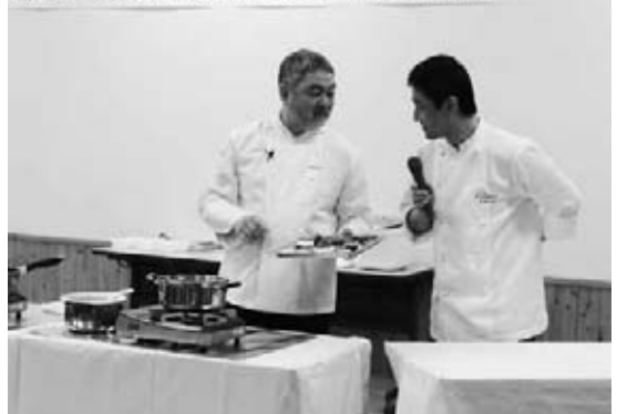
地元食材で「食」について語る三國シェフ