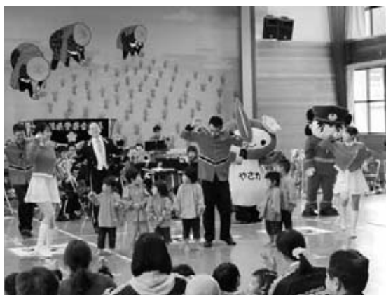
音楽隊の演奏にあわせて踊る園児たち