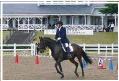
(写真⑫) 全国障がい者馬術大会が開催