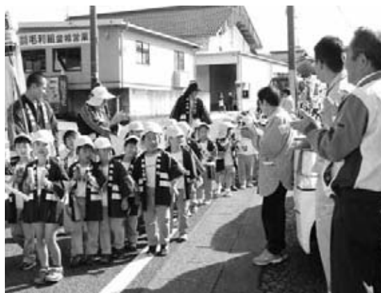
笑顔で火災予防を呼び掛けました

当日、園児たちは揃いの法被を身にまとい、拍子木を打ち鳴らしながら、「火の用心、マッチ1本火事のもと！」と、声を揃えて元気いっぱいに呼び掛けました。沿道の地域の皆さんから、パレードをする園児たちに「頑張って」と声援が送られました。