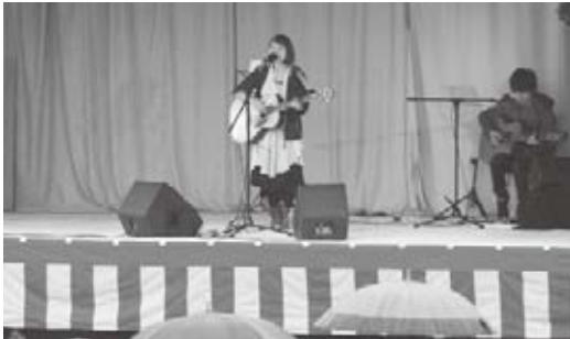
六子さんの楽しいステージ

17団体の展示・14団体のバザーなどの出店があり、会場はにぎわいを見せていました。