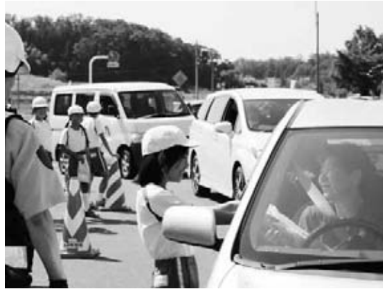
安全運転をお願いします

当日は、今福小学校5・6年生8人が「安全運転をお願いします」と声を掛けながらチラシやグッズをドライバーに渡し、交通安全を呼び掛けました。ドライバーの皆さんは、「ありがとうございます。気を付けて運転します」と笑顔で答えていました。