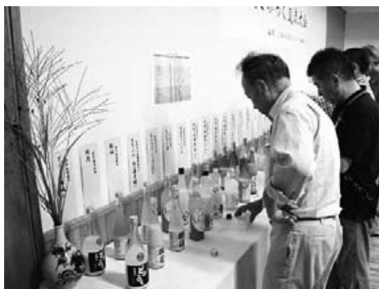
飲み比べを楽しむ参加者