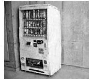
ものモノ#自動販売機

足踏みミシンなど、懐かしい生活用品をモチーフにした作品です。アンティーク雑貨のような風合いの作品をじっくりとお楽しみいただけます。