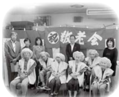
偕生園で行われた敬老会に出席しました(9月16日)