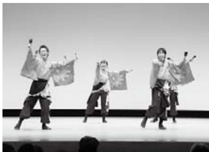
島根県立大学 よさこい橙蘭（特別出演）