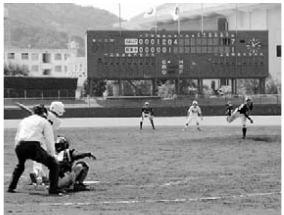
白熱した試合を展開

当日は、県内外から6チームが参加し、浜田市からは市内の各中学校の3年生で結成した「浜田シニアクラブ」が出場しました。結果は惜しくも第2位でしたが、チーム一丸となり白熱した試合を繰り広げました。