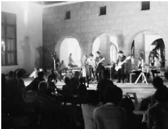
バンド演奏を楽しむ来場者