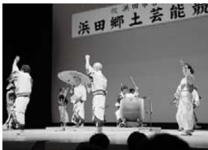
浜田盆踊り口説き同好会（浜田）