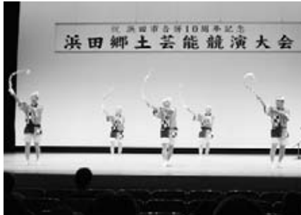
浜田郷土民謡保存会（浜田）

各自治区で大切に受け継がれている郷土芸能の継承者が一堂に会し、それぞれの演目を披露しました。