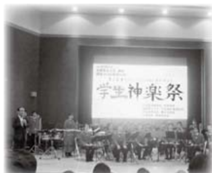
島根県立大学石見神楽サークルが主催した学生神楽祭に出席しました(9月20日)