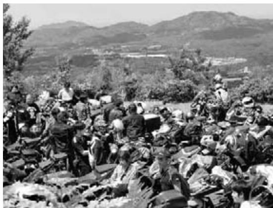
山頂の大パノラマを楽しむライダーたち