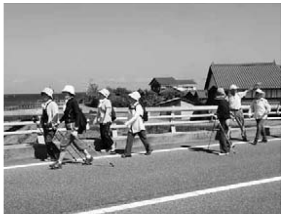
海の眺めを楽しみながら歩く参加者

岡見公民館では、地元の子供神楽社中による舞いが上演され、ゴールした皆さんにおにぎりや豚汁が振る舞われました。絶好のウォーキング日和の中、参加者は美しい海岸線や里山の風景と参加者同士の交流を楽しんでいました。