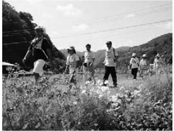
晴天のもとウォーキングを楽しむ

この日は、コースの見どころを記載した地図とこの季節に見られる草花の写真が配布され、ウォーキングを楽しみました。途中で設けられた各ポイントでは、自然や伝統・文化などの説明や、旭町出身者の版画の展示も行われました。参加者は、さわやかな秋空のもと、日本の棚田百選に選ばれた棚田など自然豊かな風景を楽しみながら、心地よい汗を流しました。