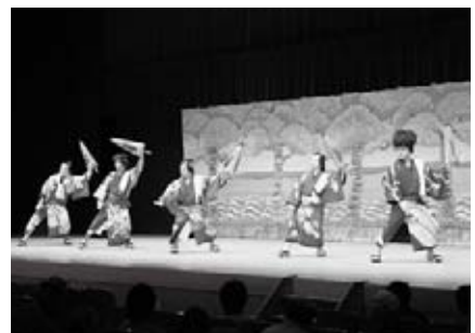
山陰久佐松竹座（金城）