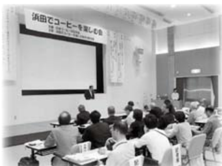
浜田でコーヒーを楽しむ会シンポジウムに出席しました(9月12日)