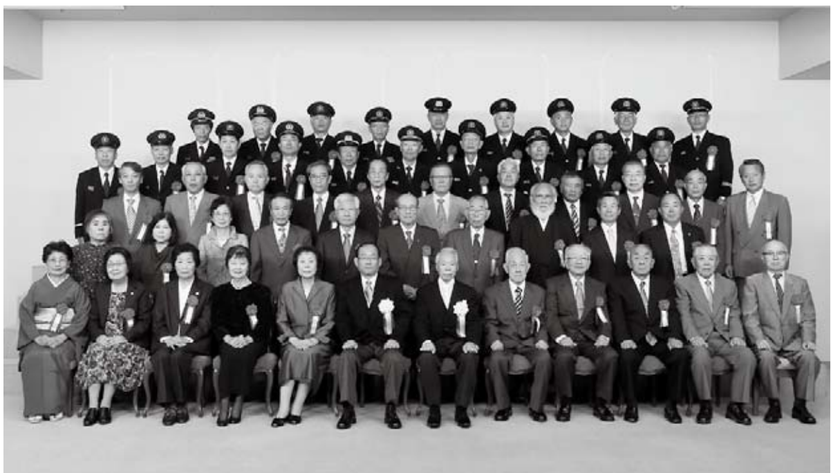
浜田市合併10周年特別表彰を受章された皆さん