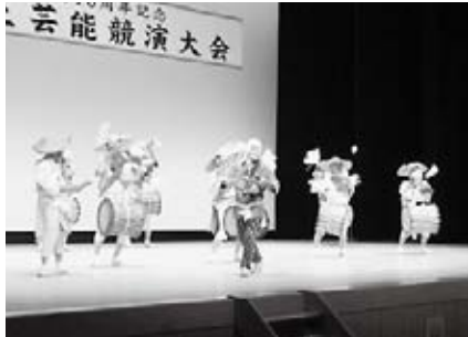
弥栄町田囃子保存会（弥栄）