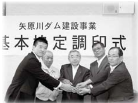
矢原川ダム建設事業に伴う基本協定書に調印しました(9月8日)