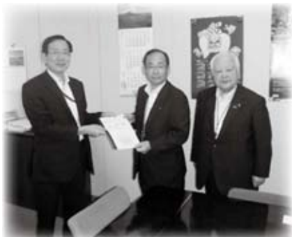
総務省及び厚生労働省へ、簡易水道と上水道の統合後の財政支援措置に関する要望を行いました(9月18日)