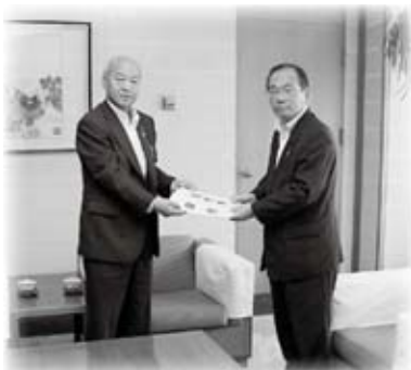
島根県農業協同組合いわみ中央地区本部から、交通事故防止機器の寄贈を受けました(9月24日)