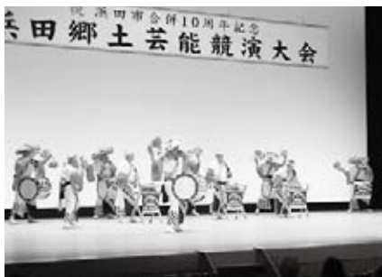
周布地・大谷田ばやし保存会（三隅）