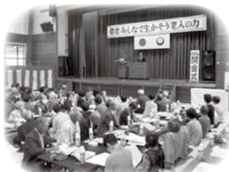
市内各所で行われた敬老会に出席しました(写真は弥栄自治区:9月23日)