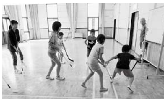
スポーツを通して市民の健康増進及び連帯意識の高揚を図るため、環境整備を行いました