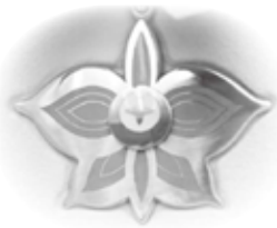
浜田市名誉市民章

名誉市民とは 市民又は市にゆかりの深い方で、公共の福祉を増進し、産業若しくは文化の進展に寄与し、又は自治の発展に貢献し、その功績が卓絶で市民から深く尊敬されている方に贈る称号です。