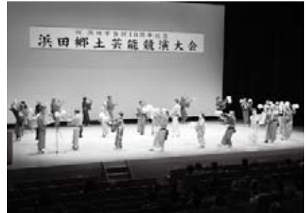
長見町盆踊り保存会（浜田）