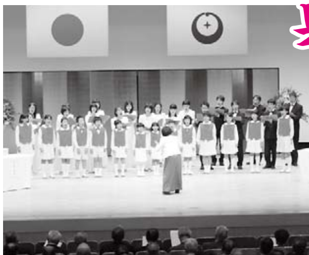
浜田少年少女合唱団S & Sほかによる市民歌合唱