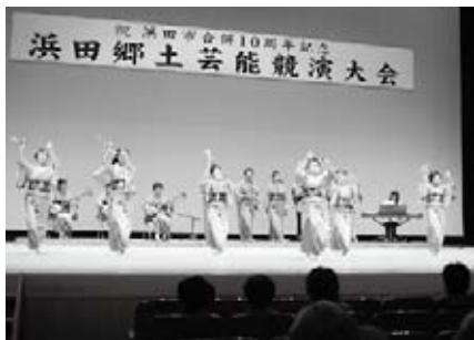
浜っ子ハイヤの会（浜田）