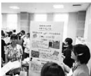
シンポジウムで活動報告を行う学生図書委員