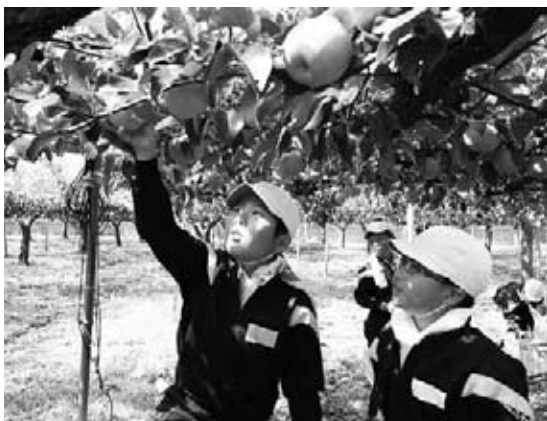
たわわに実った梨に手を伸ばす児童