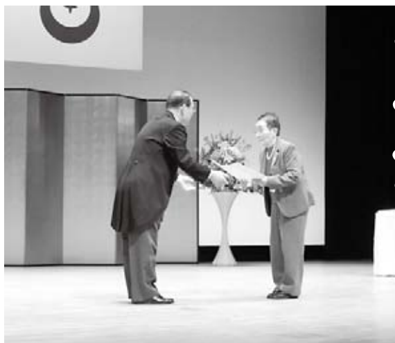
平成27年度浜田市表彰