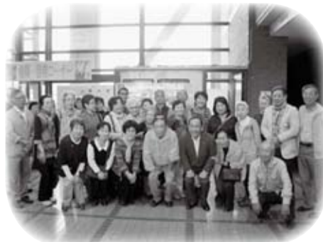
三重県松阪市から、松阪市・浜田市友好の会の皆さんが浜田市を訪問されました(9月30日)