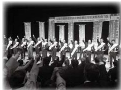
山陰自動車道建設促進島根県民総決起大会に出席しました(9月26日)