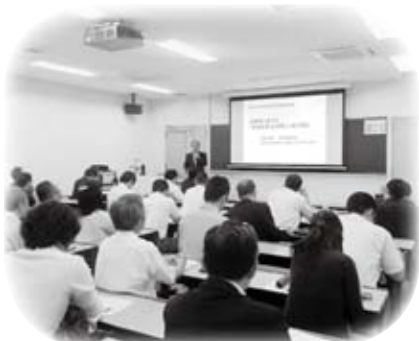
兵庫県西宮市の大手前大学で開催された地域活性学会第7回研究大会で意見発表しました(9月5日)