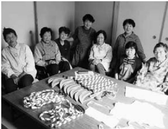
踊りに使われる小道具を作成しました