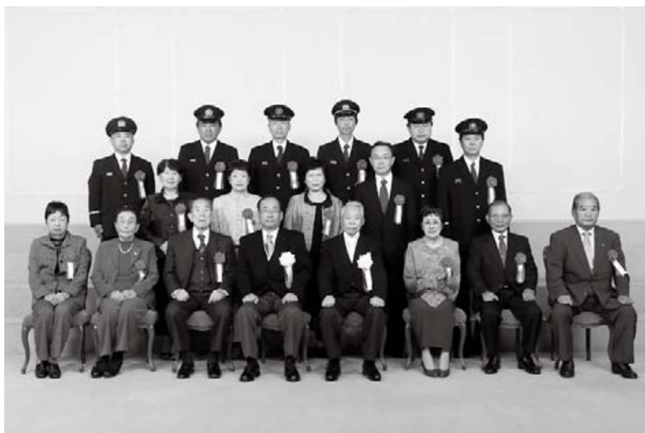
平成27年度浜田市表彰を受章された皆さん