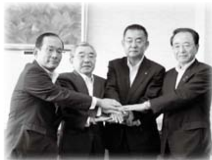
(株)デルタ・シー・アンド・エスが雲南工場の新設及び浜田工場の増設について島根県企業立地計画の認定を受け、覚書に調印しました(9月11日)