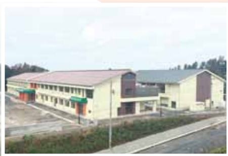
(写真⑫) 旭小学校校舎・体育館が完成