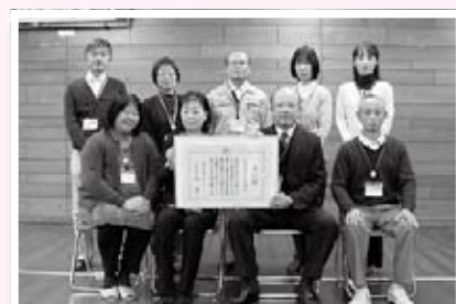
(写真⑤) 文部科学大臣表彰を受賞した石見公民館