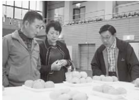
農産物品評会に多くの出品がありました

あいにくの雨模様でしたが、毎年恒例のロードレース大会やステージイベント、各種展示などが行われ、会場はにぎわいをみせていました。