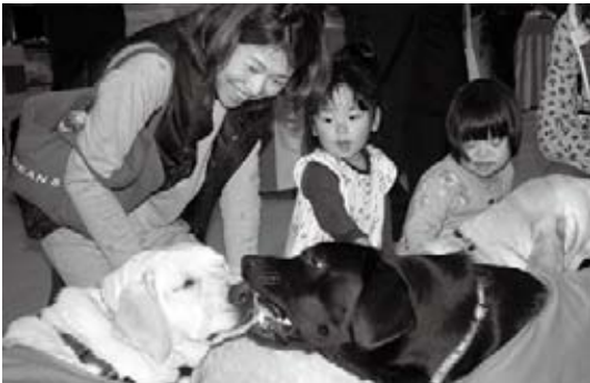
盲導犬もイベントに参加

多彩なステージイベントや各種展示、特産品販売などが行われました。また、各種のスポーツイベントもあわせて開催され、会場は大いに盛り上がりました。