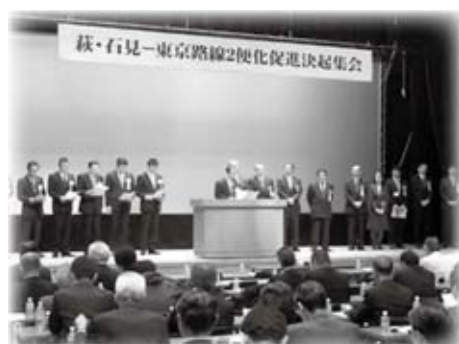
萩・石見空港-東京路線2便化促進決起集会に出席しました (11月16日)