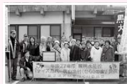
(写真④) 「ディスカバー農山漁村の宝」優良事例に選定された美又湯気の里づくり委員会