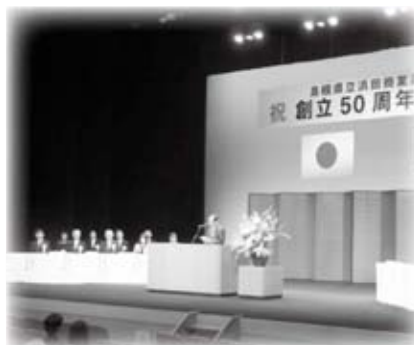
浜田商業高校創立50周年記念式典に出席しました (11月21日)