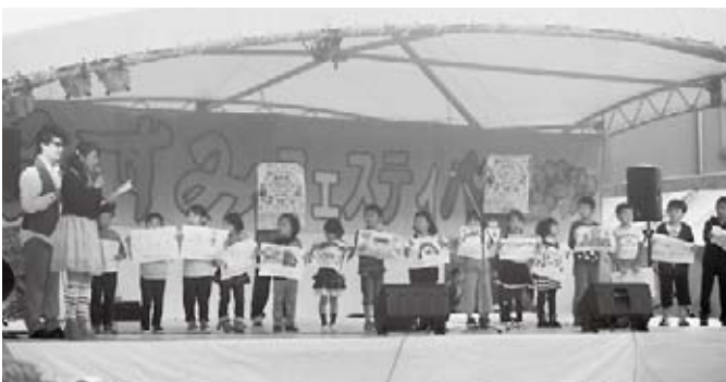
子どもたちが応募した絵が、今年のポスターを飾りました