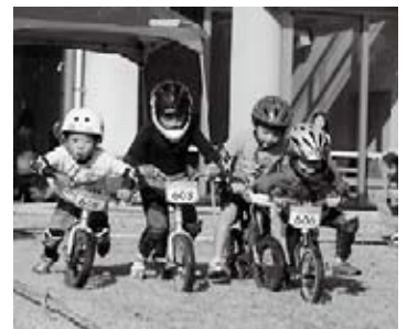
ゴーライズカップ(キッズバイク大会)に出場した子どもたち