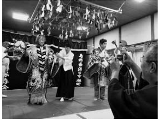
神楽衣装を試着して記念撮影

11月14日(土)には、都川神楽団による恵比寿と大蛇が上演され、来場者は迫力ある舞を楽しみました。演目の間には神楽衣装を試着することもでき、福山市からの参加者は「神楽衣装の重さに驚いた」と感激していました。