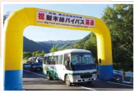
(写真⑨) 県道黒沢安城浜田線梨木峠バイパス開通