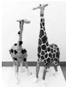
浜田の小学生の作品