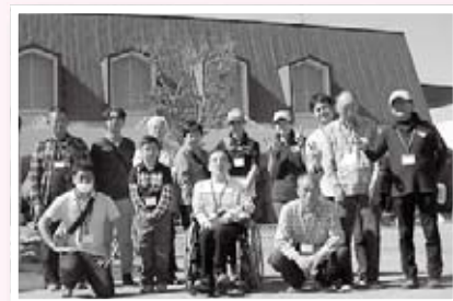
(写真③) 全国障がい者馬術大会で上位入賞したかなぎライディングパークチーム