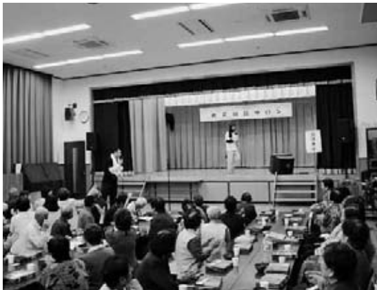
歌や踊りで盛り上がる会食会