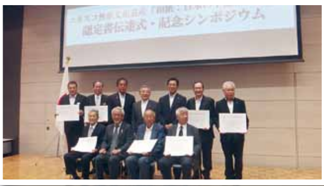
(写真⑤) ユネスコ無形文化遺産「和紙」認定書伝達式