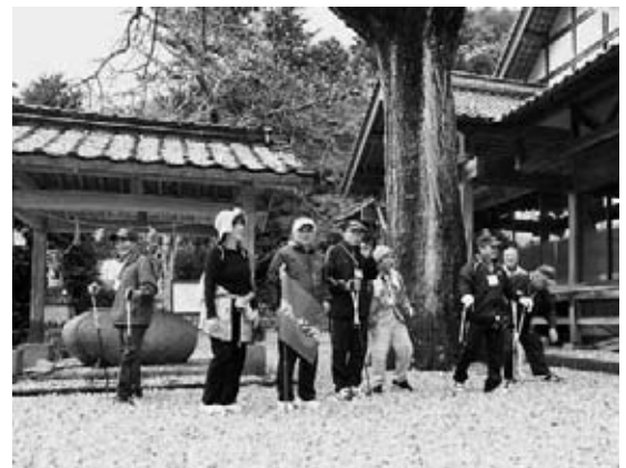
イチョウの落ち葉の上で一休み

当日は、天狗石農村交流センターを発着点に3kmと6kmのコースに分かれ、ポールを使ったノルディックウォーキングを行いました。ゴールした参加者には、地元の野菜がたっぷりのあったかいけんちん汁とおにぎりが振る舞われました。