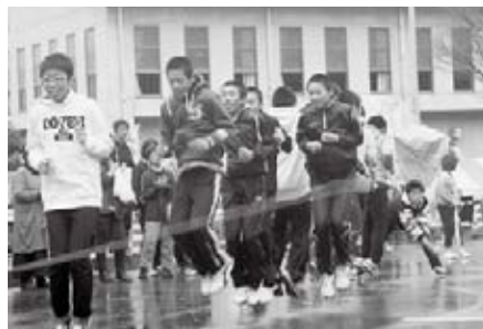
長なわとび大会、気持ちを一つにしてみんなでジャンプ