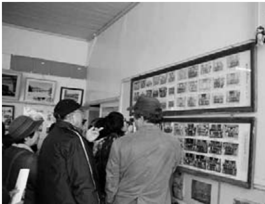
自分の卒業写真を探す参加者