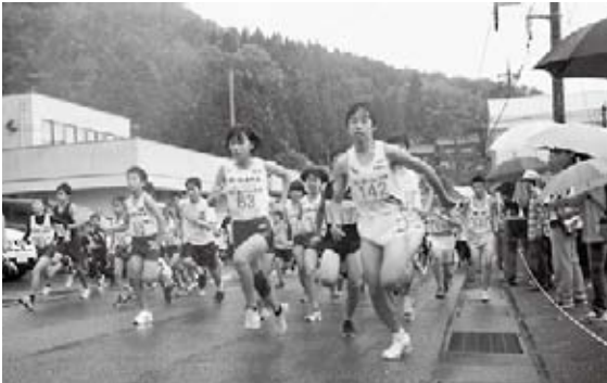
恒例の旭ロードレース大会、雨の中健脚を競いました