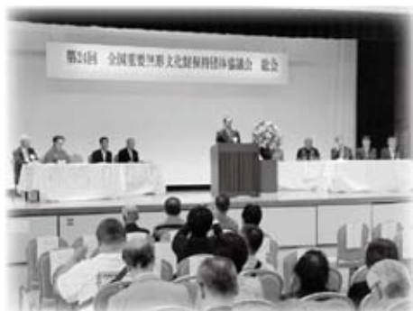
沖縄県久米島町で全国重要無形文化財保持団体協議会久米島大会を開催しました (11月5日)