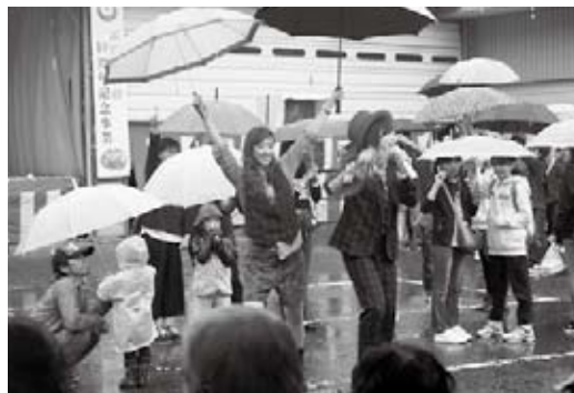
kotonohaの楽しいステージで、会場内は大盛り上がり