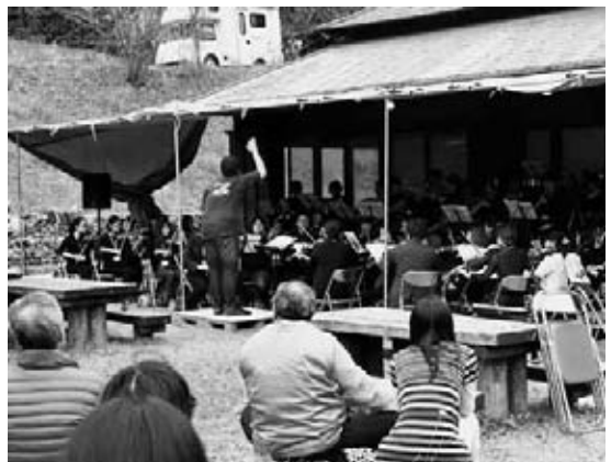
オーケストラの演奏に聞き惚れる来場者

全国のアマチュアオーケストラで活動する有志が集まりスペシャルオーケストラが結成され、当日はベートーベンの「運命」などクラシックの名曲を中心に、童謡や映画音楽など14曲が演奏されました。約300人の来場者は、山里に響き渡る迫力ある演奏に酔いしれていました。