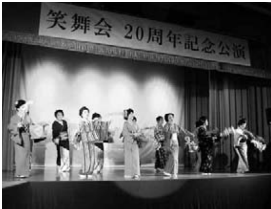
舞踊を披露する「いまふく笑舞会」のメンバー