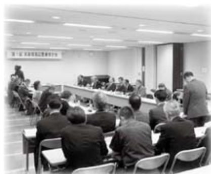
第1回浜田城周辺整備検討会を開催しました (11月26日)