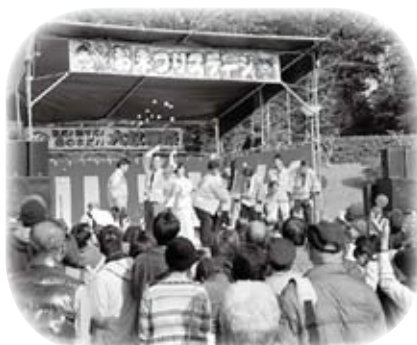
いわみ福祉会の大収穫祭に参加しました (11月23日)