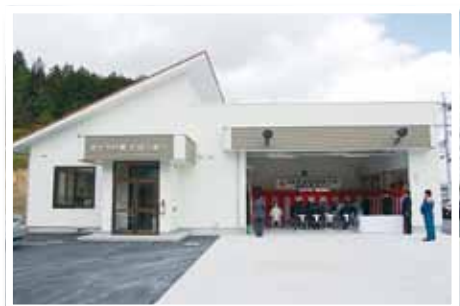
(写真⑦) 浜田消防署金城出張所を移転新築