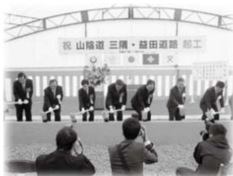
山陰道三隅・益田道路起工式に出席しました (11月21日)