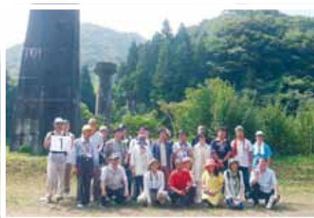
(写真⑧) 広浜鉄道今福線を活かすシンポジウム・現地見学会