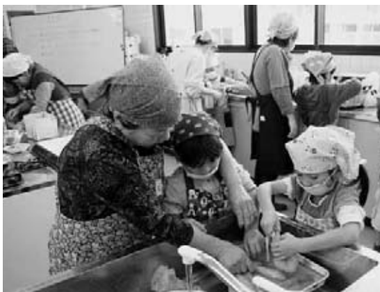
イカのさばき方を教わる子どもたち