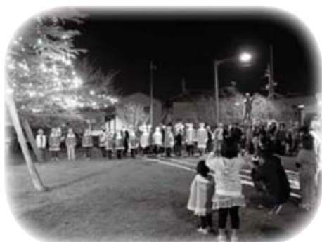
万灯山公園イルミネーション点灯式に出席しました (11月22日)