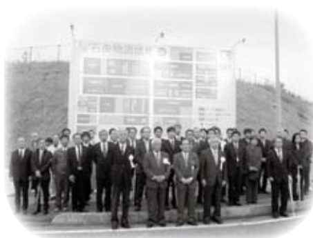
石央物流団地連絡協議会設立25周年を記念した新案内看板の除幕式に出席しました (11月20日)