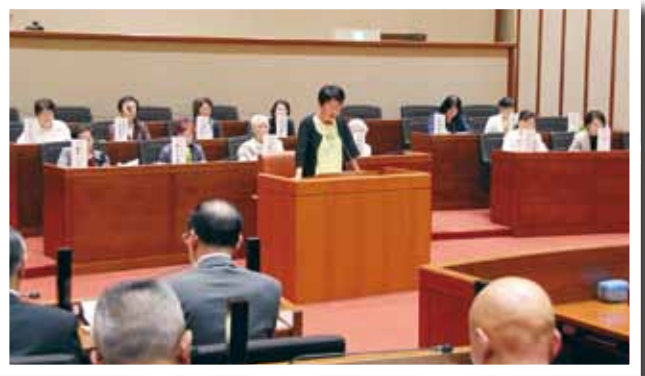
(写真②) 浜田女性ネットワーク市議会を開催