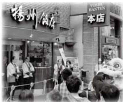
山陰浜田港特別コースが提供される揚州飯店島根フェアが横浜市で開催され、オープニングセレモニーに出席しました (11月7日)