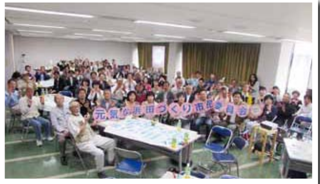
(写真①) 元気な浜田づくり市民委員会を開催