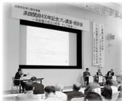
浜田開府400年記念プレ講演・座談会を開催しました (11月22日)