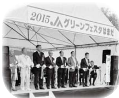
J Aしまねいわみ中央地区本部のグリーンフェスタはまだに参加しました (11月8日)