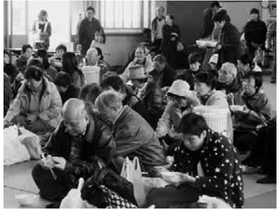
あったかい鍋を食べながらステージを楽しむ来場者

当日は、島根県立大学生によるよさこい踊りや大道芸、地域の皆さんによるのど自慢大会など様々な催しが披露されました。また、同推進委員が育てた大根やサツマイモなどの野菜をふんだんに使った鍋が来場者に振る舞われ、来場した約300人は、あったかい鍋を食べながら、多彩なステージイベントを楽しんでいました。