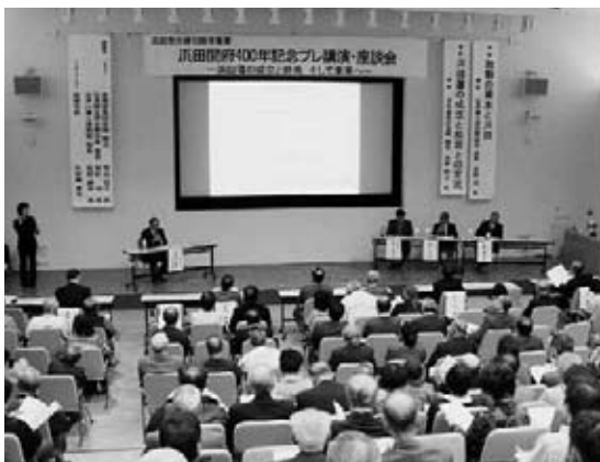
浜田藩の歴史についての解説に聞き入る来場者