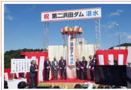
(写真⑪) 第二浜田ダム試験湛水開始