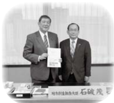
東京都で石破茂地方創生担当大臣と面談し、シングルペアレント介護人材育成事業について説明しました (11月11日)