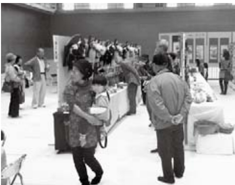
地域の皆さんの力作が並ぶ公民館展