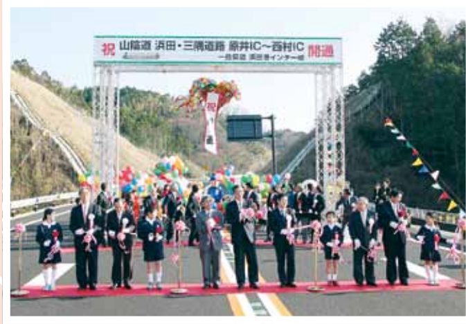
(写真③) 山陰道浜田・三隅道路(原井～西村) 開通