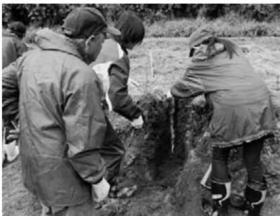
慎重に土を掘っていく参加者