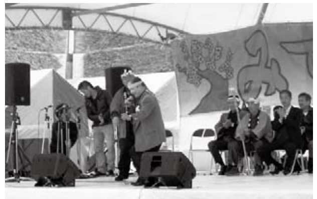
のど自慢大会で歌声を披露