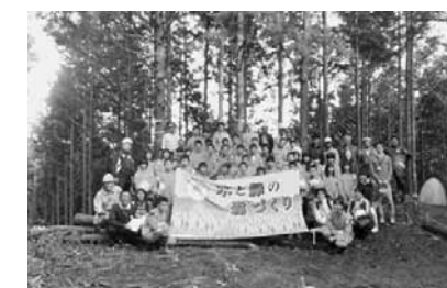
▲子供版きこりプロジェクト

町外にお住まいのご家族、ご親戚、ご友人に、ぜひ、この制度をご紹介ください。1万円以上のご寄附をいただいた方には、お礼の品として「奥出雲町の特産品」をお贈りいたします。