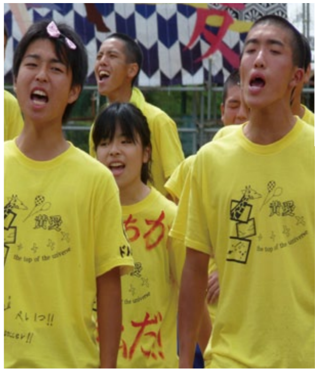
大迫力の応援合戦