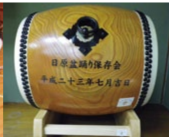
助成金を活用して整備した衣装（左）と和太鼓（右）