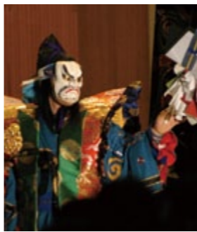
若々しくダイナミックな動きを取り入れた神楽