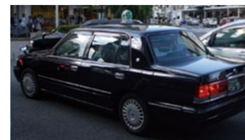
申請を忘れずに福祉タクシー利用券を使いましょう。

平 成23年10月3日から左記の方を対象に福祉タクシー利用券（後期分）の申請を受けます。 この券をご利用になるとタクシー料金が券1枚につき500円の助成を受けることができます。 ○対象となる方 ・身体障害者手帳1種のお持ちの方 ・身体障害者手帳2種の1級・2級所持者のうち障害部位が下肢、体幹または視覚機能障がい者の方 ・療育手帳Aの所持者 ・介護保険法に基づく要介護4・5と認定されている方 ※津和野町に居住されている方のみとなります。 ○申請場所 総合窓口（本庁舎） 福祉事務所（津和野庁舎） 申請の差には印鑑を忘