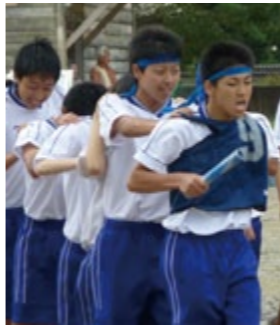
チームワークが大切な百足競争