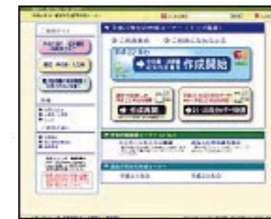
掲載画像は平成23年1月時点のものとなります

【国】税庁では、「医療費控除」や「住宅借入金等特別控除(住宅ローン控除)」など、どのような書類を用意して、どのように申告すればよいのかといった皆様の声から、より分かりやすく、便利なサービスをご利用いただけるよう、国税庁ホームページ(www.nta.go.jp)に、「確定申告特集ページ」を開設計、確定申告に関する様々な情報を提供しています。