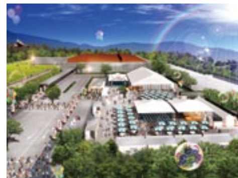
神話博しまね特設会場 (イメージ)

「し」の国のはじまりの物語が綴られた日本最古の歴史書「古事記」。そこに描かれた神話の舞台が「島根」です。 島根県では、県民の皆様が数々の神話の舞台となった島根の良さを再認識し、その魅力を磨き上げ観光客の皆様をおもてなしすることが、観光誘客だけでなく地域への愛着と誇りを育むことにつながるといふ基本理念のもとに、「神々の国しまね」プロジェクトを展開しています。 古事記編さんから1300年を迎える来年7月21日から11月11日まで、『神話博しまね』が開催されます。島根県内各地で神話のロマンと魅力を感じることができるイベントです。主会場である出雲大社周辺の特設会場では、大迫力の映像で神話の魅力を体感できる『神話映像館』、県民の皆様ご自身が出演する『しまね魅力発信ステージ』などを企画しています。『おもてなし』につ