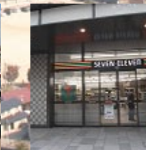
京都府京都市「近鉄名店街みやこみちのコンビニ」