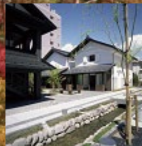
山形県山形市「水の町七日町御殿塚」