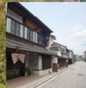
広島県三次市「三次町上市・太才通り・三次本通り」