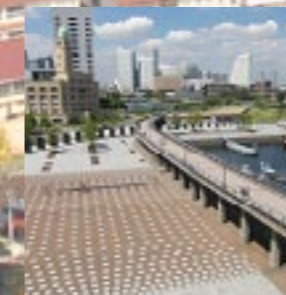
神奈川県横浜市「山下臨海線プロムナードと象の鼻パーク」