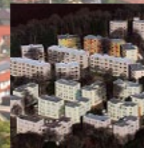
茨城県つくば市「筑波大学学生宿舎リニューアル」