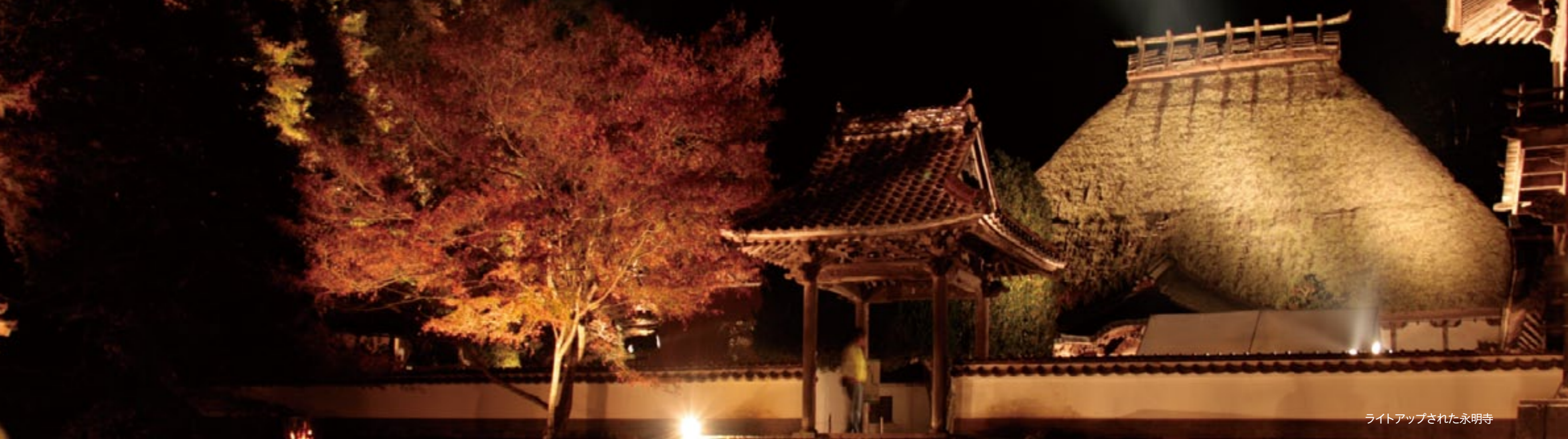
ライトアップされた永明寺