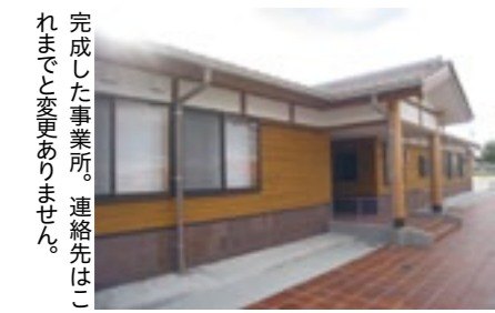
完成した事業所。連絡先はこれまでと変更ありません。

島 根県益田児童相談所は、これまで使用してきた建物が、建築から 40 年以上が経過し老朽化したことから、この度新築移転をしました。新築にあたっては、児童の一時保護に際しての生活スペースを広くするなど、相談・保護の施設・設備の充実を図りました。 児童相談所は、18 歳未満の子どもさんに関することについて、家庭、学校、保育所、地域の方々などからの相談をお受けします。そして、市町の児童相談の窓口と連携しながら、子どもさんの健やかな成長に向けて問題を解決していく専 門機関です。子どもさんについての心配事などがありましたら、役場の担当窓口あるいは相談所にご連絡ください。 また、近年相談所が受ける相談の中で、家庭事情などにより養育支援が必要な児童、被虐待児童に関する相談の割合が高くなってきており、長期にわたり様々な方面からの支援を行うことも増えていきます。こうした事例への支援を行うには、多くの関係者の協力なしにはできない状況です。今後とも、地域の関係者の皆さんのご協力をよろしく願います。