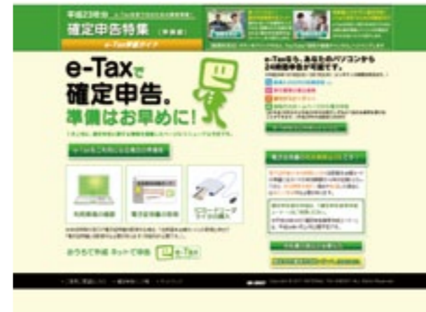
掲載画像は平成23年12月時点のものとなります