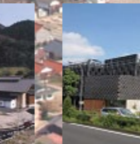
愛知県名古屋「八事興正寺の立体駐車場と八事交番」