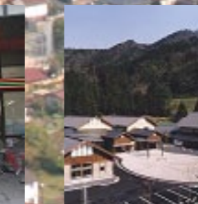
京都府伊根町「伊根町コミュニティセンター」