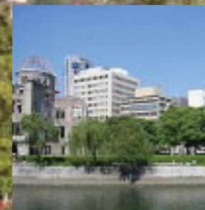
広島県広島市「看板のないビル群」