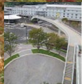
熊本県熊本市「熊本駅周辺地域都市空間デザイン」