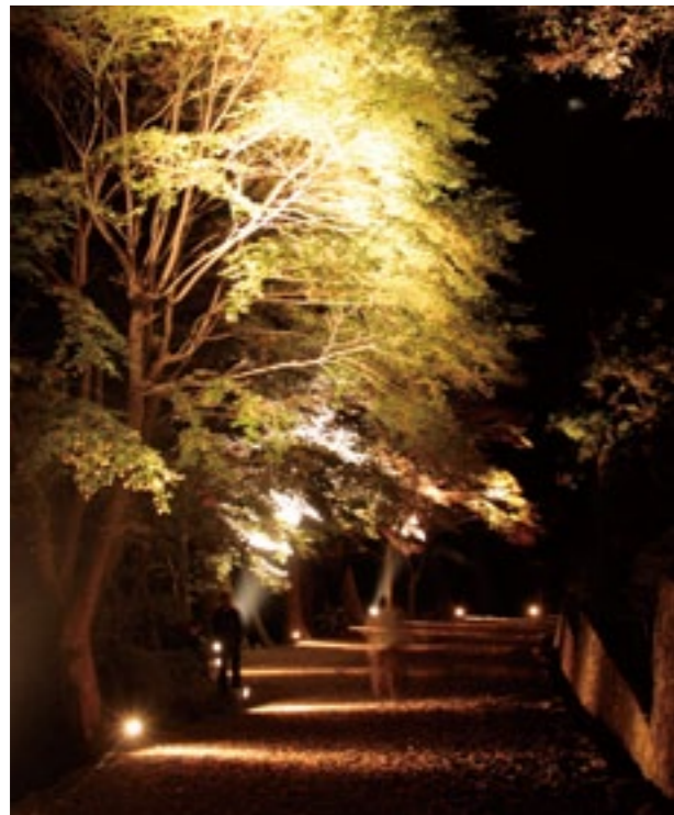
参道もライトアップされ、いつもとは違った魅力を見せていた。(左)