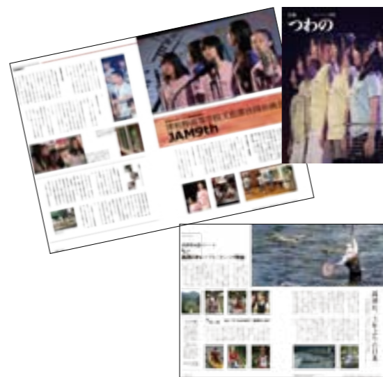
広報紙のバックナンバーについては営業課までお問合せください。町HP上でも閲覧可能です。

鳥根 が主催する平成23年度鳥根県広報コンクールにおいて、町が発行する「広報つわの9月号」が町内の部で特選となりました。審査会では、以下の点が評価されています。 1. 地元の子どもたちに目を向けた特集が、町全体で見守り育てていく姿勢として伝わってくる 2. レイアウト、記事が見やすく、センスがよい。硬派な企画も見てみたい 3. チャレンジ精神を感じ