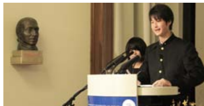
式辞を述べる高校生