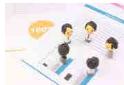
講座の時間は内容により20～120分と幅広くご用意しています。自治会の会議や、各種集会の講座のネタとしてもご利用下さい。

町では、皆さんからの要請を受けて、町政に関する説明や、職員の持つ専門知識を生かした講習等を行うことにより、皆さんのまちづくりへの参加意識を高め、コミュニケーションを取りながら共に学んでいく機会を増やすために当該講座を実施しています。 講座には、皆さんの役に立つ講座を30種類ご用意させていただきます。 各講座の内容等については町ホームページでご確認いただくか、担当課までお問い合わせ下さい。 申込方法 講座の開催には、事前の申込が必要となります。役場にある専用の申込用紙に必要事項を記入してつわの暮らし推進課または各講座の担当課へ提出します。 申込は開催日の20日前までに行ってください。 皆さんにお願い 当日の会場などの準備は