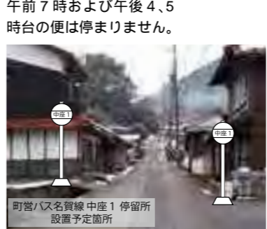
バス停留所はイメージのため実物とは異なります。