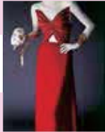
《森のあいドレス》1990年春夏 島根県立石見美術館蔵

日本人として世界を舞台に活躍したファッション・デザイナー、森英恵。本展では華やかなオートクチュール作品を中心に、舞台衣裳や映画衣裳、制服まで、幅広い仕事を一堂に紹介します。