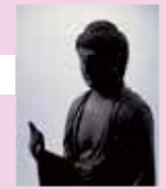
《阿弥如来立像》清泰寺蔵

石見地域を中心に隣接する出雲、安芸、周防、長門の各地の仏像を通して、古代から時代ごとに特徴ある、この地域に生きた人々の祈りのかたちをご覧いただけます。