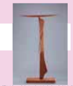
澄川喜一《そりのあるかたちA》個人蔵

島根県の吉賀町に生まれた彫刻家・澄川喜一。木や石の素材を活かし、日本の伝統美に感応した作風の全貌に迫ります。抽象造形がもたらす空間の粋を体感してください。