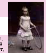
ラファエル・コラン《エアーズ嬢の肖像》島根県立美術館蔵

西欧と日本の近現代の子ども服を中心に、絵画、写真、版画、書籍などから、子どもの姿をのぞく多彩な表現を追いかけ、時代ごとに化する子ども服を検証します。