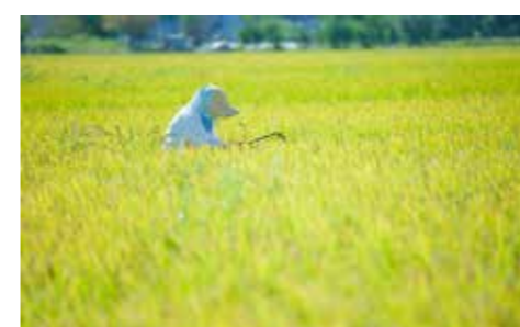
周りに配慮して作業を行いましょう

農薬は、使い方を間違えると、生物や環境に影響を与えてしまう薬剤です。使用方法をきちんと守り、注意して使用しましょう。 特に農薬を散布するときは、風などに気を配り隣接農地（農作物）などに飛散しないようにしましょう。飛散が原因で農作物の被害が生じ、出荷ができなくなるなどの損害を与える場合があります。トラブル発生の原因となります。 次のことに注意して適切に取り扱いをしましょう。 ① 農薬使用回数や量を減らしましょう！ ② 飛散防止に最大限の配慮をしましょう！ ・ 農薬を散布する場合は、周辺の栽培者に対し事前に十分に周知をしましょう。 ・ 飛散の少ない形状の農薬、散布方法、散布機具を選択しましょう。 ・ 散布時には、無風又は風の弱い時、風向きに注意し、飛散の恐れのある場合は、使用しないように