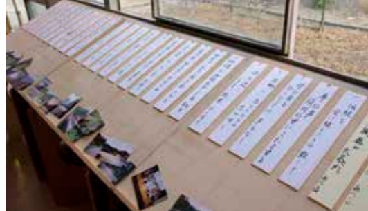
文字と写真とで伝わる須川への想い。

ロゴの作成にはそもそも須川地域のことを知らなければなりません。そこには地域住民の協力がありました。年代や性別の異なる5名がそれぞれ想いを込めた川柳をのし、そのイメージに合う風景を写真に収めました。そこから作者に聞き取りをし、イメージを膨らませ、形となりました。