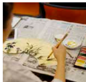
【伊場仙 扇子作り体験 イメージ】