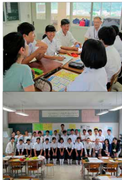
認知症を正しく楽しく学びました。

講座は、認知症の正しい知識、対応法を子どもの頃から身につけることで「生きる」ことを考える、また、地域に暮らす高齢者も含め、誰にでも優しく親切にすることの意義を学ぶ貴重な場にもなりました。講座を受けた生徒のほとんどが病気に対する理解と接し方について理解できたようで、今後の関わり方について「相手の気持ちを考えて、優しく接したい」「人事だと思わずに困っている人がいたら優しく声をかけてあげたい」と、しっかりと病気の症状とその接し方について正しく学習できたようです。