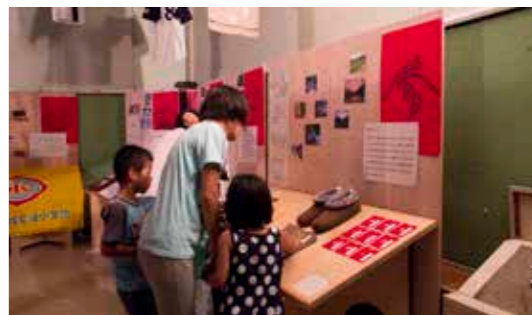
ひとつひとつのロゴに大切な意味があります。

5つのロゴに込められたもの。それはこの地域で暮らす住民の生き様でした。1つは心に残る風景を表し、1つは地域の特徴的な活動を表すなど、そこに住み続ける人の誰もが頷けるもので、来場者は与えられた1票をどのロゴに投じるかに頭を悩ませていましたが、そこには楽しく地元のことを語る笑顔がありました。