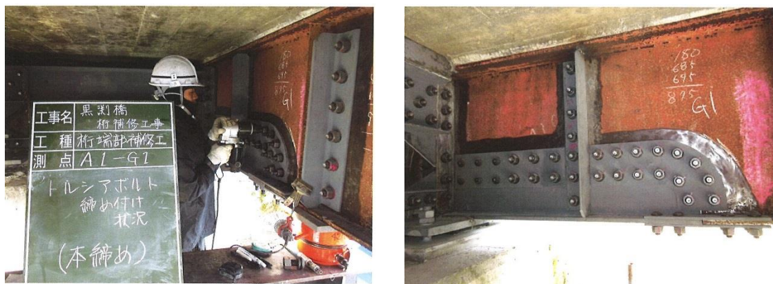
写真4-1 当て板工実施状況

激しい腐食による鋼部材の減厚が生じた箇所に対し、腐食箇所を取り囲むように当て板（添接版）を施すことにより鋼部材を補修する工法です。