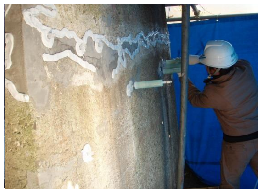
写真4-2 ひび割れ注入状況

ひび割れを塞ぐことにより、劣化因子（水分、塩化物など）の侵入を防止し、コンクリートの耐久性を向上することができます。