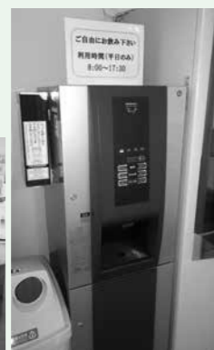
庁舎西側入り口付近の給茶機