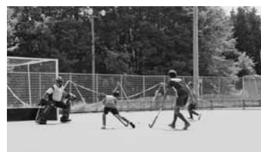
▲ホッケーアカデミーの様子

8月26日、横田高校ホッケーグラウンドにおいて、島根県ホッケー協会主催のホッケーアカデミーが開催されました。