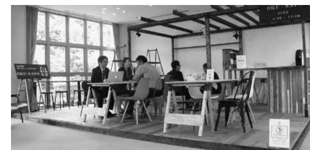
▲木の温もりが感じられる空間

内装は気軽に訪れやすいようなウッドデッキ風のデザインを採用し、多くの地域住民の皆様へ協力いただき作り上げました。また、打ち合わせ、自習などに無料で利用できるスペースを設け、相談以外での利用が可能です。