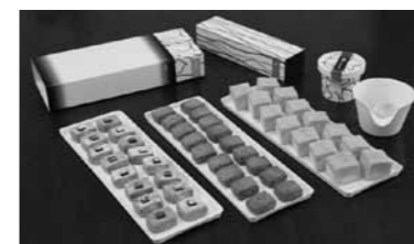
▲試食会に出された創作菓子

衝撃吸収材を使用した製品を製造している(株)加地が仁多米の焙煎玄米を活用した創作菓子を開発し、8月19日に三成の本社工場で商品発表試食会を開催しました。