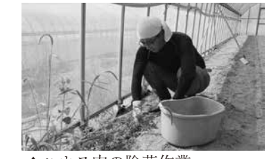
▲ハウス内の除草作業