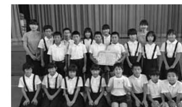
▲受賞した布勢小学校3・4年生の児童

みんなで調べる宍道湖流入河川調査に参加した布勢小学校が環境省中国四国地方環境事務所長賞を受賞しました。