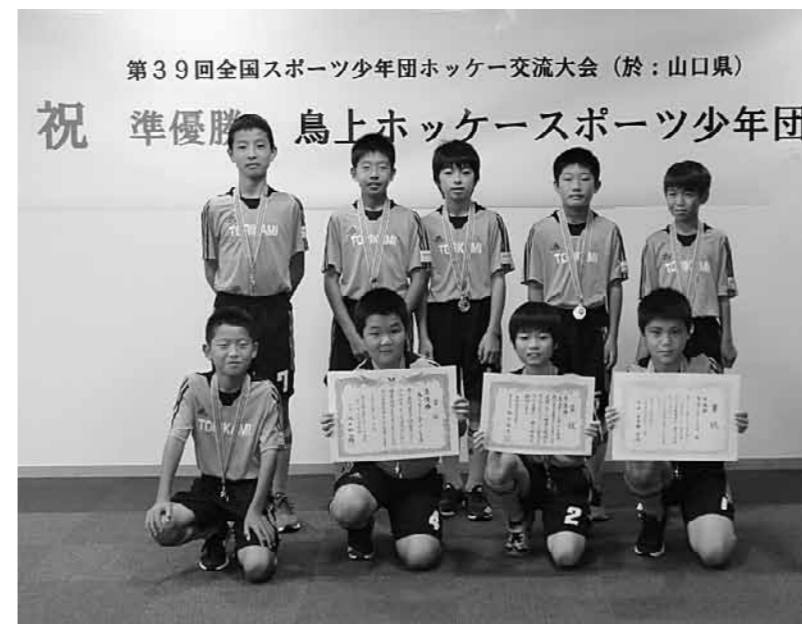
▲準優勝に輝いた鳥上ホッケースポーツ少年団

8月5日から6日に、山口県で開催された第39回全国スポーツ少年団ホッケー交流大会において、鳥上ホッケースポーツ少年団が町内で初の準優勝に輝きました。