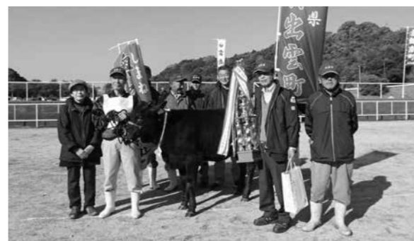
▲第1区首席に輝いた「かつざくら」号

11月10日、松江市宍道町の島根中央家畜市場で、平成29年度島根中央子牛共進会が開催され、県内の市町村から出品された40頭について発育、栄養度などの審査が行われました。