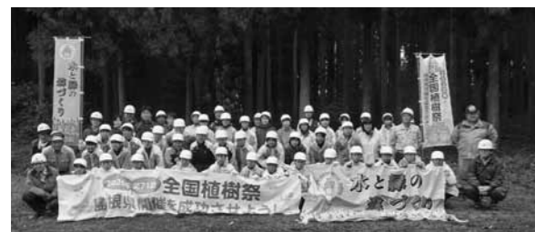
▲参加した横田中学校の生徒たち

「子供版きこりプロジェクト」が町内両中学校の1年生を対象に、三成八幡宮の参道脇の森で行われました。