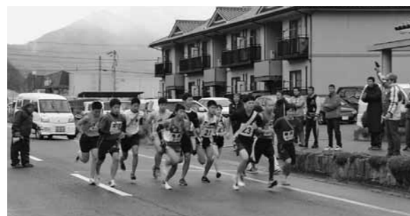
▲スタートした第1区の選手

11月19日、仁多郡駅伝競走大会が開催され、第1部(支部対抗)に8チーム、第2部(一般参加)に4チームが参加し、阿井から亀嵩までの6区間25.8kmで健脚を競いました。