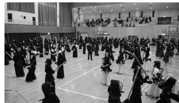
▲12月2日には錬成大会(練習試合)を開催

今年は、中国・四国地方の各県から男女合わせて48チームが出場。本町からは、仁多・横田の両中学校の男子チーム、女子チームがそれぞれ出場し、日頃の鍛錬の成果を競い合うとともに親睦を深めました。