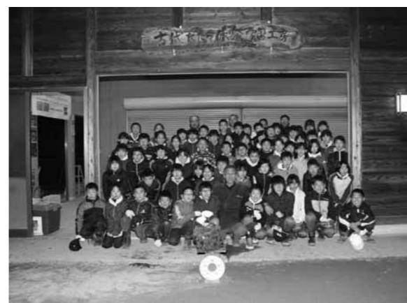
▲参加した児童たち