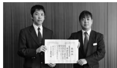
▲受賞された奥出雲交通(株)

国土交通省では、自動車輸送統計調査において、多年にわたり精励し、顕著な功績のあった報告義務者を統計調査関係功労者として表彰されています。