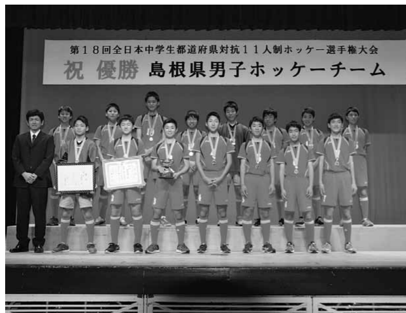
▲仁多中9人、横田中6人で構成された島根県男子ホッケーチーム

11月11、12日に福井県で開催された第18回全日本中学生都道府県対抗11人制ホッケー選手権大会において、仁多中学校・横田中学校からの選抜選手で構成された島根県男子ホッケーチームが2年ぶり5回目の優勝を飾りました。