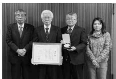
▲勝田町長とNPO法人さくらおろちの皆さん

NPO法人さくらおろちが尾原ダム周辺で取り組んできた上下流の地域間交流を通じて、治水に対する相互理解を深めたことが評価され、一般社団法人日本ダム協会のダム建設功績者表彰を受賞されました。