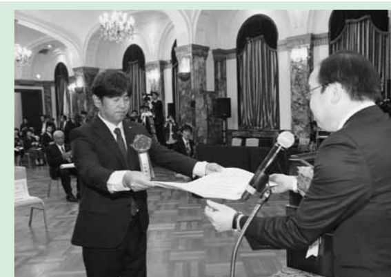
▲受賞の様子

奥出雲町文化体験実行委員会が2017年度第48回博報賞日本文化理解教育部門において文部科学大臣賞を受賞しました。博報賞は、公益財団法人博報児童教育振興会が実施し、子どもたちに対する優れた教育活動に贈られる賞です。また、本町が受賞した文部科学大臣賞は、博報賞5部門の受賞者の中から、特に奨励に値する活動に贈られるものです。この度の受賞が子どもたちのふるさとを愛する心や誇りに繋がっていくことを願います。